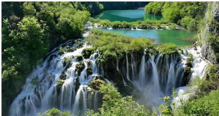
Slika 1. Plitvička jezera [28]

Trogir, Eufrazijeva bazilika u Poreču, stari grad Dubrovnik, Plitvička jezera i Katedrala u Šibeniku. Pod UNESCO-ovom zaštitom su i nematerijalna kulturna baština kao: paška čipka, festa sv. Vlahu u Dubrovniku, hvarske procesije za križen, kastavski zvončari, zagorski majstori drvenih igračkaka. Na slici 1. nalaze se Plitvička jezera.