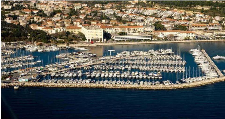
Slika 2. ACI marina Split [29]

voda. Održivo poslovanje i zaštita okoliša je ono o čemu ACI vodi brigu. U zadnje tri godine u 14 ACI marina instalirane su punionice električnih automobila. Na slici 2. Nalazi se ACI marina Split.