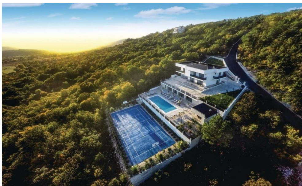
Slika 4. Vila u Imotskom [31]

Vučipolje. Staza je duga gotovo šest kilometara, a izabrana je jer se nalazi u ruralnom dijelu županije, koja gradi svoju turističku ponudu na temelju prirodnih resursa. Ovo je šesta tematska staza na području Dalmatinske zagore, a sufinancirana je preko Programa razvoja turističke infrastrukture. Ovaj vid turizma spoj je prirodnih ljepota i avanturizma, kao i gastronomije i kulture, a sve na jednom mjestu. U ovoj godini županija je uložila 2 milijuna kuna za izgradnju staza u Zagori. Ulaganjima u ruralni turizam želi se ponuditi jedna nova turistička destinacija za korištenje usluga aktivnog i avanturističkog turizma, čime bi postojala mogućnost produžetka sezone. Slika 4. prikazuje primjer seoskog turizma u Imotskom.