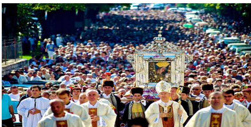
Slika 5. Hodočašće u Sinj [32]

Najčešći oblik vjerskog turizma su hodočašća. Najomiljenija odredišta hodočasnika su Gospina svetišta, ne samo u Hrvatskoj nego i u svijetu. Prema podacima WTO-a više od 35% građana putuje na ova odredišta. Vjerski turizam veliki je potencijal cijele godine, a slabo je prepoznat kao potencijal u Hrvatskoj, iako je najstariji oblik turizma. Našu zemlju godišnje posjeti više od 1,7 milijuna turista. Svi oni motivirani su vjerom za dolazak u Hrvatsku. Najviše se posjećuju dvadesetak marijanskih svetišta. Najveći broj gostiju posjeti Mariju Bistricu, zatim svetište Majke Božje na Trsatu, Gospu od Utočišta u Aljmašu, Čudotvornu Gospu Sinjsku...Hrvatska je zemlja bogata sakralnim djelima od kojih su mnoga pod zaštitom UNESCO-a (Eufrazijeva bazilika u Poreču, trogirski katedrala, crkva svetog Marka u Zagrebu, katedrala sv. Jakova u Šibeniku). [10] Slika 5. prikazuje hodočašće u Sinju za Veliku Gospu.