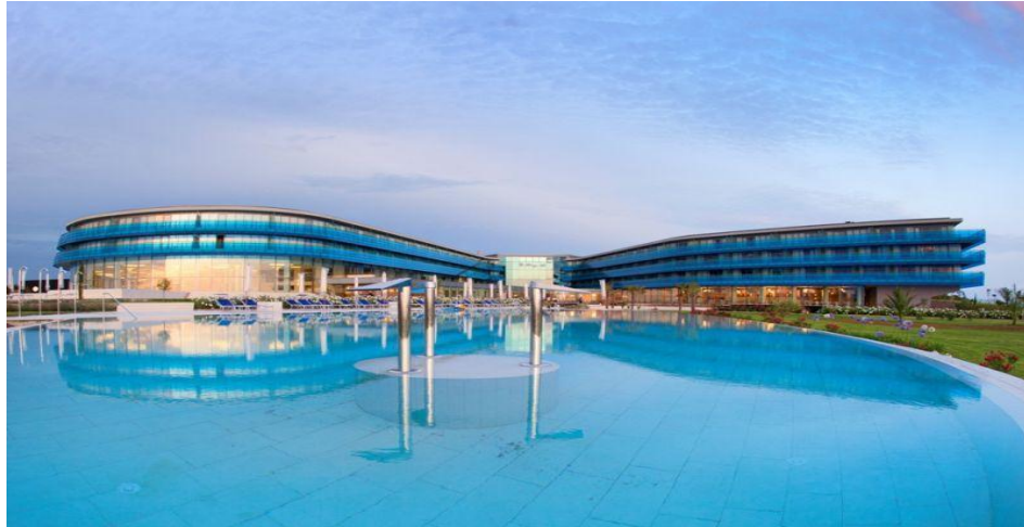
Slika 7. Falkensteiner [34]

Hrvatska prati najnovije svjetske wellness trendove. U Termama Tuhelj svih sedam trendova sastavni su dio njihove ponude. Hrvatska ima jedan od najvećih wellness centara u ovom dijelu Europe, u Petričanima pored Zadra. Na slici 7. prikazuje se primjer wellness centara u Petričanima.