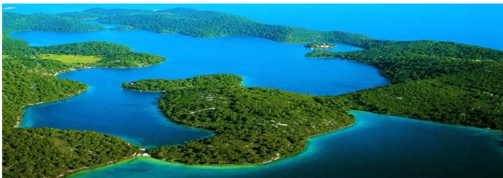
Slika 3. NP Mljet [30]

Projektom Mljet–Odise(j)a Mediterana, NP Mljet želi poboljšati posjetiteljsku infrastrukturu te edukativne i rekreativne sadržaje parka. Projekt je financiran novcem Europskog fonda za regionalni razvoj. U sklopu ovoga Projekta krajem prošle godine 19.-20. listopada 2019. godine održan je prvi Mljet Outdoor festival. Cilj ovog događanja je posjetiteljima omogućiti da sudjelovanjem u radionicama i rekreativnim aktivnostima upoznaju prirodne ljepote otoka kao i gastro ponudu. Slika 3. prikazuje NP Mljet.