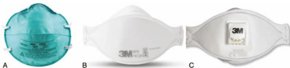
Slika 3. (A) čaša-tip respirator (B) savitljivi tip respiratora (C) valvula tip respiratora- sličan savitljivom tipu ali sadrži valvulu koja smanjuje izdisajni otpor [31]

Dakle, čak i ako osoba ispravno koristi N95 masku, postoji rizik od infekcije koji je povezan s pokretima npr. kompresije prsnog koša tijekom reanimacije. Snažni pokreti pružatelja prve pomoći tijekom kardiopulmonalne reanimacije mogu utjecati na zaštitnu učinkovitost respiratora. [32] Korejski zdravstveni radnici koji su nosili N95 filtrirajući respirator tijekom kardiopulmonalne reanimacije osobe koja je bila zaražena srednje istočnim respiratornim koronavirusom (MERS-CoV), zabilježili su poslijedičnu zaraženost istim virusom [33]. Ispitani su učinci kompresije prsnog koša (KPK) na zaštitnu učinkovitost respiratora kod tri vrste respiratora, čaša-tip ( eng. cup-type ), savitljivi tip ( eng. fold-type ), i valvula tip ( eng. valve-type ). (Slika 3.) Pokreti tijekom pružanja KPR-a smanjili su prihvatljivu razinu učinkovitosti čaša-tipa i valvula tipa, ali ne i savitljivog tipa respiratora. Savitljivi tip respiratora imao je značajno bolju razinu zaštite u usporedbi s druga dva ispitana. Čaša-tip respiratora imao je najslabiju razinu zaštite od gore navedenih [31].