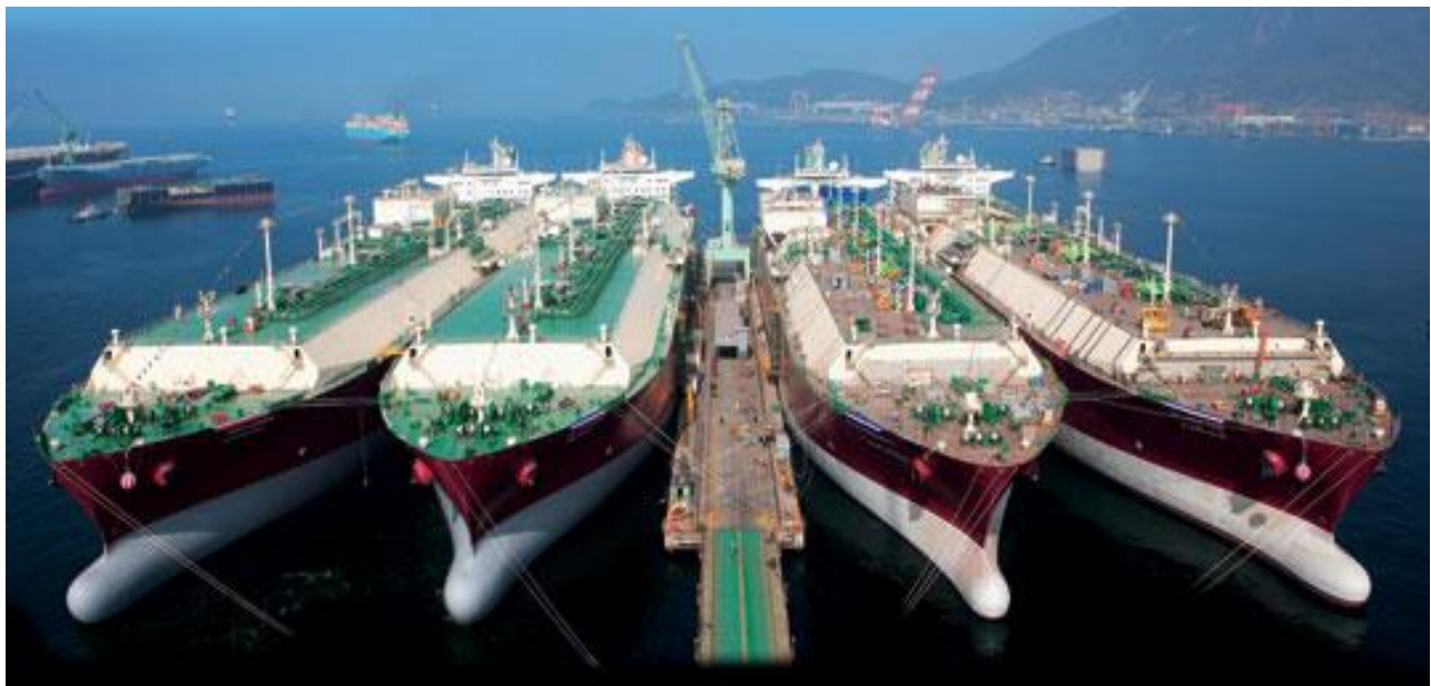
Slika 2. Flota za prijevoz tereta na tržištu pomorskog prijevoza

U nastavku rada pomnije je obrađeno teretno brodarstvo te vozarine koje vrijede u teretnom brodarstvu.