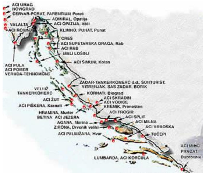
Slika 2. Marine u Hrvatskoj [14]

Kroz sljedeće poglavlje ovog rada se dalo uvid u različite mjere kojima se ovi ciljevi implementiraju i time utječu na održivi razvoj cjelokupnog sustava pomorskog turizma u Republici Hrvatskoj.