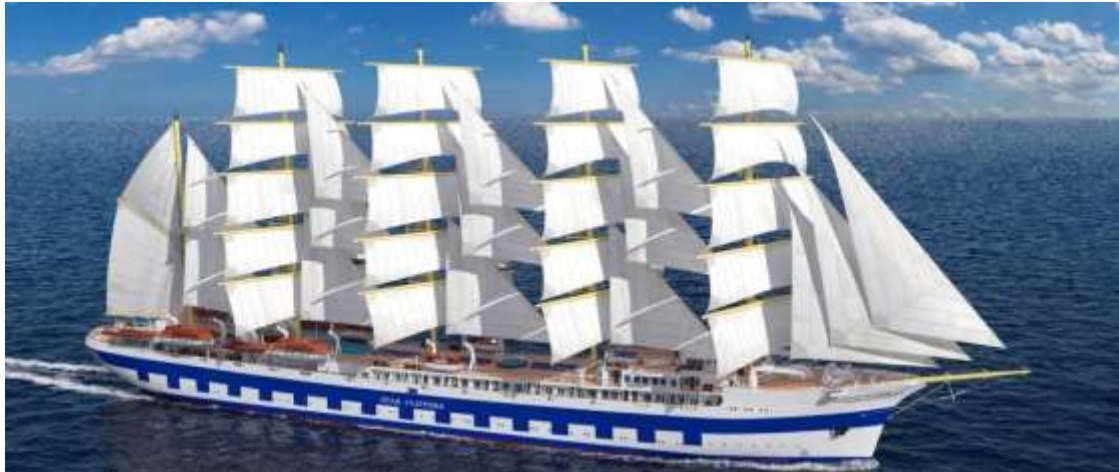
Slika 7. Novogradnja 482