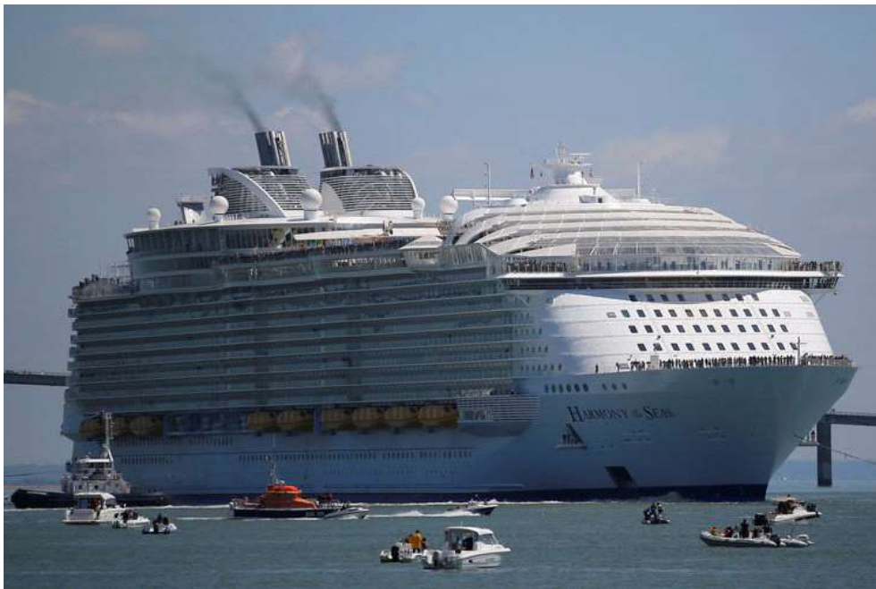
Slika 5. Harmony of the sea