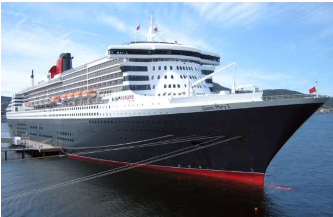
Slika 6. Queen Mary 2