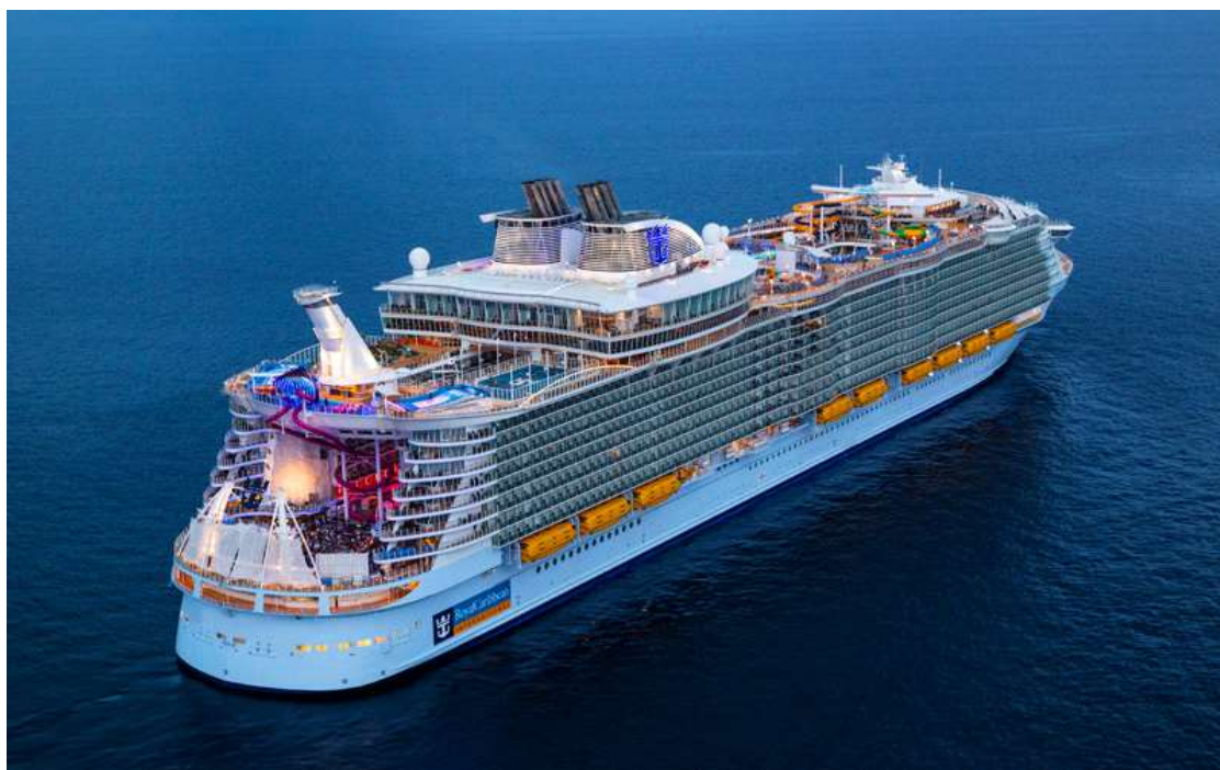
Slika 4. Symphony of the sea