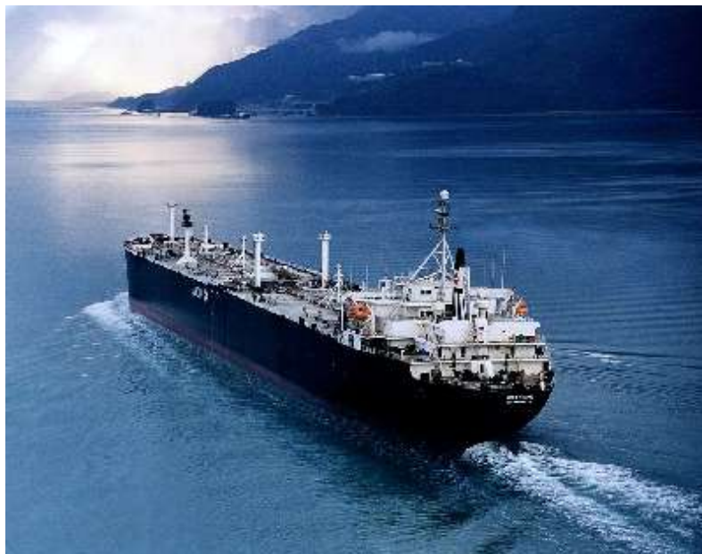
Slika 3. Taner