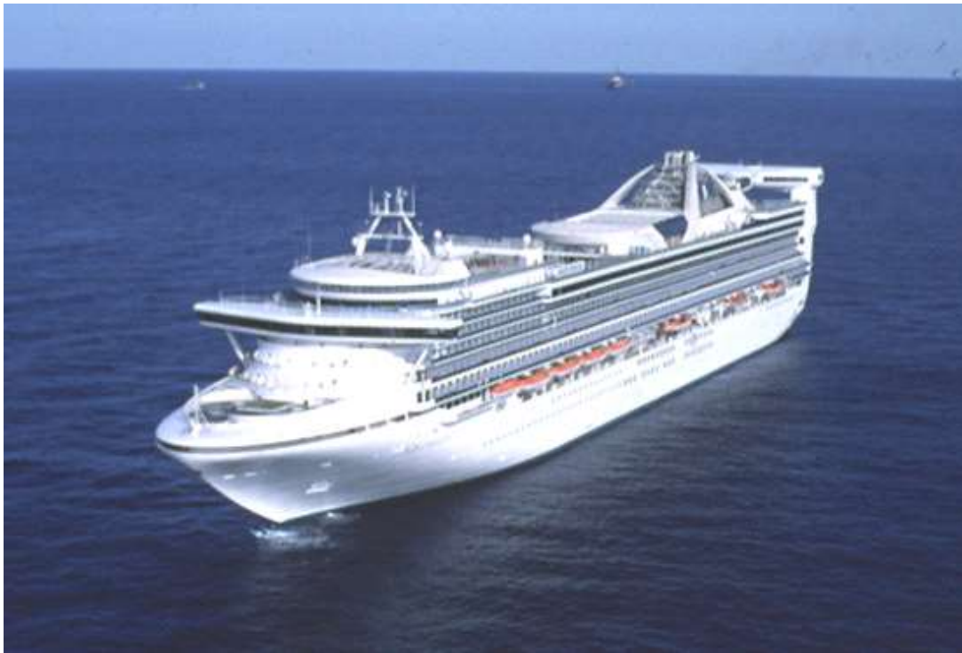
Slika 2. Cruiser