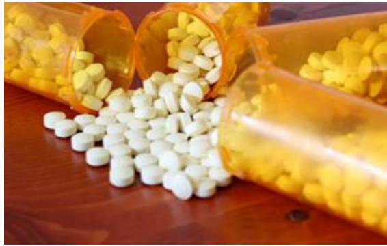
Slika 1. Lijekovi u obliku tableta [18]