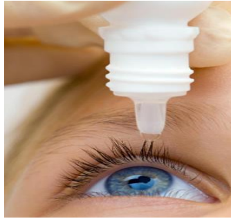
Slika 4. Lijekovi u obliku kapi [21]