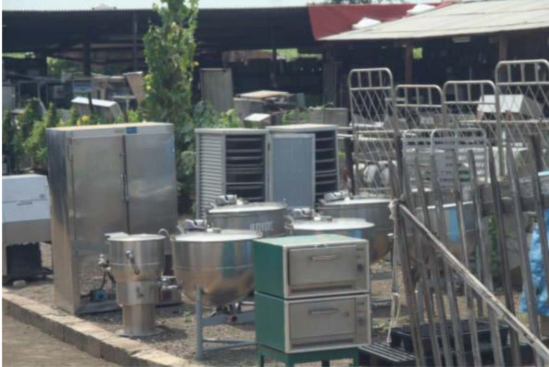
Slika 4. Dijelovi uklonjeni s broda prije konačnog rezanja konstrukcije [17]

preuzimaju određeno plovilo kako bi ga temeljito pretražili i uklonili korisne predmete koji mogu uključivati cjevovode, električne žice, elektroniku, namještaj i strojeve. Sve ove stavke ponovno se koriste ili prodaju na lokalnom tržištu.