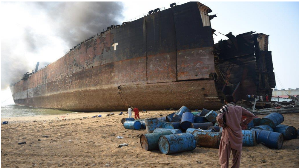
Slika 9. Olupina zapaljenog broda dan nakon eksplozije plinskog cilindra u dvorištu brodogradilišta Gadani, 2. studenog 2016. godine [25]

U Pakistanu područje gdje se obavlja najviše recikliranja brodova su Gadani, Balochistanu. Gadani brodogradilište je treće po veličini na svijetu. Dvorište se sastoji od 132 brodska terena koja se prostiru preko 10 km dugačke obale, oko 50 kilometara sjeverozapadno od Karachi. Godine 1980. Gadani je bio najveće brodogradilište u svijetu, s više od 30.000 izravnih zaposlenika. Recikliranje se provodi metodom plaža. Područje plaže se prostire na 1.256 hektara, a sastoji se od 314 parcela od oko 4 hektara. U brodogradilištu ne postoje stroge mjere zaštite okoliša, te sigurnosti i zdravlja ljudi. Na slici ispod prikazani su radnici bez adekvatne opreme dan nakon nesreće eksplozije plinskog cilindra u kojoj je živote izgubilo desetak radnika.