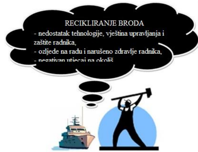
Slika 3. Problemi kod neodgovarajućeg recikliranja broda [16]