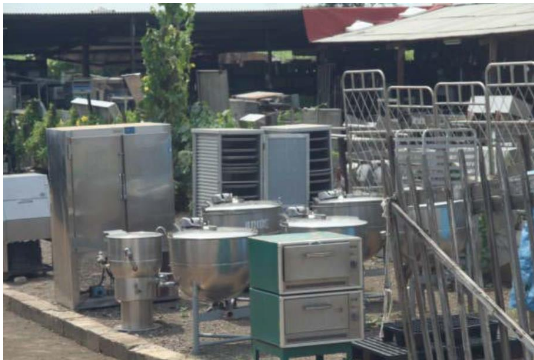
Slika 4. Dijelovi uklonjeni s broda prije konačnog rezanja konstrukcije [17]

preuzimaju određeno plovilo kako bi ga temeljito pretražili i uklonili korisne predmete koji mogu uključivati cjevovode, električne žice, elektroniku, namještaj i strojeve. Sve ove stavke ponovno se koriste ili prodaju na lokalnom tržištu.