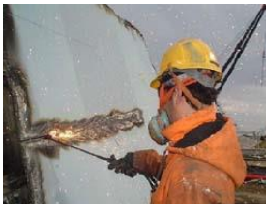
Slika 8. Opremljeni radnici u LEYAL reciklažnom brodogradilištu [24]

LEYAL posebnu pažnju pridaje sigurnosti radne snage i okoliša, poštivanju najstrožih nacionalnih i međunarodnih propisa i izdavanju certifikata ISO 9001, ISO 14001 i OHSAS 18001. Tvrtka također aktivno provodi implementaciju najnovijih tehnologija usmjerenih na smanjenje opasnosti za čovjeka i okoliš.