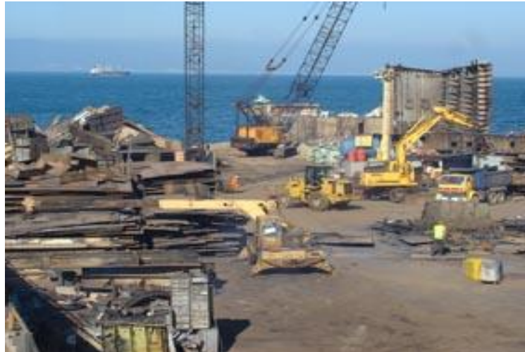
Slika 7. LEYAL područje za recikliranje [23]

prihvatljivo recikliranje brodova širom svijeta, posebice u nedostatku globalno primjenjivih zelenih standarda za recikliranje brodova. LEYAL-ova predanost svojim radnicima i okolišu je od velike važnosti, s izvrsnim zapisima za sigurnost radnika i zaštitu okoliša te poštivanje najstrožih nacionalnih i međunarodnih propisa. [26]