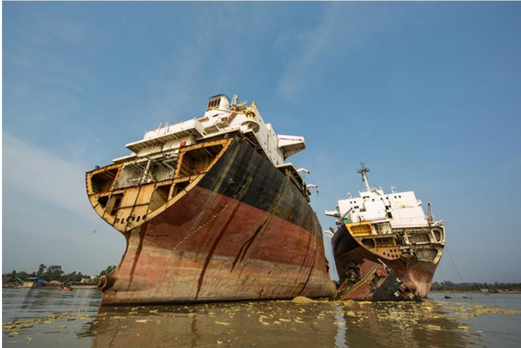
Slika 1. Recikliranje broda metodom plaža [22]

U 2015. godini 78% od ukupno reciklirane svjetske brodske tonaže rastavljeno je metodom plaže. Europski vlasnici činili su 1/3 od ovog postotka, na primjer. Njemački vlasnici rastavili su 74% i Grčki 87% svojih brodova metodom plaže. Kao pozitivan primjer može se istaknuti Norveški vlasnici, koji su za recikliranje svojih 13 od ukupno 17 brodova za recikliranje koristili moderna postrojenja. [14]