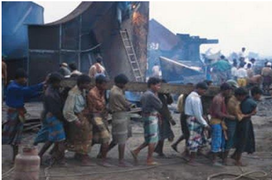
Slika 5. Neadekvatno opremljeni radnici u procesu recikliranja broda u Bangladešu [18]

Radnici koji rade u nerazvijenim zemljama su iznimno siromašni, te su svakoga dana podvrgnuti smrtnim opasnostima, a broj smrti u takvim uvjetima na brodu koji se rastavlja raste unatoč svim mjerama opreza.