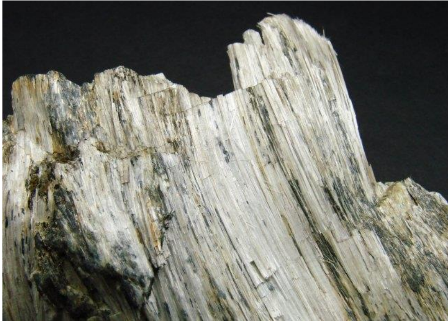
Slika 6. Mineral azbesta [20]

Postoji nekoliko vrsta azbesta: aktinolit, amozit, antofilit, krizotil, krokidolit i tremolit. Krokidolit i amozit dva su najopasnija oblika azbesta. Ukoliko dođe do udisanja njihovih vlakana, oni predstavljaju najveći rizik za ljudsko zdravlje. Krokidolit je izbačen iz upotrebe 1970-ih godina. Azbest se kao izolacijski materijal još uvijek može naći u nekim građevinama, ali se upotrebljavao i u oblogama kočnica te za brtvljenje cijevi i bojlera (npr. na brodovima). Još ga možda ima u nekim starijim građevinama, ali se uklanja pri njihovoj obnovi. Općenito je primjena azbesta u novije vrijeme svedena na najmanju mjeru jer su postala dostupna manje opasna zamjenska rješenja.