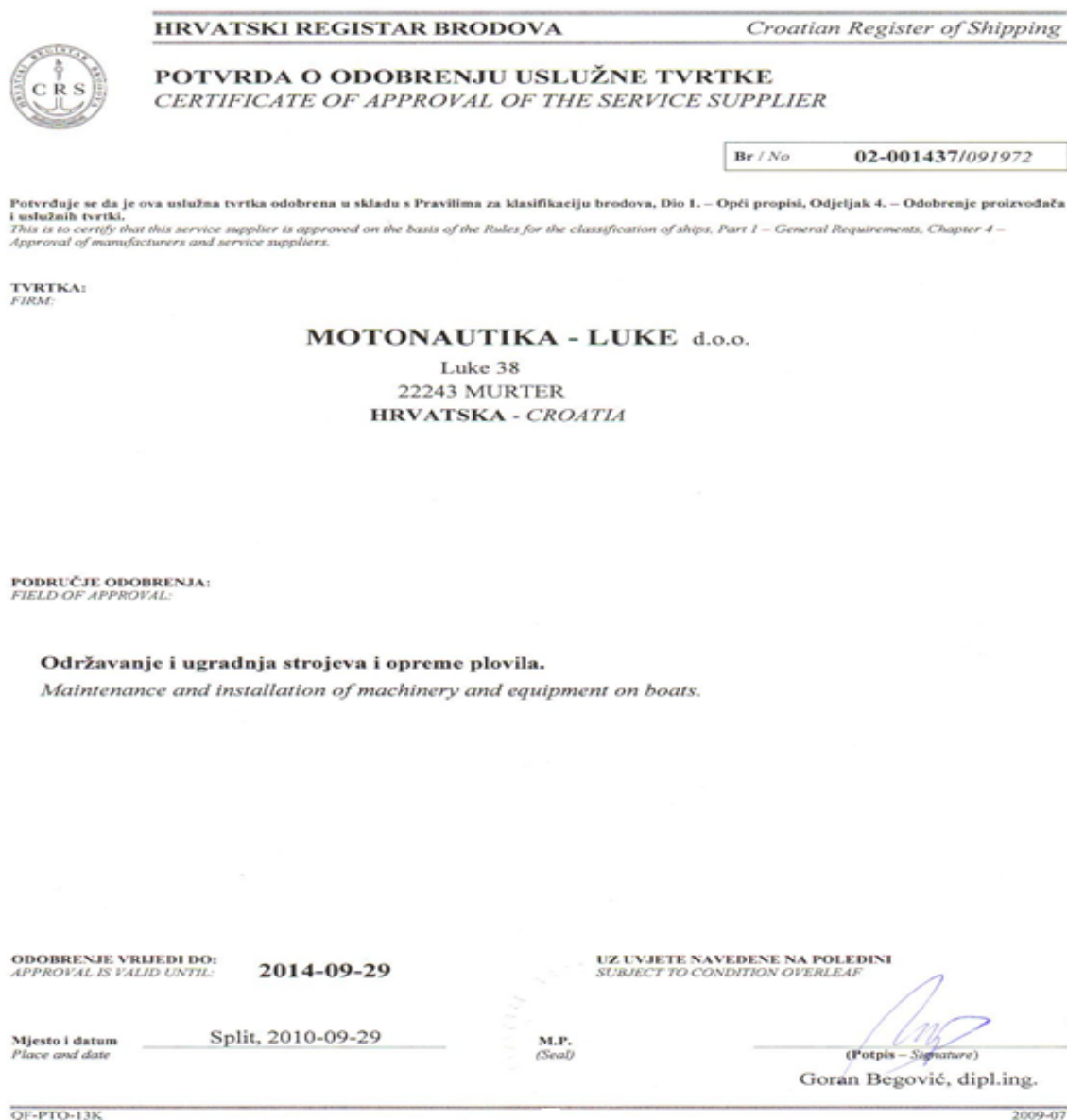
Slika 6. Potvrda o odobrenju uslužne tvrtke [8]

Valjanost potvrde o odobrenju uslužne tvrtke (vidi sliku 6.) je četiri godine, osim za uslužne tvrtke koje se bave mjerenjem debljine na brodovima kojima je valjanost potvrde odobrenja tri godine. Ukoliko dođe do bilo kakve izmjene u sustavu odobrene uslužne tvrtke mora se odmah obavijestiti klasifikacijsko društvo.