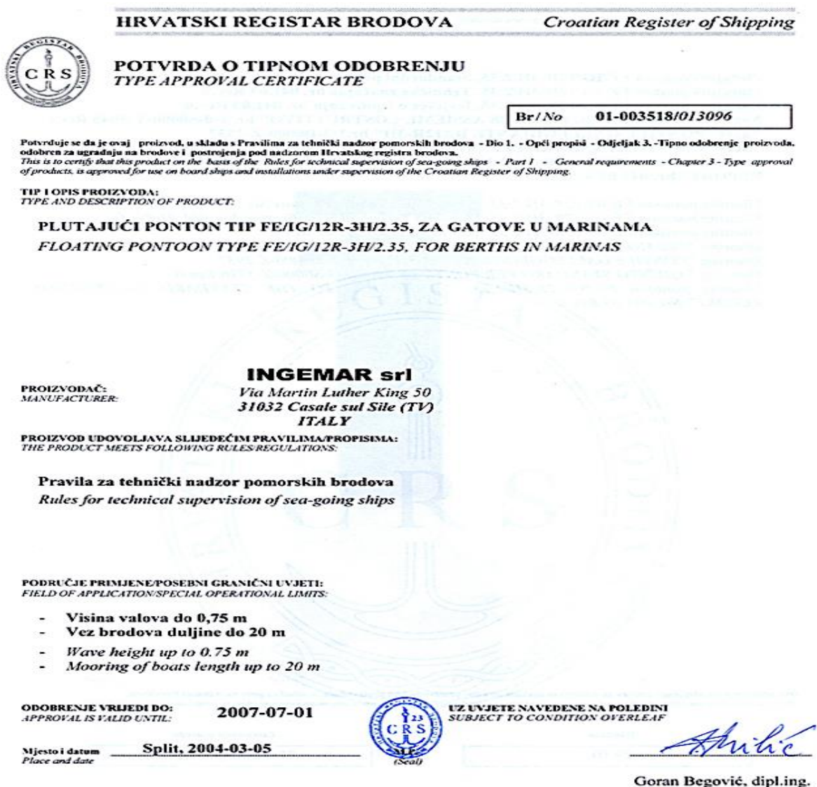
Slika 4. Potvrda o tipnom odobrenju proizvoda [6]

Nadzor nad izradbom i ispitivanjem svakog pojedinog proizvoda obavlja se u ovlaštenom laboratoriju ili iznimno i kod proizvođača, a obavlja ga klasifikacijsko društvo ili priznata organizacija ovlaštena od klasifikacijskog društva. Nakon odobrenja tehničke dokumentacije i nakon uspješnog obavljenog tipnog ispitivanja u skladu s posebno odobrenim programom tipnog ispitivanja proizvođaču se izdaje potvrda o tipnom odobrenju za proizvod koja se obilježava oznakom klasifikacijskog društva koje je obavljalo nadzor (vidi sliku 4.)