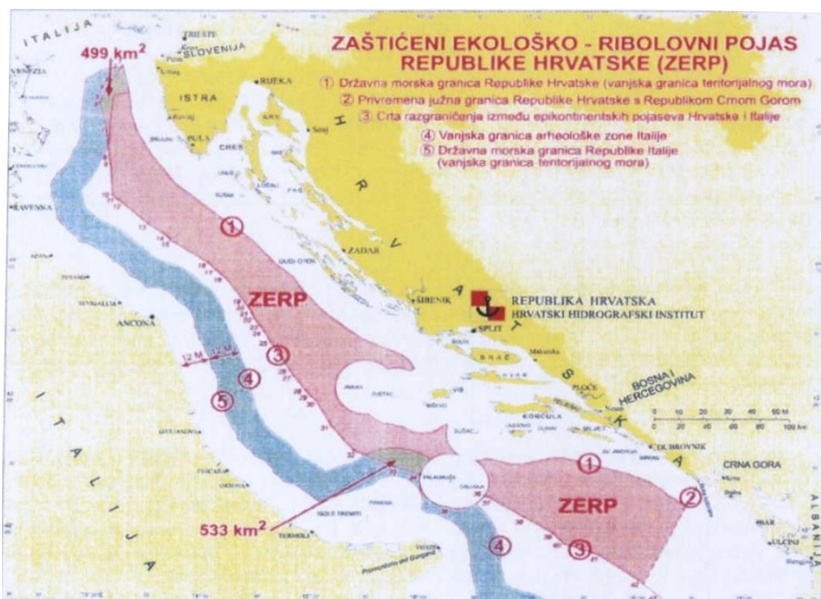
Slika 1: Zaštićeni ekološko-ribolovni pojas Republike Hrvatske

Prilikom plovidbe hrvatskim gospodarskim pojasom plovni su objekti dužni poštivati opće prihvaćene međunarodne propise i standarde te hrvatske propise o suzbijanju onečišćenja mora s brodova i onečišćenja prouzročenog potapanjem ili djelatnostima u podmorju. Zemljopisno gledano, granice gospodarskog pojasa Republike Hrvatske bile bi udaljene prosječno oko 70 km od obala naših vanjskih otoka, odnosno poklapale bi se s graničnom crtom epikontinentalnog pojasa na dnu Jadranskog mora između Republike Hrvatske i Republike Italije. Prilikom preleta gospodarskog pojasa Republike Hrvatske zrakoplovi su dužni poštivati općeprihvaćene međunarodne propise i hrvatske propise o suzbijanju onečišćenja mora iz zraka ili zrakom [6]. Zaštita i regulacija ribarenja u gospodarskom pojasu vjerojatno su najstarije i najtradicionalnije zadaće obalnih država. Rasprave primorskih država o ribarenju su mnogo češće nego o drugim pravima u gospodarskom pojasu. Zbog toga, većina država pri proglašenju pojasa postavlja visoko na listi prioriteta legalizaciju i zaštitu ribarenja.