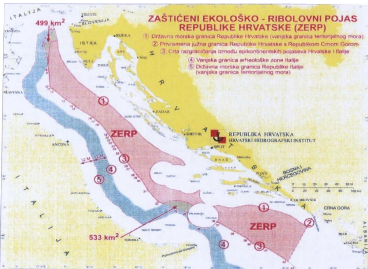
Slika 1: Zaštićeni ekološko-ribolovni pojas Republike Hrvatske

Prilikom plovidbe hrvatskim gospodarskim pojasom plovni su objekti dužni poštivati opće prihvaćene međunarodne propise i standarde te hrvatske propise o suzbijanju onečišćenja mora s brodova i onečišćenja prouzročenog potapanjem ili djelatnostima u podmorju. Zemljopisno gledano, granice gospodarskog pojasa Republike Hrvatske bile bi udaljene prosječno oko 70 km od obala naših vanjskih otoka, odnosno poklapale bi se s graničnom crtom epikontinentalnog pojasa na dnu Jadranskog mora između Republike Hrvatske i Republike Italije. Prilikom preleta gospodarskog pojasa Republike Hrvatske zrakoplovi su dužni poštivati općeprihvaćene međunarodne propise i hrvatske propise o suzbijanju onečišćenja mora iz zraka ili zrakom [6]. Zaštita i regulacija ribarenja u gospodarskom pojasu vjerojatno su najstarije i najtradicionalnije zadaće obalnih država. Rasprave primorskih država o ribarenju su mnogo češće nego o drugim pravima u gospodarskom pojasu. Zbog toga, većina država pri proglašenju pojasa postavlja visoko na listi prioriteta legalizaciju i zaštitu ribarenja.