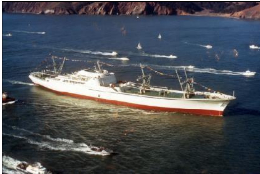
Slika 1. NS Savannah – revolucionarni brod na nuklearni pogon [21]

S ubrzanim razvojem tehnologije i tehnike gradili su se sve veći i moderniji brodovi, specijalizirani za prijevoz velikih količina pojedinih vrsta tereta, za prijevoz velikoga broja putnika, te za obavljanje drugih plovidbenih poslova. Također se razvija odobalna (off-shore) djelatnost, prvenstveno radi istraživanja i iskorištavanja podmorja (plovne platforme, objekti za polaganje cjevovoda i kabela na morskome dnu).