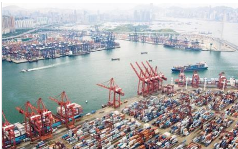
Slika 3. Najveća pomorska luka u Hrvatskoj nalazi se u Rijeci [23]

Hrvatska ima 333 morske luke, razvrstane u luke međunarodnoga gospodarskog značenja za Hrvatsku (Rijeka, Zadar, Šibenik, Split, Ploče i Dubrovnik), luke županijskoga značenja (42) i luke lokalnoga značenja (285).