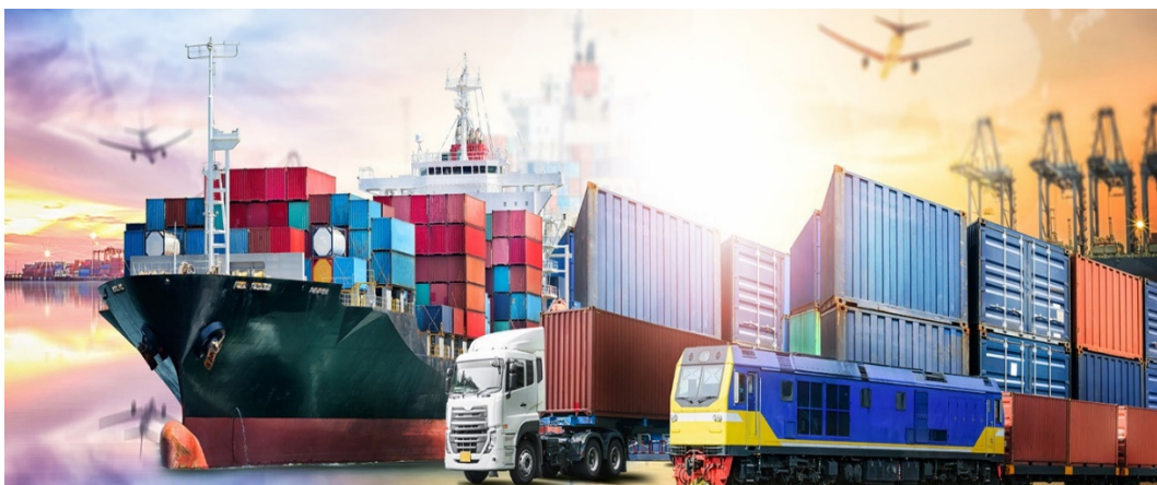
Slika 3. Multimodalni transport [17]

Suvremene globalne tendencije tržišno-robne razmjene, koje su u posljednje vrijeme znatno povećane, odražavaju se u primjeni suvremenih transportnih sustava, uključujući integralne, multimodalne i kombinirane sustave koji povezuju različita prijevozna sredstva (Slika 3.). Nove tehnologije transporta u cijelom transportnom lancu, od proizvođača do potrošača, postavljaju nužnost racionalizacije u cjelokupnom gospodarstvu i izravno utječu na konkurentne sposobnosti za integraciju nacionalnog gospodarstva u međunarodnu podjelu rada [4].