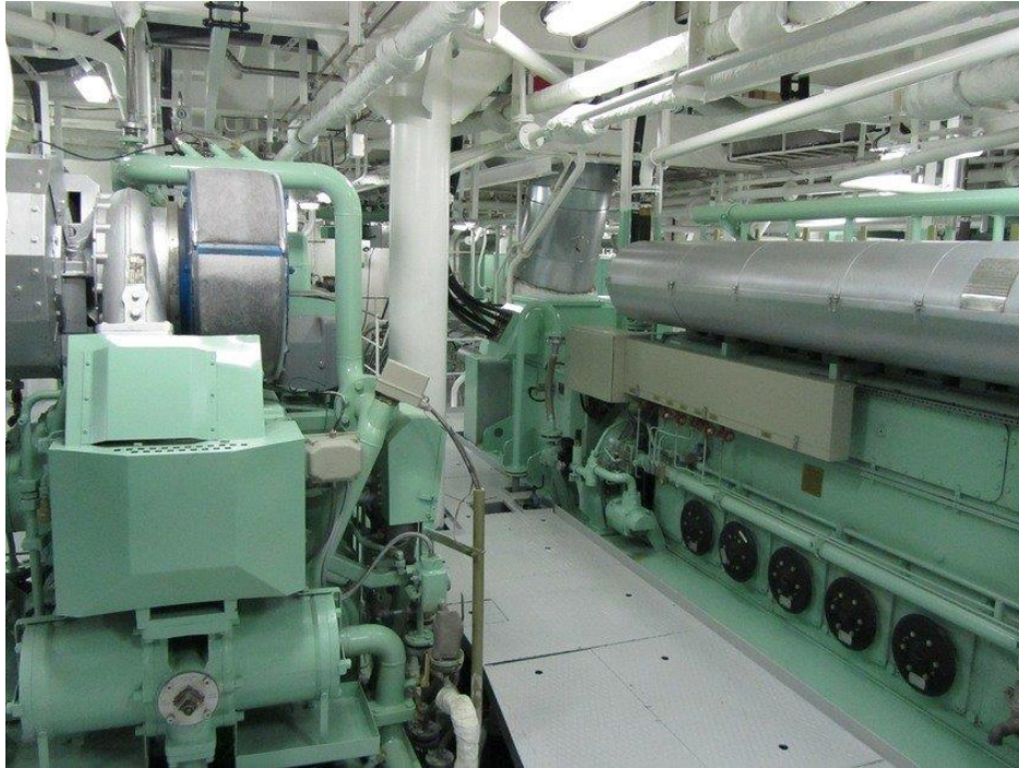
Slika 3. Strojarnica broda [11]

Toplinski udar se može očekivati u strojarnici broda ako nije klimatizirana, prilikom dugotrajnog rada na otvorenom pri velikim vrućinama kao i pri ostalom radu koji zahtijeva veliki fizički napor. Osobe na brodu koje se izlažu velikim vrućinama trebaju nositi odgovarajuću odjeću i reorganizirati sve naporne aktivnosti ukoliko je vruće i vlažno vrijeme.