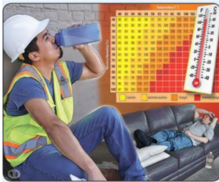
Slika 1. Toplotni udar [12]

Unesrećenoj osobi se mjeri tjelesna temperatura temeljem koje se određuju daljnji postupci. Ako je unesrećena osoba pri svijesti i ako ne povraća, potrebno je davati mu/joj hladne napitke. U suprotnom, ako je u nesvijesti, potrebno je okrenuti unesrećenu osobu u bočni položaj, a u najgorem slučaju, ako je došlo do prestanka disanja i rada srca, potrebno je započeti reanimaciju.