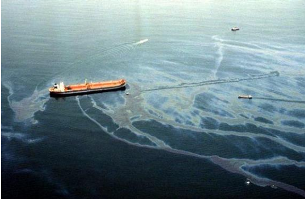
Slika 8. Exxon Valdez [26]