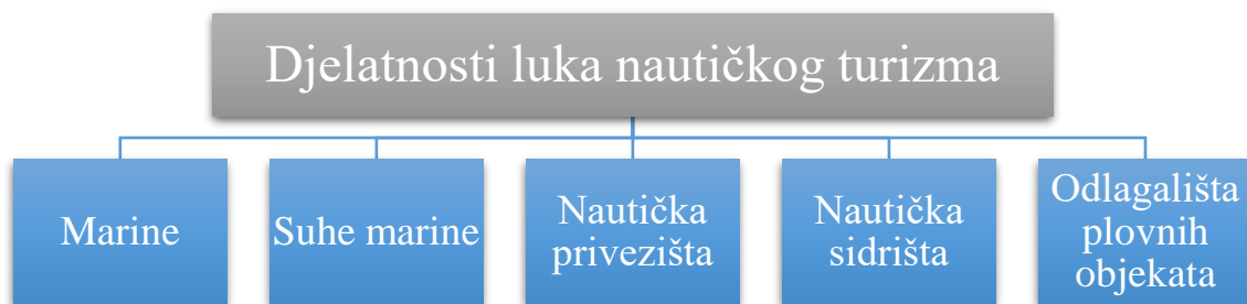
Slika 4: Djelatnosti luka nautičkog turizma [Izrada autora]

Prema zadnjim podacima sa Državnog zavoda za statistiku (DZS) za 2021. godinu, u Republici Hrvatskoj postoji 206 luka nautičkog turizma, a od toga je 85 marina (od toga 21 suha marina), 83 sidrišta, 15 privezišta i 23 odlagališta plovnih objekata [16].