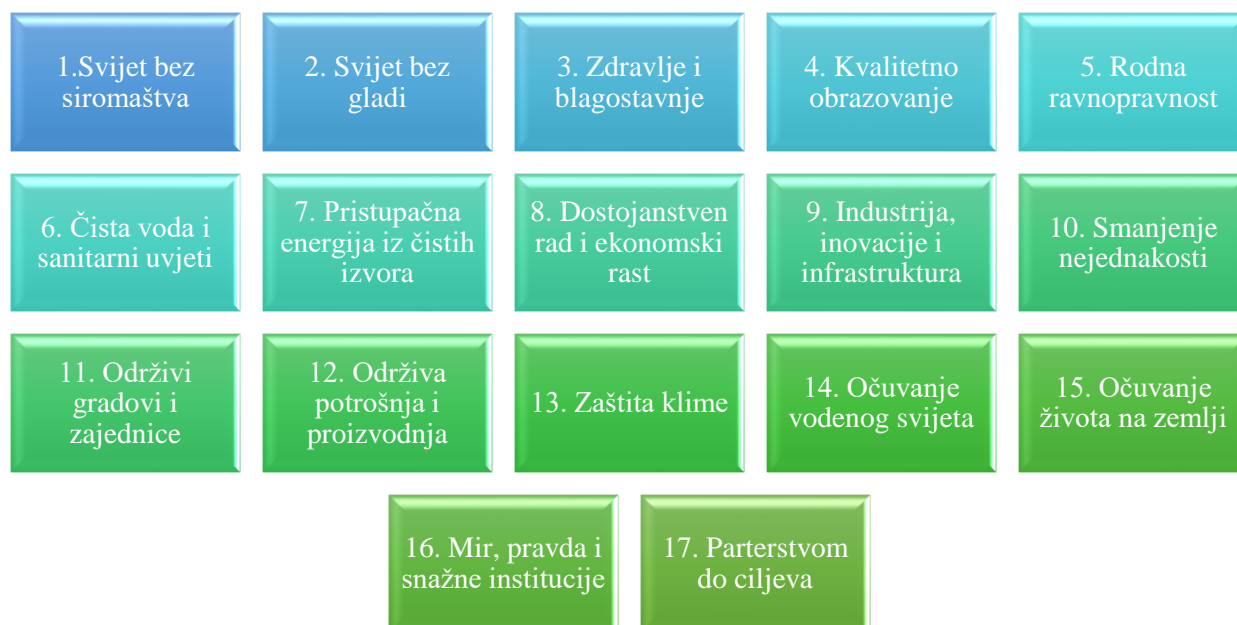
Slika 1: Ciljevi održivog razvoja (SDGs) [Izrada autora]

Kako je rečeno, postoji 17 ciljeva održivog razvoja, a isti su prikazani na slici 1. Također, unutar ovih 17 osnovnih globalnih ciljeva postoji i 169 pridruženih podciljeva u sklopu osnovnih 17, a u nastavku je ukratko opisano što predstavlja svaki od 17 ciljeva kako bi se naglasila važnost za osvještavanjem i trenutnim djelovanjem prema održivom razvoju.