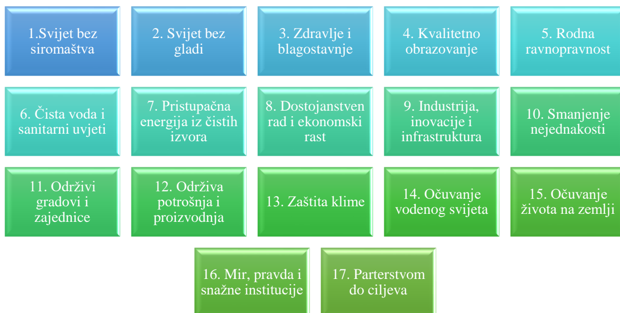
Slika 1: Ciljevi održivog razvoja (SDGs) [Izrada autora]

Kako je rečeno, postoji 17 ciljeva održivog razvoja, a isti su prikazani na slici 1. Također, unutar ovih 17 osnovnih globalnih ciljeva postoji i 169 pridruženih podciljeva u sklopu osnovnih 17, a u nastavku je ukratko opisano što predstavlja svaki od 17 ciljeva kako bi se naglasila važnost za osvještavanjem i trenutnim djelovanjem prema održivom razvoju.