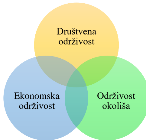
Slika 2: Tri stupa održivosti [Izrada autora]

aktivnosti koje ne iscrpljuju resurse o kojima ta sposobnost ovisi. Iz definicije održivosti može se zaključiti da sve dok ne dolazi do samouništenja, svaka se aktivnost može provoditi u opsegu i varijacijama, a pritom dopuštajući njeno dugotrajno ponavljanje i obavljanje.