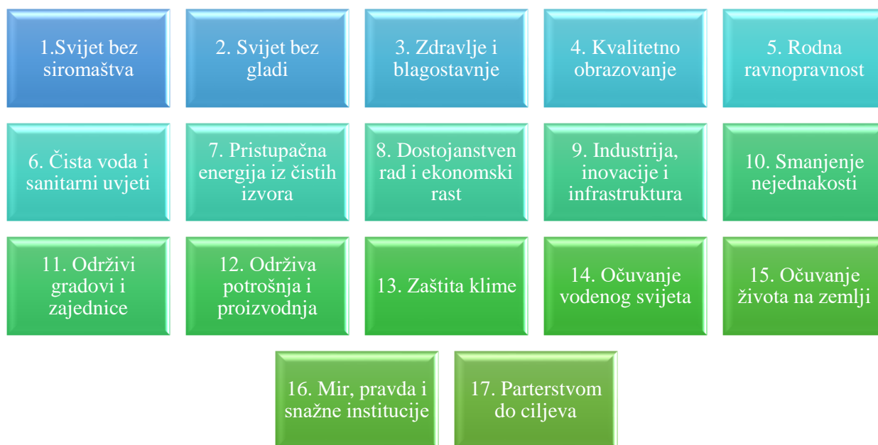
Slika 1: Ciljevi održivog razvoja (SDGs) [Izrada autora]

Kako je rečeno, postoji 17 ciljeva održivog razvoja, a isti su prikazani na slici 1. Također, unutar ovih 17 osnovnih globalnih ciljeva postoji i 169 pridruženih podciljeva u sklopu osnovnih 17, a u nastavku je ukratko opisano što predstavlja svaki od 17 ciljeva kako bi se naglasila važnost za osvještavanjem i trenutnim djelovanjem prema održivom razvoju.