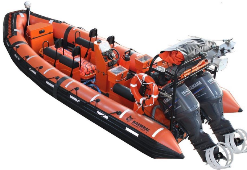
Slika 7 Brza spasilačka brodica

Spasilačke brodice imaju više namjena. Uz prijevoz ljudi iz opasnog područja, osnovna namjenja im je prikupljanje ljudi iz mora. Uz to, brodica mora biti sposobna tegliti splav za spašavanje nakrcanu do punog kapaciteta.