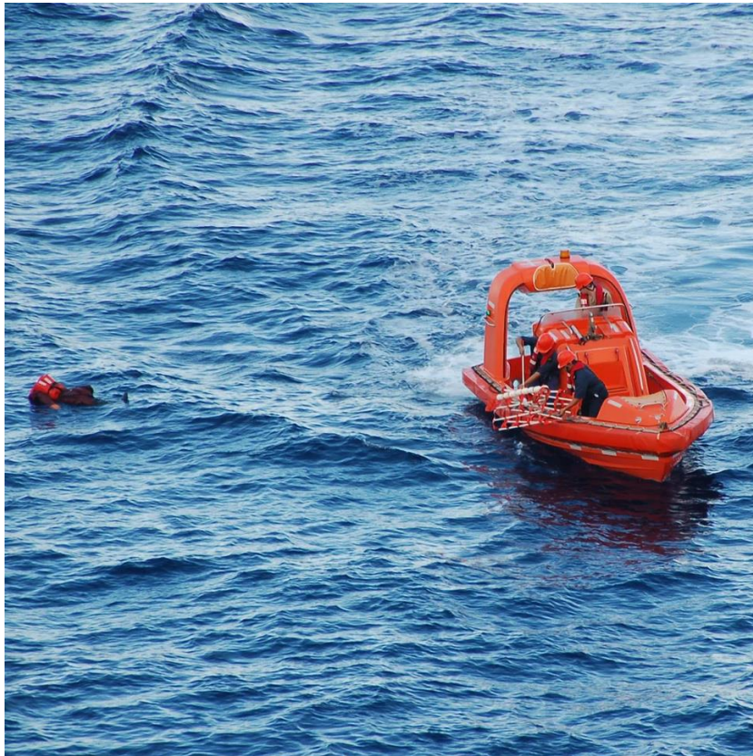
Slika 11 Prikupljanje osoba iz mora

posada brodice koja je zadužena za prikupljanje osoba iz mora treba djelovati brzo kako ne bi brodica prešla preko unesrećene osobe u moru.