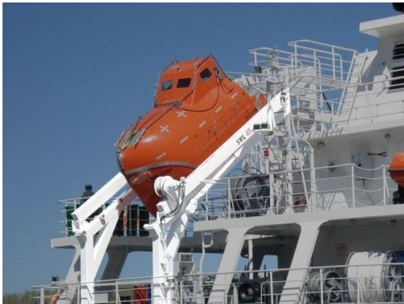
Slika 5 Soha za spuštanje brodice slobodnim padom

Pozicija takve sohe (Slika 5) je uglavnom na krmi broda gdje je brodica pod kutom pozicionirana u odnosu na vodenu liniju.