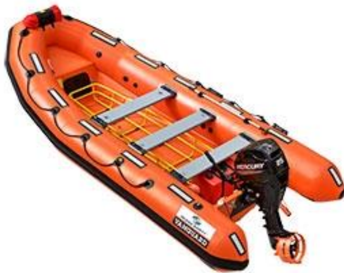
Slika 6 Spasilačka brodica

Motor im je vanjski, često benzinski, ali može biti i unutarnji dizelski motor. Sve su popularnije inačice s vodomlaznom propulzijom (engl. jet-drive ).