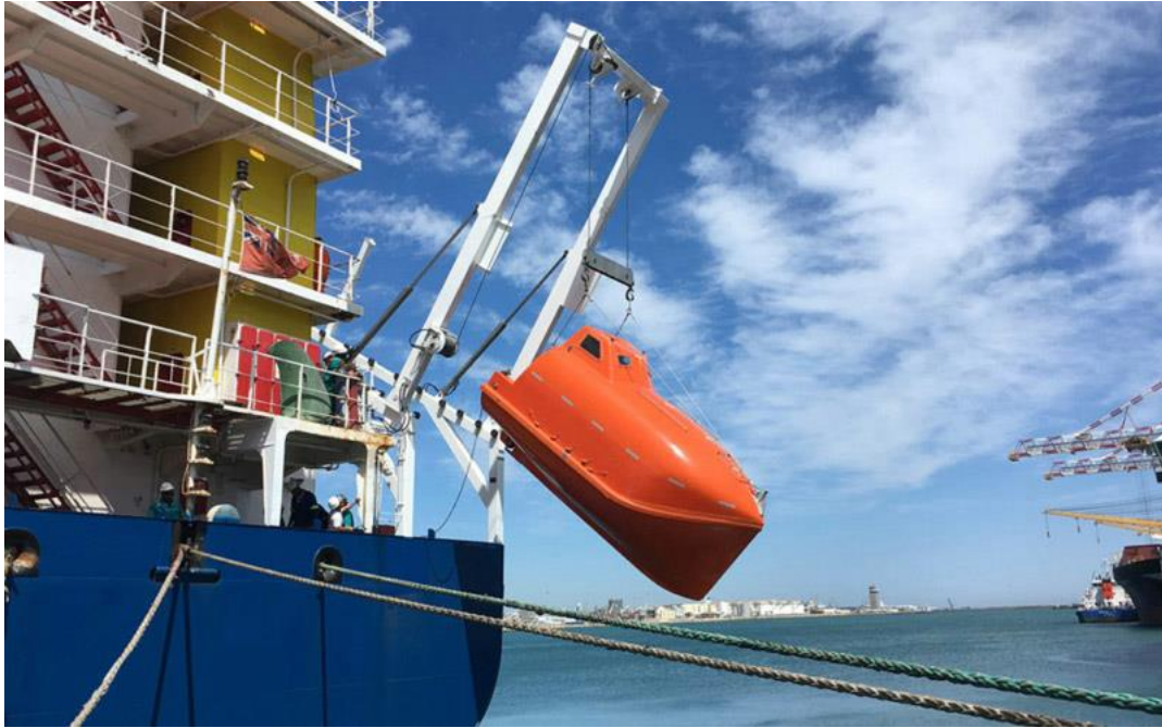
Slika 2 Brodica za spašavanje koja se spušta slobodnim padom