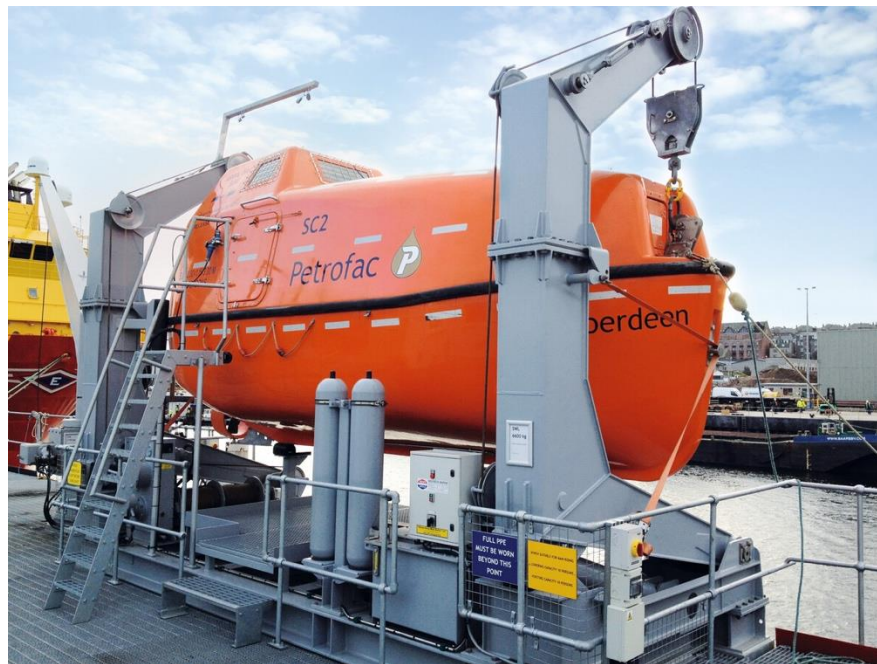
Slika 3 Nagibna gravitacijska soha

Nagibna gravitacijska soha (Slika 3) za inicijalno podizanje brodice iz početnog položaja koristi hidrauliku pokretanu vlastitim energetskeim sustavom. Nakon tog početnog pomaka, spuštanje brodice se odvija isključivo pomoću sile gravitacije koja djeluje na brodicu. Ukcavanje posade se odvija kada se brodice iz početnog položaja podigla hidraulikom do radnog položaja.