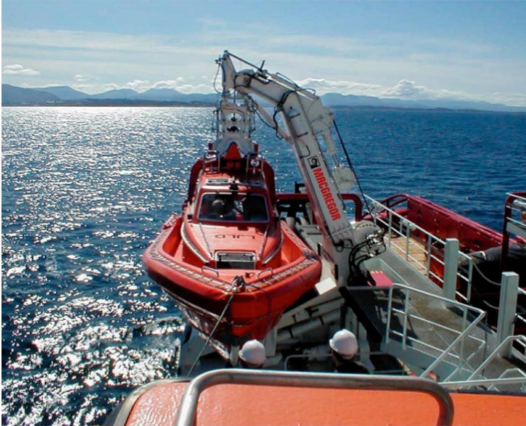
Slika 9 Tip G sohe s jednostrukim kranom

Također postoji i izvedba sohe s nagibnim mehanizmom koja se zove tip G (Sika 9). Radi na istom principu kao i tip A samo što ima jedan krak te cijela konstrukcija ima oblik slova "G".