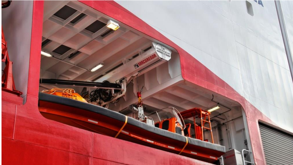
Slika 10 Tip T sohe s jednostrukim kranom

Najjednostavnije izvedbe uređaja za spuštanje i podizanje brodice su dizalice s okretnim mehanizmom. Sastoje se od mehanizma za spuštanje i podizanje brodice, kraka, okretnog mehanizma te stupa dizalice. Krak može biti fiksni ili teleskopski. Rade na vrlo jednostavnom principu tako da podignu brodicu iz svog ležaja te okretni mehanizam zakreće krak tako da je brodica iznad mora. One se koriste za manje spasilačke brodice ili za velike splavi za spašavanje. Također se mogu koristiti i za ostale terete i poslove na brodu. Mana je velika rotacija i ljučenje brodice i velik rizik od oštećenja. Iste su zbog toga zamijenjene sohamama. [12, 15, 17]