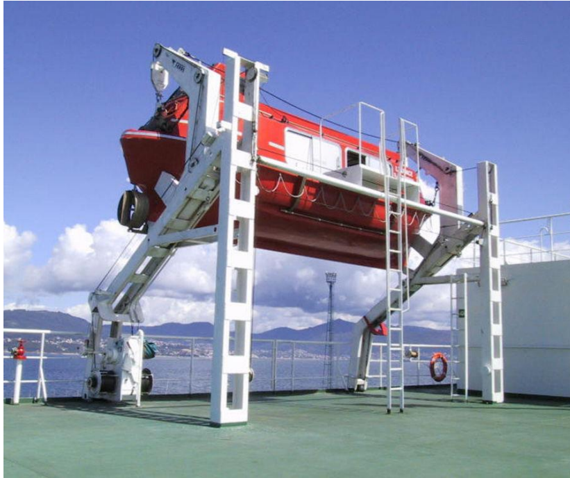
Slika 4 Klizna gravitacijska soha