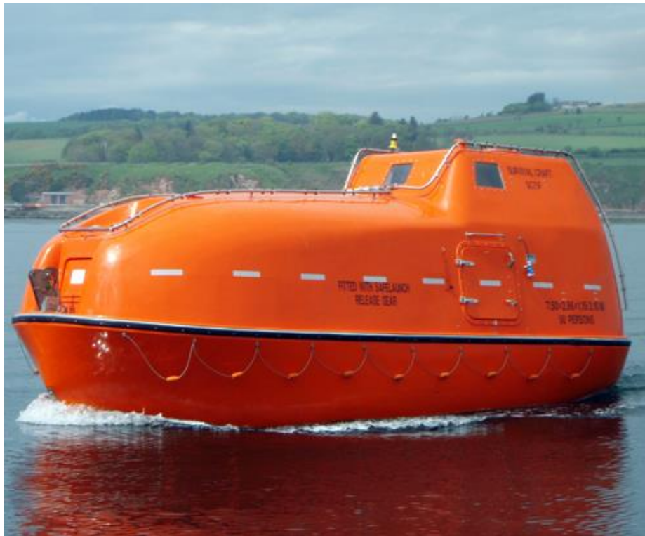
Slika 1 Potpuno zatvorena brodica za spašavanje

Spuštanje brodice u more se odvija uz pomoć gravitacijskih soha ili slobodnim padom.