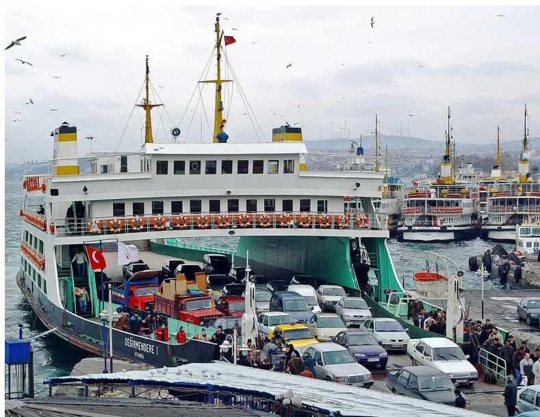
Slika 6. Primjer trajekta [14]

Oceanski brodovi - tradicionalni oblik putničkog broda. U prošlosti su takvi brodovi prometovali na redovitim linijama prema svim naseljenim dijelovima svijeta. Pojavom putničkih zrakoplova i specijaliziranih teretnih brodova za prijevoz tereta, linijska putovanja gotovo su zamrla, ali s njihovim padom došlo je do porasta putovanja morem radi užitka i zabave, a u drugom dijelu 20. stoljeća preoceanski brodovi ustupili su mjesto brodovima za krstarenje kao prevladavajućem obliku velikih putničkih brodova (Slika 7.) koji prevoze stotine do tisuće ljudi, s glavnim područjem aktivnosti koje se kreću od sjevernog Atlantskog oceana do Karipskog mora.