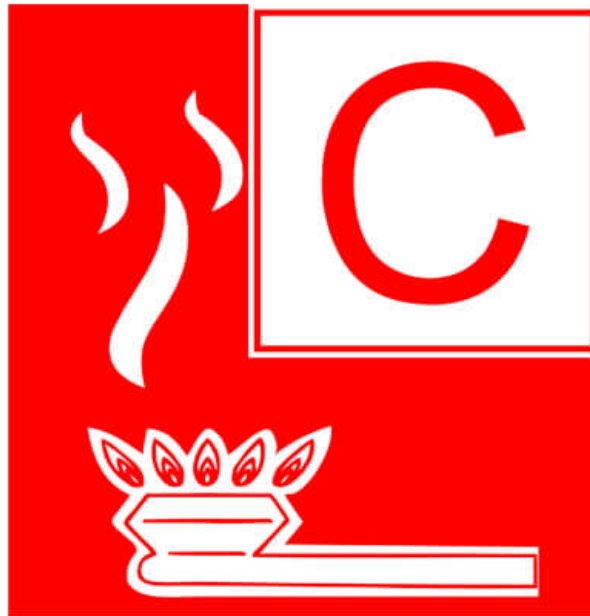
Slika 12. Naljepnica požara klase C

Požari klase D su rijetki, ali se mogu dogoditi kada se metal zapali (Slika 13.). Većina metala zahtijeva visoku razinu topline da bi se zapalila, zbog čega su požari klase D vrlo rijetki izvan laboratorijskih i industrijskih okruženja. Požare klase D često uzrokuju alkalni metali kao što su kalij, magnezij, aluminijski i natrij, jer se mogu zapaliti kada su izloženi zraku ili vodi. Udruga proizvođača opreme za požare savjetuje gašenje ove vrste požara samo aparatom sa suhim prahom. Aparati za gašenje suhim prahom djeluju na metalne požare odvajanjem goriva od kisika ili uklanjanjem toplinskog elementa plamena, ali aparati za gašenje pjenom ili vodom mogu potencijalno povećati snagu plamena i izazvati opasne eksplozije.[39]