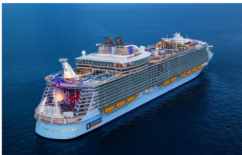
Slika 8. Brod za krstarenje [28]

Brodovi za krstarenje - dugo su vremena brodovi za krstarenje bili manji od starih preookeanskih brodova (Slika 8.), ali 1980-ih to se promijenilo kada je Knut Kloster, direktor Norwegian Caribbean Linesa, kupio jedan od najvećih preživjelih brodova „SS France“ i transformirao ga u ogroman brod za krstarenje, koji je preimenovao u „SS Norway“. Njegov uspjeh pokazao je da postoji tržište za velike brodove za krstarenje. Naručene su sukcesivne klase sve većih brodova, sve dok linijski brod „Cunard Queen Elizabeth“ konačno nije skinut s prijestolja svoje 56-godišnje vladavine kao najveći putnički brod ikada izgrađen.