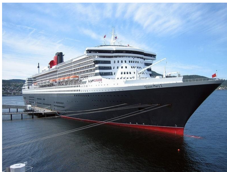
Slika 7. Najveći preoceanski brod [21]

Oceanski brodovi - tradicionalni oblik putničkog broda. U prošlosti su takvi brodovi prometovali na redovitim linijama prema svim naseljenim dijelovima svijeta. Pojavom putničkih zrakoplova i specijaliziranih teretnih brodova za prijevoz tereta, linijska putovanja gotovo su zamrla, ali s njihovim padom došlo je do porasta putovanja morem radi užitka i zabave, a u drugom dijelu 20. stoljeća preoceanski brodovi ustupili su mjesto brodovima za krstarenje kao prevladavajućem obliku velikih putničkih brodova (Slika 7.) koji prevoze stotine do tisuće ljudi, s glavnim područjem aktivnosti koje se kreću od sjevernog Atlantskog oceana do Karipskog mora.