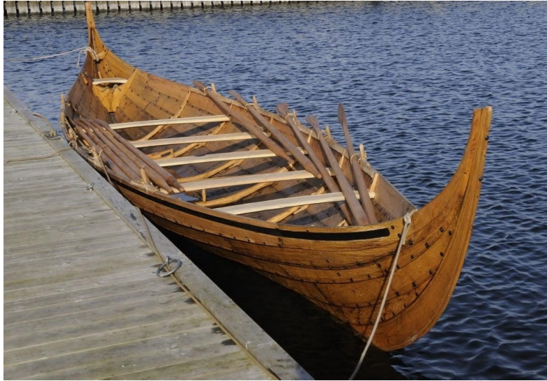
Slika 3. Gokstad brod [35]

Između 12. i 15. stoljeća, za vrijeme vladavine dinastije Song, razvijen je "Giunca Chinese" (džunka), čamac koji je Marko Polo koristio za svoja istraživanja (Slika 4.). Bio je to prvi put da je razvijen tako jak čamac s pregradom koji lako podnosi kineske tajfune, a bili su duži čak i od 135 metara.