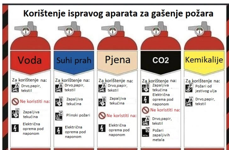
Slika 15. Vrste aparata za gašenje požara [13]

Kada je riječ o aparatima za gašenje požara, pogrešan odabir može pogoršati stvari. Dio osnovne obuke za pomorca će obuhvatiti koju vrstu aparata za gašenje požara koristiti u različitim situacijama. Postoji šest različitih tipova ručnih aparata za gašenje požara od kojih je svaki tip namijenjen za gašenje jedne ili više različitih vrsta požara i potpuno neprikladan za druge (Slika 15.): [6]