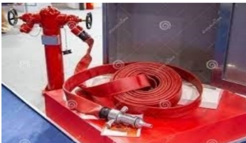
Slika 17. Priključak za vatrogasno crijevo

Također, svi brodovi moraju imati međunarodni priključak za vatrogasno crijevo (Slika 17.) tako da u slučaju kvara vlastitog protupožarnog sustava brod u luci može spojiti svoje cijevi i sustav crijeva na dovod vode s obale, a svaka točka na brodu mora biti pokrivena s minimalno dva vatrogasna crijeva. Konektor se također može koristiti za spajanje sustava na pumpe drugog plovila u luci ili na moru. [9]