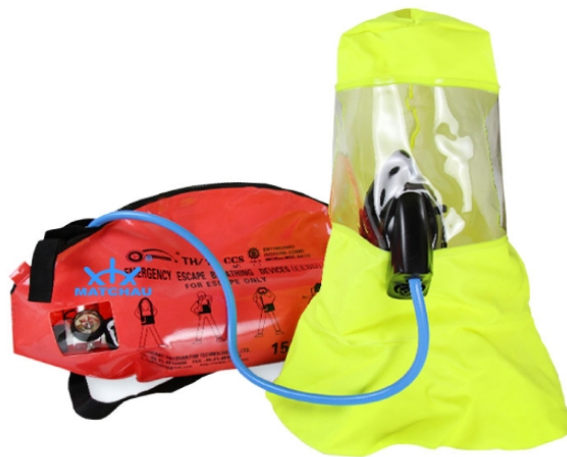
Slika 30. Uređaj za disanje u hitnim slučajevima