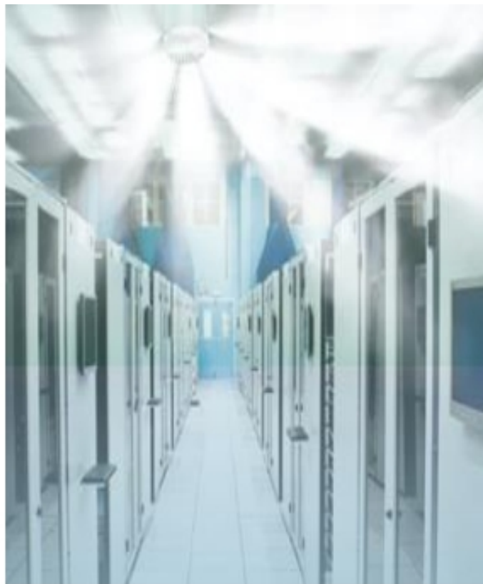
Slika 20. Ispuštanje plina „NOVEC 1230“ u računalnoj prostoriji