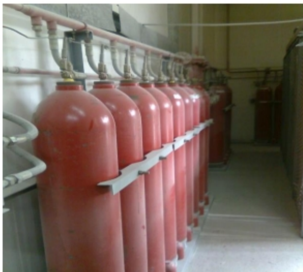
Slika 22. Baterije boca sa CO 2

Problemi s CO 2 sustavima pojavljuju se u mnogim službenim istragama nesreća, a savjete industriji redovito objavljuju osiguravatelji, P&I klubovi, klasna društva i druga tijela. Koncentracija CO 2 iznad određenih razina u protupožarnim akcijama glavna je briga među regulatorima zaštite od požara. [5]