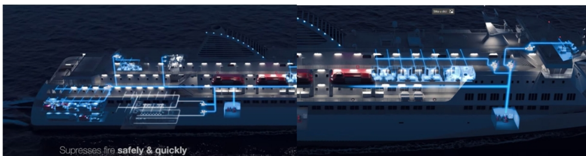
Slika 18. Vatrogasni sustav na putničkom brodu

Voda za sustave se dovodi kroz morskú komoru, ali postoji i spremnik slatke vode koji se u prvom redu koristi za punjenje sustava kako stajaća voda u cijevima ne bi bila korozivna. Sustavi raspršivača i vodene magle mogu se pokrenuti brže od plinskih sustava budući da nije potrebno zatvoriti otvore, isključiti ventilaciju ili evakuirati prostor prije puštanja. Vrijeme potrebno za gašenje požara vodenom maglom može biti dulje nego kod plina, ali vodena magla također hladi prostor i kontrolira dim u procesu. Obično je dostupna i neograničena opskrba vodom.