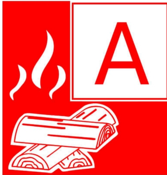
Slika 10. Naljepnica požara klase A

klase A može izazvati prevrnuti svijeća, zalutala iskra iz kamina ili munja koja udara u drvo. Međutim, požare klase A najlakše je ugasiti. Udruga proizvođača opreme za zaštitu od požara preporučuje korištenje aparata za gašenje vodom ili pjenom za požare klase A, a kod gašenja požara može se koristiti i voda jer može prekinuti dovod vatre. [39]