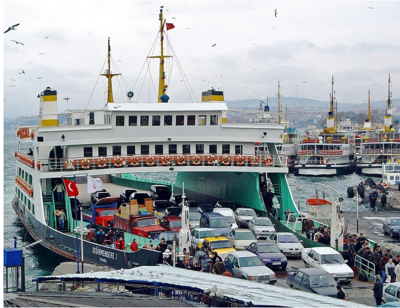
Slika 6. Primjer trajekta [14]

Oceanski brodovi - tradicionalni oblik putničkog broda. U prošlosti su takvi brodovi prometovali na redovitim linijama prema svim naseljenim dijelovima svijeta. Pojavom putničkih zrakoplova i specijaliziranih teretnih brodova za prijevoz tereta, linijska putovanja gotovo su zamrla, ali s njihovim padom došlo je do porasta putovanja morem radi užitka i zabave, a u drugom dijelu 20. stoljeća preoceanski brodovi ustupili su mjesto brodovima za krstarenje kao prevladavajućem obliku velikih putničkih brodova (Slika 7.) koji prevoze stotine do tisuće ljudi, s glavnim područjem aktivnosti koje se kreću od sjevernog Atlantskog oceana do Karipskog mora.