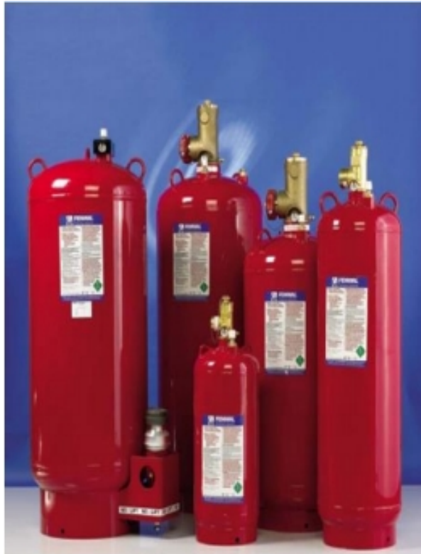
Slika 19. Izgled spremnika plina „NOVEC 1230“