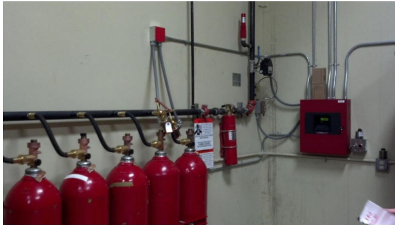
Slika 28. Sustav za gašenje požara sa inertnim plinom