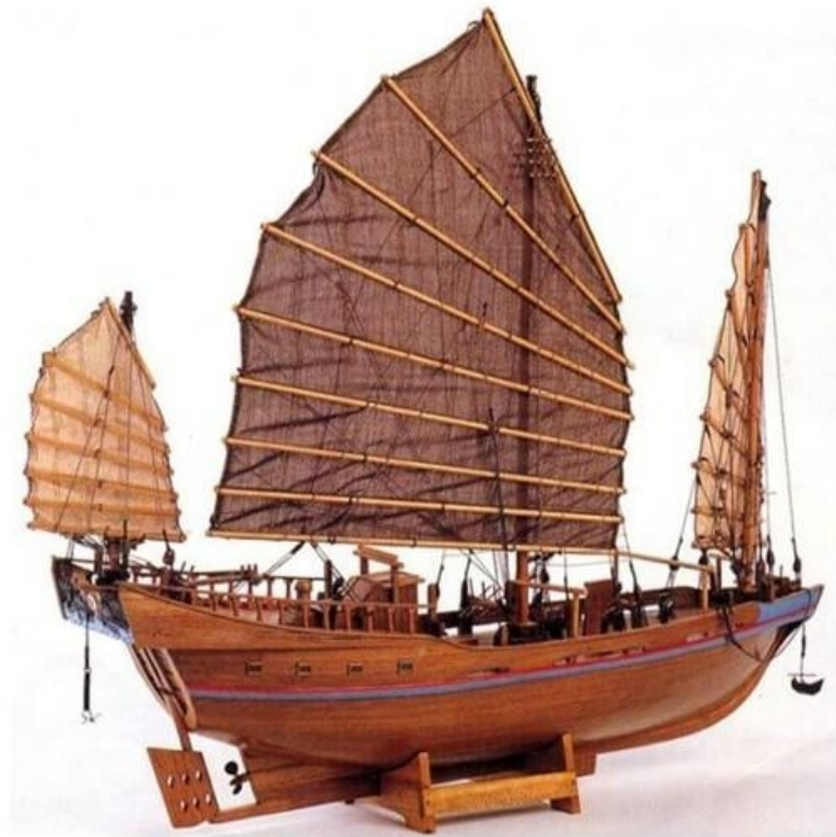
Slika 4. Giunca Chinese čamac [20]

Između 12. i 15. stoljeća, za vrijeme vladavine dinastije Song, razvijen je "Giunca Chinese" (džunka), čamac koji je Marko Polo koristio za svoja istraživanja (Slika 4.). Bio je to prvi put da je razvijen tako jak čamac s pregradom koji lako podnosi kineske tajfune, a bili su duži čak i od 135 metara.