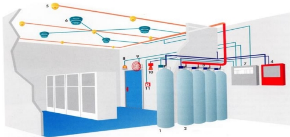
Slika 23. Shema visokotlačnog sustava za gašenje požara ugljičnim dioksidom

U nastavku je prikazana shema izvedenog sustava za gašenje požara ugljičnim dioksidom (Slika 23.) u kojem su dijelovi označeni brojevima na sljedeći način: 1 – pilot boca sa ugljičnim dioksidom; 2 – boce sa ugljičnim dioksidom; 3 – cjevovod; 4 – uređaj za vremensku odgodu ispuštanja ugljičnog dioksida; 5 – mlaznice za disperziju ugljičnog dioksida; 6 – detektori (javljači) požara; 7 – vatrodojavna centrala; 8 – svjetlosna signalizacija požara; 9 – zvučna signalizacija požara; 10 – sirena za upozoravanje ljudi zbog gašenja požara sa CO 2 ; 11 – uređaj za ručno aktiviranje gašenja.