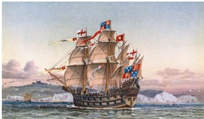
Slika 5. Karaka – jedrenjak [24]

U 15. stoljeću španjolska karaka bio je najveći europski jedrenjak koji je u 16. stoljeću postao standardno plovilo atlantske trgovine, a s kojim je kasnije bilo poteškoća u plovidbi zbog neobično visokih jedara na pramcu i krmi (Slika 5.).