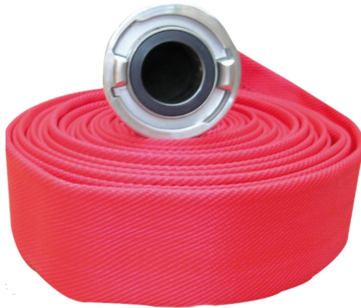
Slika 16. Crijevo za gašenje požara [26]

Za razliku od gašenja požara na obali gdje količina vode koja se koristi nije problem, na moru je višak vode vrlo opasan i uzrokuje prevrtanje broda. Voda također može reagirati s nekim teretom ispuštajući opasne plinove ili čak uzrokujući daljnje požare i eksplozije.