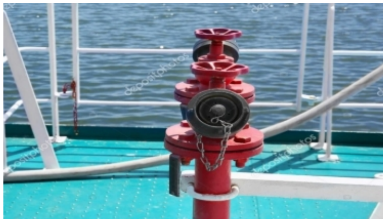
Slika 27. Vatrogasni hidranti