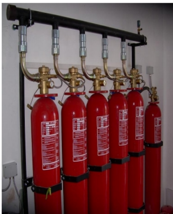
Slika 21. Izgled spremnika plina u prostoriji

Plin „Novec 1230“ skladišti se u tekućem stanju u spremnicima pod tlakom dušika od 50bar na temperaturi od 21°C. Kako bi se zajamčila učinkovitost u gašenju požara, potrebno je instalacije projektirati precizno, tako da trajanje sredstva za gašenje bude dugo 10 sekundi. Vrlo je važno istaknuti da cjevovod i ispusti mogu biti međusobno udaljeni do 80 m od spremnika s plinom, što je prednost Noveca 1230 u odnosu na druge plinove (Slika 21.).[18]