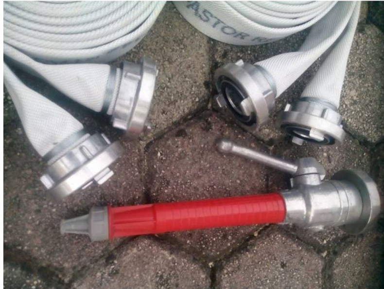
Slika 26. Vatrogasna crijeva i mlaznice