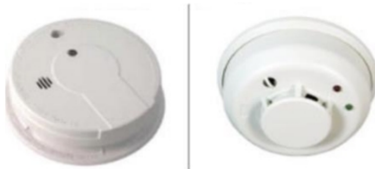
Slika 29. Detektor požara s alarmom