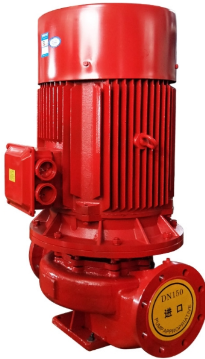
Slika 25. Protupožarna pumpa