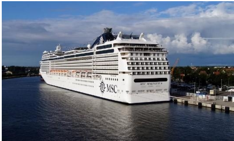
Slika 1. Moderni putnički brod [23]

Pojam modernih putničkih brodova je element koji pokriva mnoge aspekte, ali u višem ili manjem općem obliku putnički brodovi su trgovački brodovi koji se općenito koriste za prijevoz putnika (Slika 1.). Dakle, radi se o trgovačkim brodovima koji prevoze putnike na domaćim ili međunarodnim putovanjima, a koji mogu biti mali poput jahti i veliki poput ogromnih brodova za krstarenje. [29]