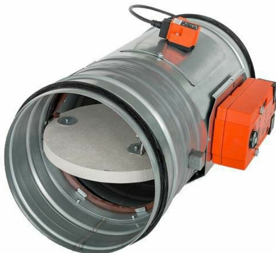
Slika 24. Protupožarna zaklopka