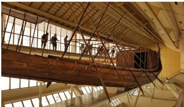
Slika 2. Khufuov brod [33]

Egipćani su postali vješti u izradi jedrilica. Khufuov brod koji je izgrađen 2500. pr. Kr. bio je dugačak 44 m, a otkriven je tijekom iskapanja 1954. godine u piramidi u Gizi, te je postao zaštitni znak njihovih vještina (Slika 2.). Kasnije, Grci, Feničani i Rimljani također su dali svoj udio u razvoju modernih brodova.