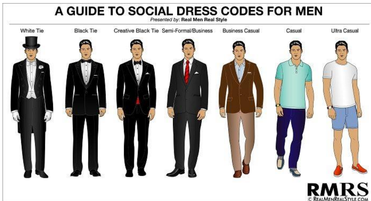
Slika 2. Stilovi odijevanja za muškarce