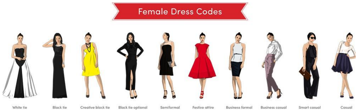
Slika 3. Stilovi odijevanja za žene