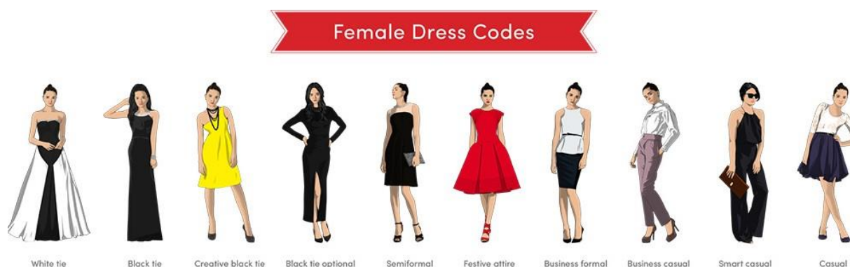
Slika 3. Stilovi odijevanja za žene