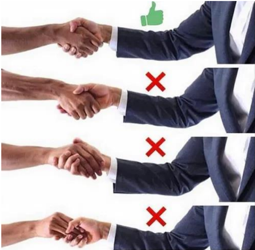
Slika 1. Primjer pravilnog rukovanja