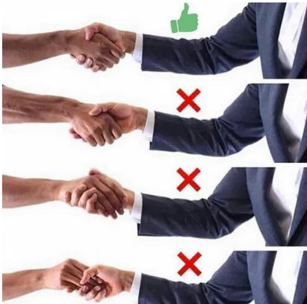
Slika 1. Primjer pravilnog rukovanja