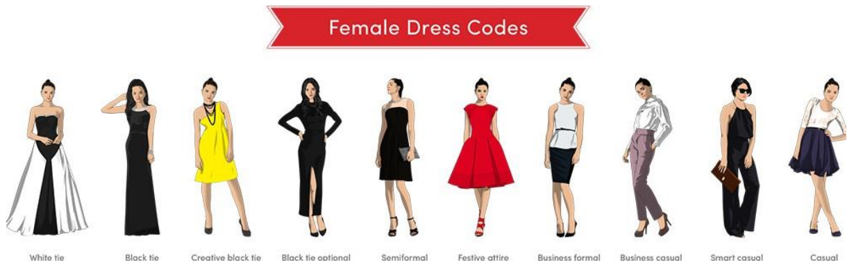
Slika 3. Stilovi odijevanja za žene