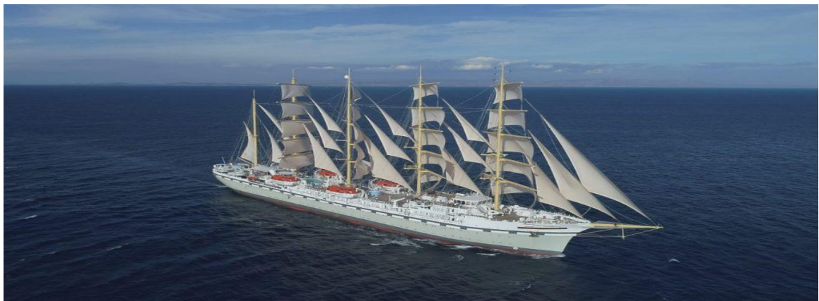
Slika 7. Jedrenjak Flying Clipper [27]

Brodosplitu izgrađen je ROPAX brod Piana, tj. brod koji prevozi putnike i vozila. Dug je 180 m, a može primiti 750 putnika i 430 vozila. Brodograditelji istog brodogradilišta 2017. stvorili su moderni, a vjerojatno i najbrži jedrenjak na svijetu. Njegovo ime je Flying Clipper. Dug je 162 i širok 18,5 metara, nosivosti 2000 tona, ima pet paluba, a na njemu će biti smješteno 450 osoba, od čega 300 putnika u 150 luksuznih kabina, te u 74 kabine 150 članova posade. Luksuzno je uređen, ali sa štihom i atmosferom koja podsjeća na stare jedrenjake. [27] Uz ovo treba navesti da je 2010-ih tamo izgrađen još niz manjih brodova za krstarenje te plovila za izletničke svrhe, pretežito za domaće naručitelje. U pulskom brodogradilištu Tehnomont 2012. izgrađen je katamaran Millennium Diamond za izlete Temzom u Londonu. U Uljaniku je 2015. u promet stavljen trajekt dug 155,8 m. Isto tako, dva jedrenjaka duga 88 m i još dva manja broda izgrađena su 2015. u trogirskom brodogradilištu. Tako je u posljednjih sedamdesetak godina u hrvatskim brodogradilištima izgrađeno stotinjak putničkih brodova. Na slici 7. nalazi se jedrenjak Flying Clipper. [33]