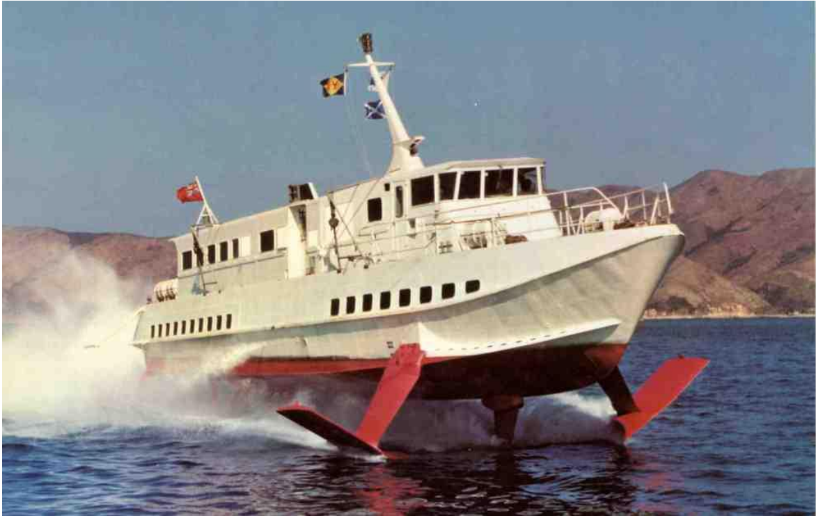
Slika 6. Hidrogliser [20]