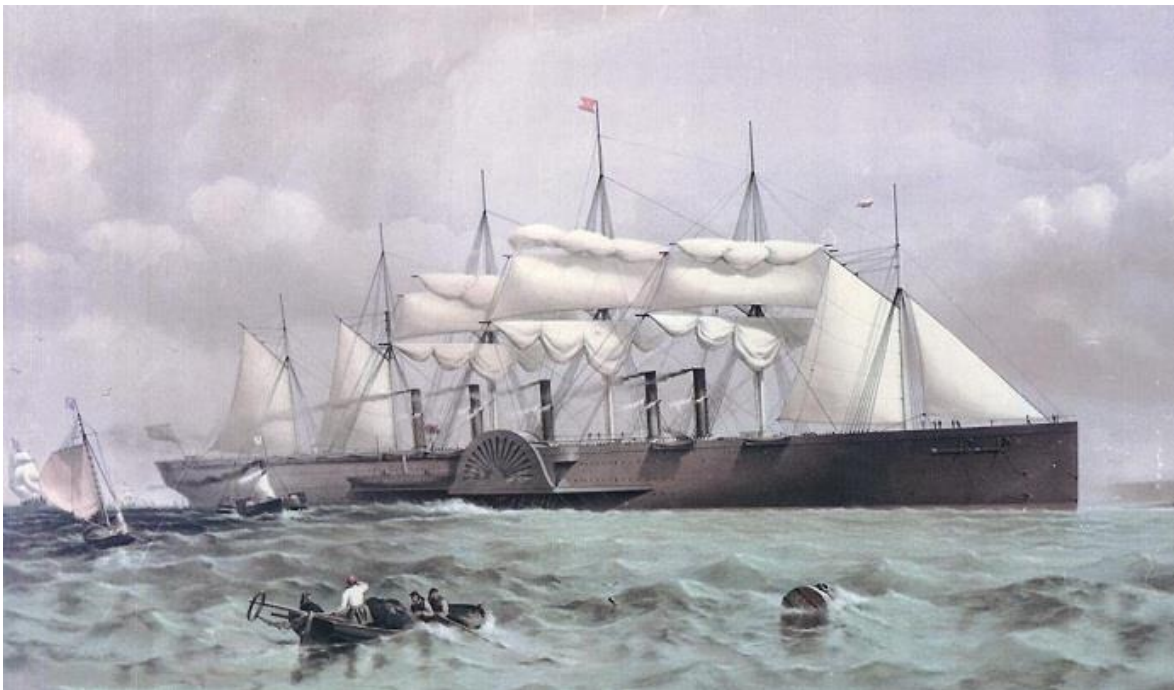
Slika 2. Parobrod „Great Eastern“ – div iz vremena Julesa Vernea [39]

krize koja se očitovala u cijelom svijetu, dolazi doba renesanse putničkih brodova. Grade se brodovi modernog dizajna i raskošnih interijera. Francuski preookeanski brod Normandie, zajedno s britanskim brodovima Queen Mary i Queen Elizabeth, jedan je od tri najveća i najznačajnija broda iz tog "zlatnog doba" velikih preookeanskih brodova. Budući da koncem 1950-ih, poglavito 1960-ih, započinje sve rapidniji uzlet zračnog putničkog prometa, posljedično, opada broj putnika na preookeanskim brodovima, a dodatnim uključivanjem u promet sve većih i ekonomičnijih zrakoplova ta pojava postaje sve osjetnija. Krajem 1970-ih, gotovo svi veliki preookeanski brodovi povlače se iz službe ili dolazi do njihove prenamjene u brodove za kružna putovanja. Tako već nagovještaj idućeg desetljeća donosi brodove prilagođene isključivo kružnim putovanjima, ali dimenzijama i tonažom prilično umanjenom u odnosu na transatlantike izgrađene nakon Velike depresije. Na izmaku 20. stoljeća javlja se procvat u industriji kružnih putovanja, potaknut izgradnjom sve većih brodova. Nastavak tog procesa vidljiv je sve do gradnje najnovijih današnjih megabrodova za krstarenje klase Oasis. [3][26]