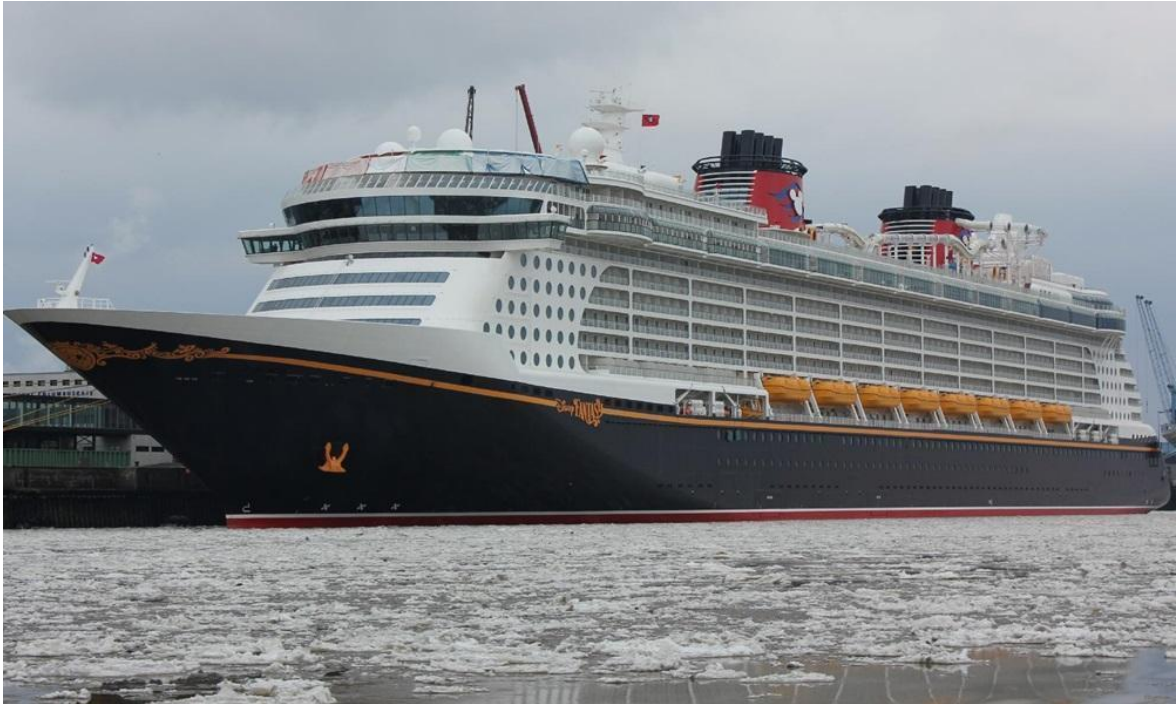
Slika 4. Disney Fantasy, brod za krstarenje u vlasništvu The Walt Disney Company [11]