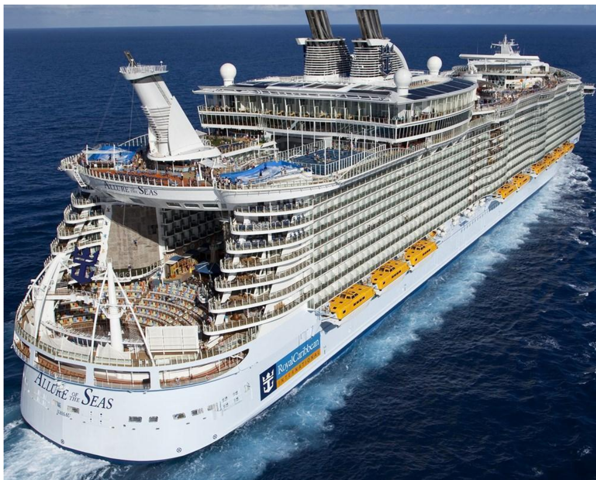
Slika 9. Allure of the Seas [5]

U vidu tehničkih značajki, treba izdvojiti duljinu preko svega od 361,6 m (iako se navodi da je 50 milimetara dulji od broda Oasis of the Seas, prema brodogradilištu, to nije namjerno i takve male razlike u duljini mogu se pojaviti jednostavno zbog temperature čelika u brodu). Širina, visina, gaz, istisnina, kapacitet putnika i broj posade identični su kao i kod prvog broda ove klase, a i pogonski strojevi također se ne razlikuju. Allure of the Seas raspolaže otvorenim šetalištem s barovima, restoranima, trgovinama. Tu je i amfiteatar s bazenom, gdje je niz spektakularnih događaja i akrobacija. Sportski kutak čine košarkaški teren i bazeni, od kojih dva imaju umjetničke valove za surfanje. Zona mladih obuhvaća najveći park za djecu na brodu s igraonicama, čak ima i dječje kazalište. Vrhunske wellness i fitness usluge također su gostima na raspolaganju. Ovaj brod prikazan je na slici 9. [6][28]