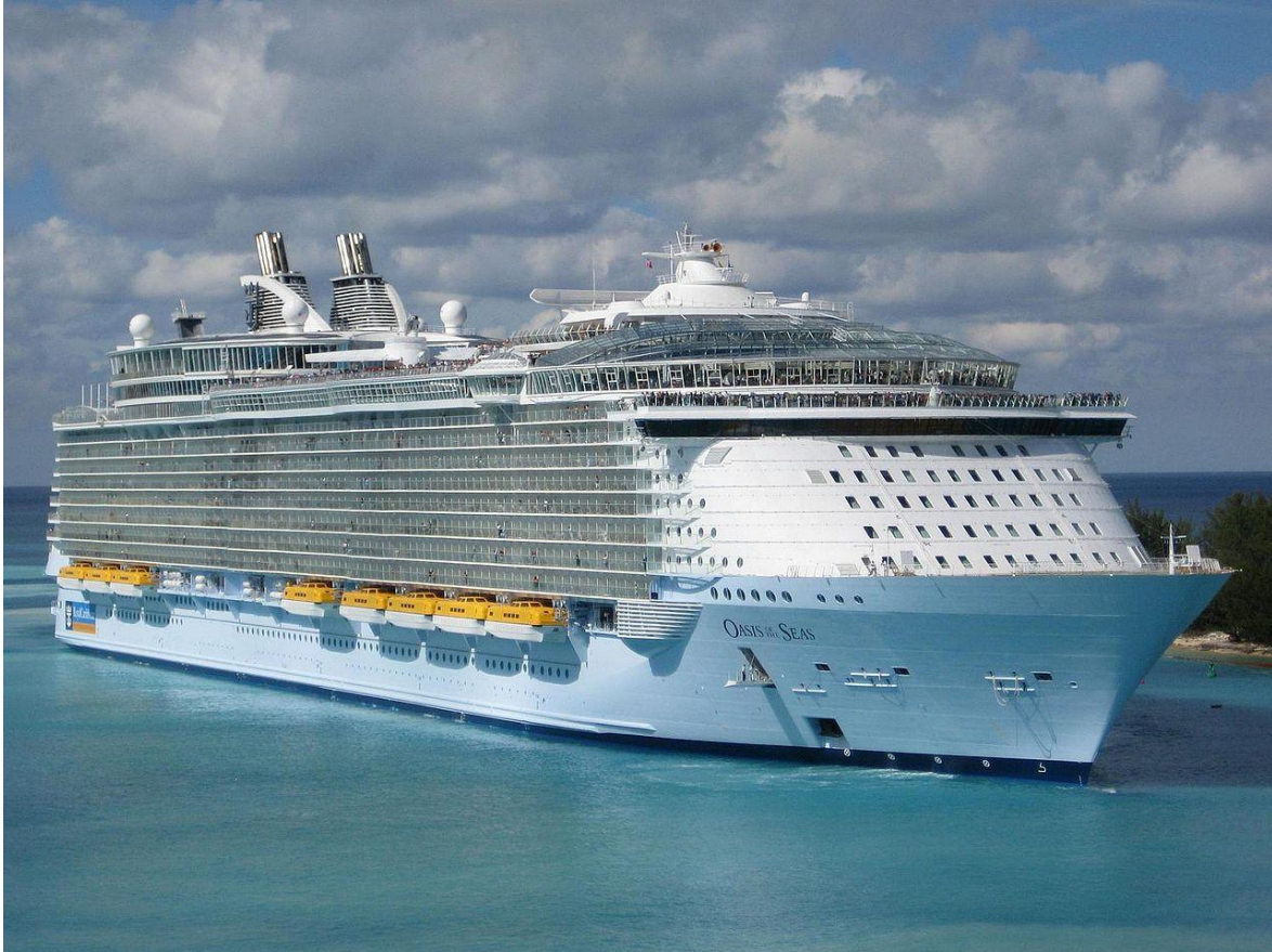
Slika 8. Oasis of the Seas [24]

više noćnih klubova, nekoliko barova i salona, karaoke klub, pet bazena, igrališta za odbojku i košarku, zone za mlade i jaslice za djecu. Na slici 8. prikazan je ovaj putnički gigant. [14][24][35]