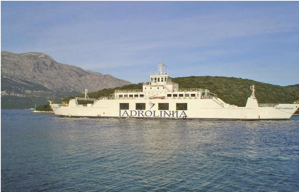
Slika 5. Trajekt Sveti Krševan [25]

plovi na vrlo frekventnoj relaciji između grada Korčule i mjesta Orebić na poluotoku Pelješcu. [26]