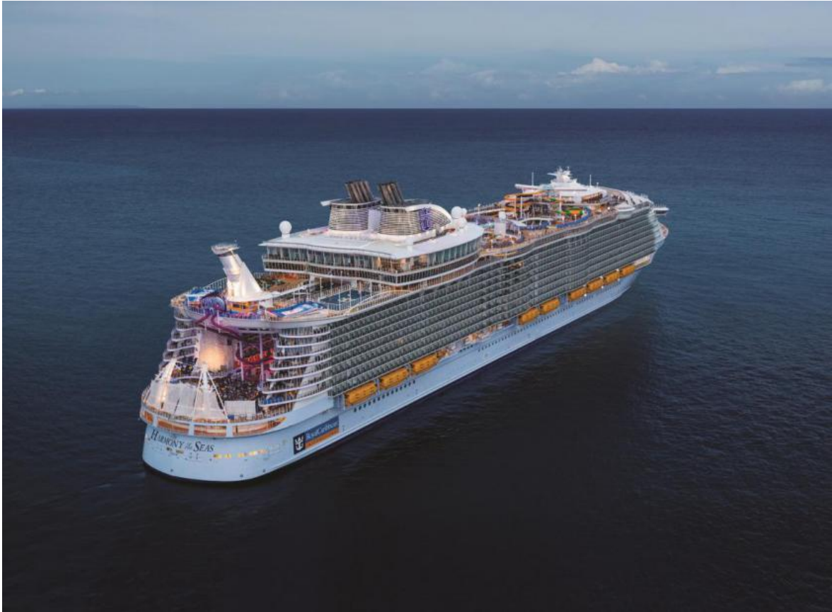
Slika 10. Harmony of the Seas [19]