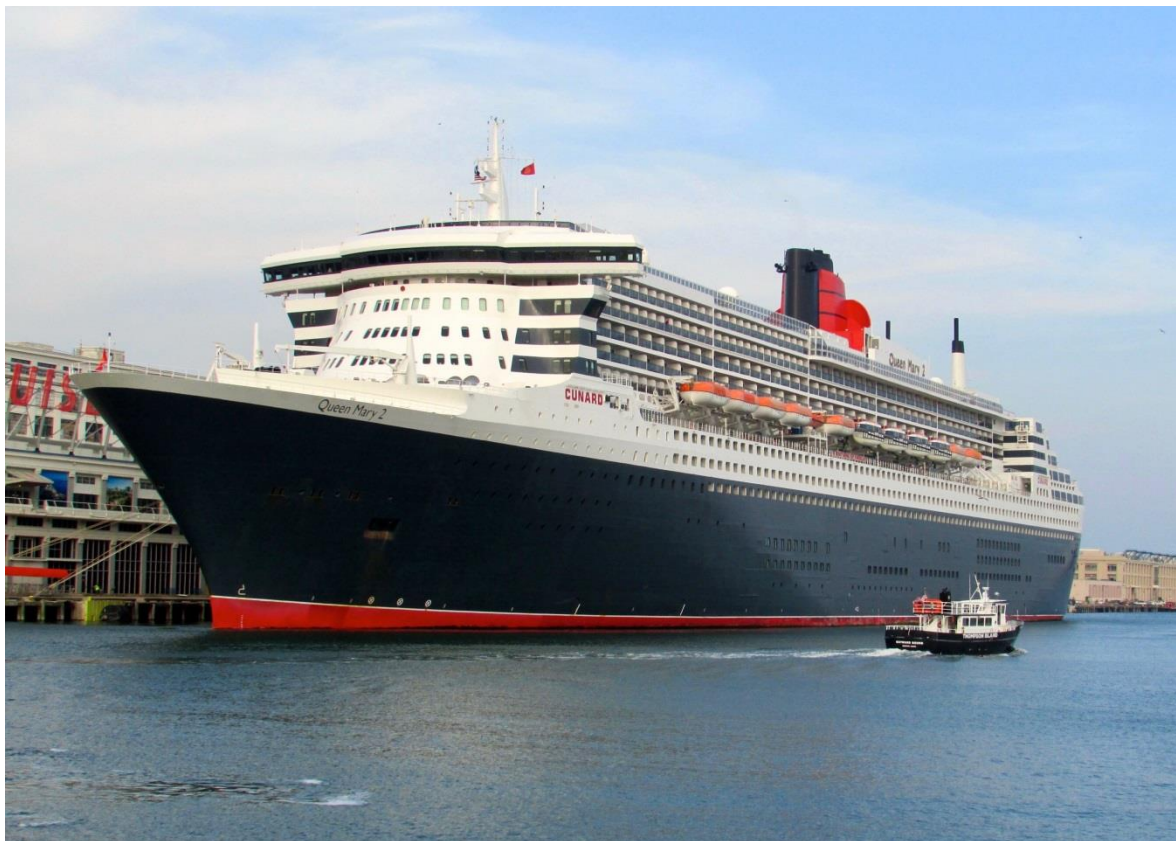
Slika 3. Britanski preookeanski brod Queen Mary 2 [30]

njih odlučuje zbog straha od putovanja zrakoplovom ili ih doživljavaju kao primamljivu turističku ponudu. Od svojih početaka, još u 19. stoljeću, ovi brodovi morali su zadovoljavati sve veće zahtjeve. Prvi brodovi bili su mali i pretrpani, što je dovelo do nesanitarnih uvjeta na brodu. Eliminiranje tih negativnih pojava zahtijevalo je veće brodove, kako bi se smanjila prenapučenost putnika i trajanje preookeanske plovidbe. Željezni i čelični trupovi te snaga pare omogućili su taj napredak, tako da su na primjer Cunardovi najveći brodovi postizali brzinu od čak 27 čvorova. Kasnije je većina brodarskih kompanija ipak odustala od utrke za brzinom u korist veličine, luksuza i sigurnosti. Glavne odlike tih brodova su jako dobra pomorstvenost, značajna brzina (od 25-30 čvorova) te vrlo snažni pogonski strojevi. Izduženog su oblika, oštrog pramca i vitka trupa. U prvom desetljeću ovog stoljeća još ih je postojalo samo nekoliko, poput SS Norway, koji je prvotno služio kao brod za krstarenje, da bi kasnije bio poslan u rezalište (2008.), dok su drugi, primjerice Queen Mary, sačuvani kao muzeji. Jedini danas brod ovakve vrste u službi je Queen Mary 2, britanske kompanije Cunard Line. Prikazan je na slici 3. [26]