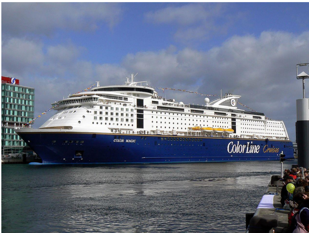
Slika 13. MS Color Magic [22]

mora, Sredozemlja, pa čak i sjevernog Atlantika. MS Color Magic je brod u vlasništvu i upravljanju norveške broderske kompanije Color Line, a plovi na ruti koja povezuje Oslo s Kielom. Izgrađen je u brodogradilištu Aker Finnyards Rauma u Finskoj 2007. godine i od tada je najveći trajekt na svijetu. Tonaža mu iznosi 75100 BT. Duljine je 224 m (LOA), širine 35 m (BOA) i gaza 6,8 m. Brod ima preko 1000 kabina te može prevoziti 2600 putnika i 550 automobila. Prikazan je na slici 13. [9][10][22]