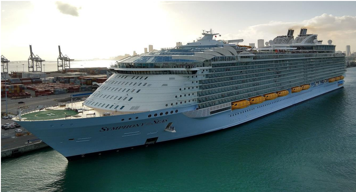
Slika 11. Symphony of the Seas [36]

uključuju restorane, noćne klubove, koktel barove (jedan od koktel barova uključuje elektroničko naručivanje pića putem pametnih uređaja te dva robota barmena koji mogu pripremiti do dva pića u minuti), dječji vodeni park, igralište za košarku u punoj veličini, klizalište, žičaru visoku 10 paluba, kazalište s kapacitetom od 1400 sjedećih mjesta, vanjski vodeni park s platformama olimpijske visine, dva zida za slobodno penjanje visine 13 m itd. Na slici 11. prikazan je najveći putnički brod na svijetu. [13][34][36]