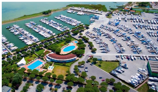
Slika 4. Suha marina [10]

Marine se dijele na tri kategorije: marine najvišeg standarda, marine srednjeg standarda i marine najnižeg standarda. Zbog ubrzanoga razvoja nautičkog turizma, marine, kao najrazvijeniji oblici nautičkih luka, nude veliki broj proizvoda i drugih djelatnosti. Sve se češće u marinama grade heliodromi, sportski tereni, kongresne dvorane, welness centri i drugi sadržaji [9]. Sidrištem se naziva dio vodnog prostora koji ima opremu za privez plovnih objekata u uvali zaštićenoj od nevremena. Privezište je dio vodnog prostora i dio obale uređen za pristajanje plovnih objekata i opremljeno je priveznim sustavom. Suha marina (slika 4) predstavlja ograđeni dio kopna koji je uređen za pružanje usluga spremanja i čuvanja plovnih objekata na suhom te njegova transporta u vodni prostor ili iz vodnog prostora do suhe marine [9].