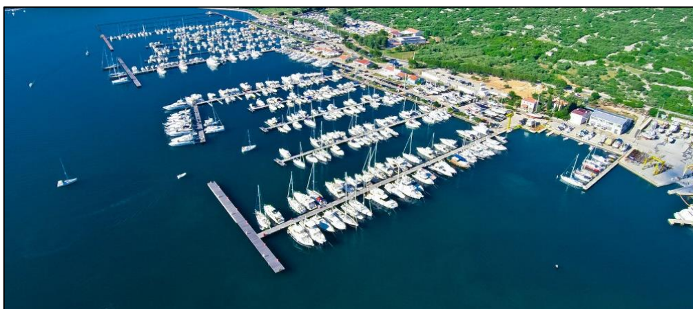
Slika 1. Marina Punat, otok Krk [5]