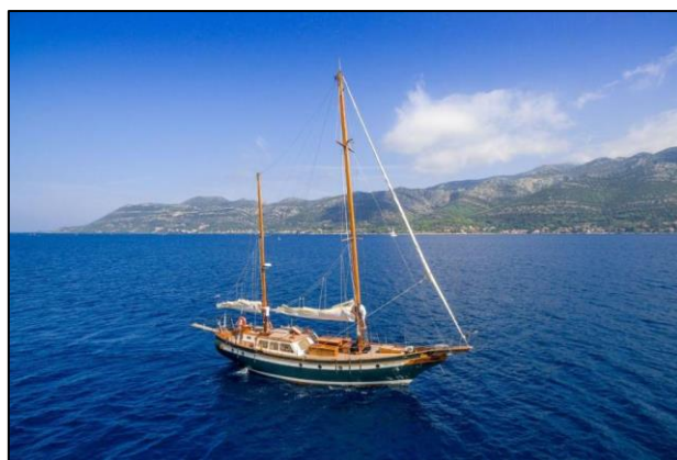
Slika 2. Hrvatski motorni jedrenjak [6]

Važno je navesti i ostale podjele nautičkog turizma iz različitih perspektiva (tablica 1).