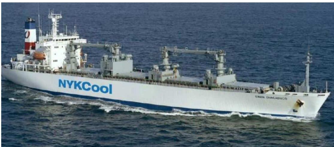
Slika 2. Brod za prijevoz hlađenih tereta [8]

Najveći brodar s flotom kontejnerskih brodova za prijevoz rashlađenih tereta je danski Maersk (390.000 TEU), slijedi švicarska kompanija MSC (106.000) te francuska CMA CGM (95.000). Godine 2000. u svijetu su bila ukupno dva milijuna kontejnera za prijevoz rashlađenih tereta, a osam godina kasnije čak 5,2 milijuna [9]. Primjer broda za prijevoz rashlađenih tereta prikazan je na Slici 2.