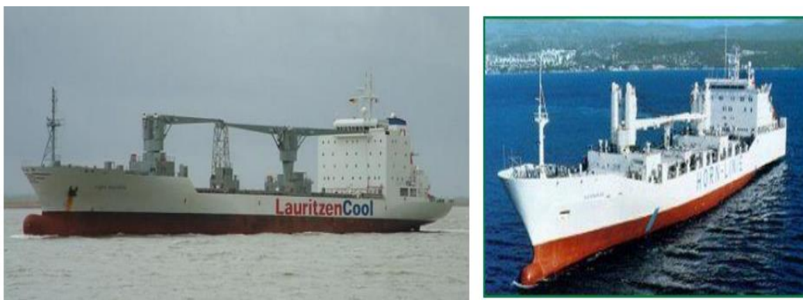
Slika 4. Brodovi za prijevoz rashladnih kontejnera [8]

Naziv kontejner potječe od engleske riječi container (eng. „contain“ – sadržavati) a znači sve ono što u sebi može sadržavati nešto drugo. Kontejner je dakle manipulacijska prijevozna oprema, najčešće u obliku zatvorene posude, koja služi za formiranje krupnih manipulativnih jedinica tereta u cilju racionalizacije manipulacijskih i skladišnih operacija [3].