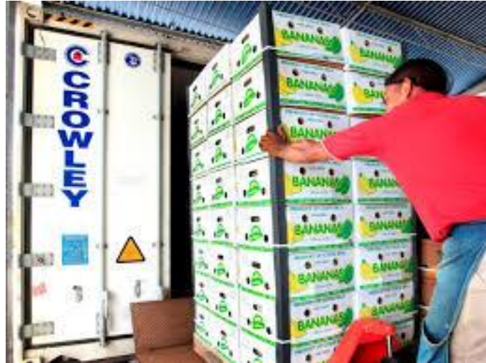
Slika 12. Ukrcaj banana u hladnjaču [19]

Ananas namijenjen otpremi bere se dok je zelen, oni namijenjeni neposrednoj konzumaciji beru se u poluzrelom stanju, a oni koji su namijenjeni za konzerviranje u zreloom stanju. Za prijevoz može biti odobreno samo zdravo voće s fungicidnom pastom na odrezanoj stabljici. Ananas koji se prije prijevoza nagrize, mora se odbaciti jer počinje vrlo brzo truliti. Ananas koji pati od staklenog kvarenja (proziran izgled) neprikladan je za transport, jer brzo razvija vinski okus zbog fermentacije i ima povećanu osjetljivost na površinske plijesni. Ananas s više od 20% staklenosti predstavlja transportni rizik.