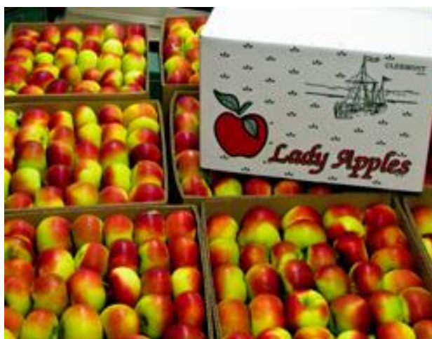
Slika 9. Jabuke u kartonskim kutijama za transport [16]

Jabuke se prevoze u sanducima i kutijama (Slika 9.). Spojene kutije su jake i izrađene su od drva bez smole (standardne kutije od mekog drva) radi sprječavanja prenošenja mirisa na plodove. Težina i dimenzije paketa su uglavnom promjenjive [13].