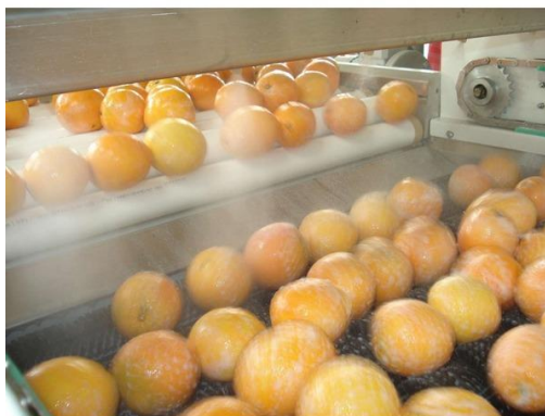
Slika 11. Premazivanje naranči voskom [18]

Naranče se uglavnom prevoze u kartonima, standardnim kutijama, polukutijama i voćnim sanducima napravljenim od valovitog kartona ili drva. Ponekad se prevoze i u mrežastim vrećama. Kontejneri moraju biti prethlađeni prije ukrcaja [13].