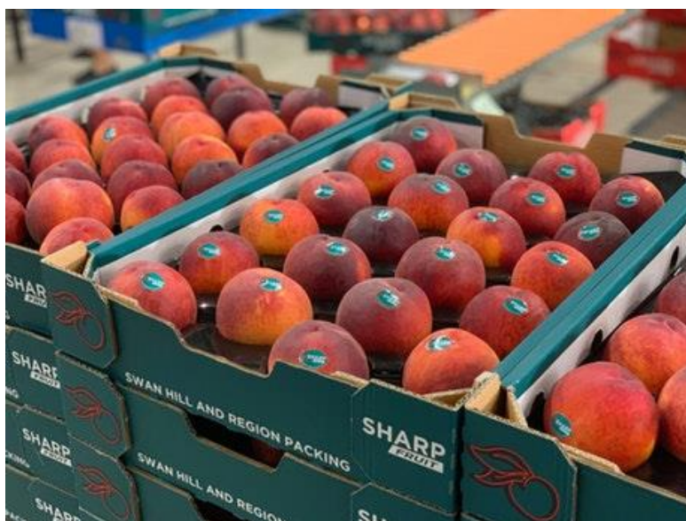
Slika 10. Kutije za breskve s posebno oblikovanim umetcima [17]