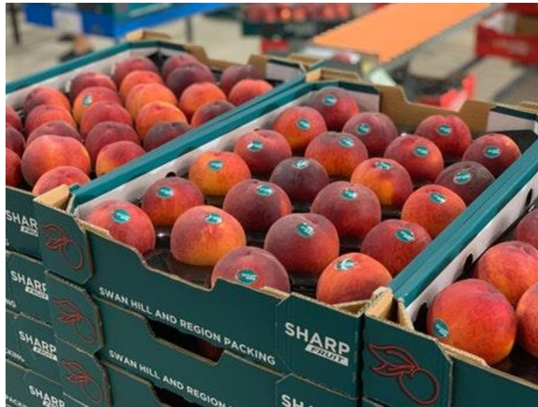
Slika 10. Kutije za breskve s posebno oblikovanim umetcima [17]