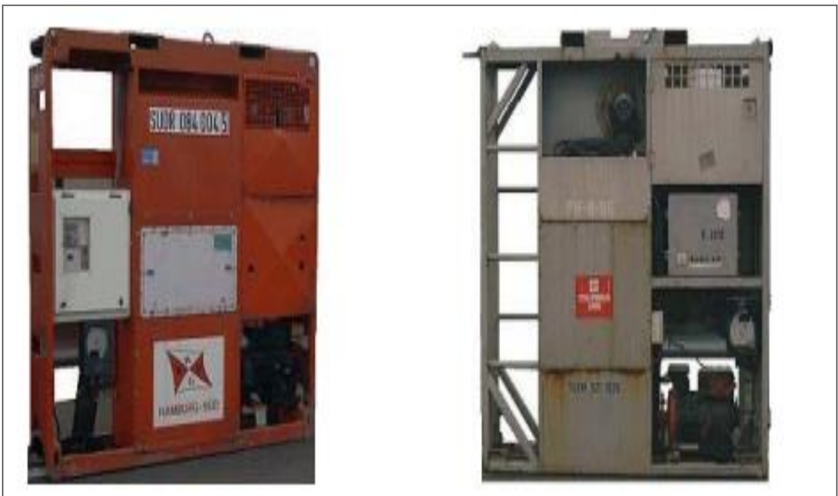
Slika 7. Jedinice koje su prenosive i pričvršćuju se na kontejner [1]

Rashladne jedinice danas se kontroliraju i reguliraju uz pomoć elektroničkih kontrolnih jedinica. Ovisno o karakteristikama uređaja izvršavaju zadatke različitog stupnja kompleksnosti. Međutim, mora se ukazati na to da su upravo kontrolne jedinice vrlo često uzrok problema. Mnogo štete na hladnjacima uzrokovano je neispravnim jedinicama za kontrolu ili perifernim uređajima povezanih njima (npr. senzori). Kontrolne jedinice zbog toga moraju biti dizajnirane da budu što su robusnije moguće, kao i da budu u mogućnosti da podnesu prevlađujući vanjske utjecaje u obliku topline, hladnoće i vlage (Slika 7.) [15].