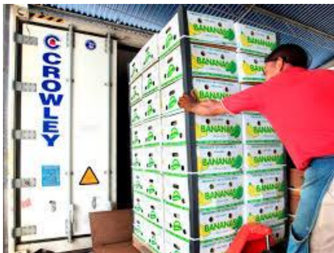
Slika 12. Ukrcaj banana u hladnjaču [19]

Ananas namijenjen otpremi bere se dok je zelen, oni namijenjeni neposrednoj konzumaciji beru se u poluzrelom stanju, a oni koji su namijenjeni za konzerviranje u zreloom stanju. Za prijevoz može biti odobreno samo zdravo voće s fungicidnom pastom na odrezanoj stabljici. Ananas koji se prije prijevoza nagrize, mora se odbaciti jer počinje vrlo brzo truliti. Ananas koji pati od staklenog kvarenja (proziran izgled) neprikladan je za transport, jer brzo razvija vinski okus zbog fermentacije i ima povećanu osjetljivost na površinske plijesni. Ananas s više od 20% staklenosti predstavlja transportni rizik.