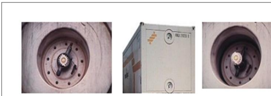
Slika 8. Otvori za isporuku i povratak zraka na vanjskoj jedinici [12]

Za prijevoz navedenih kategorija tereta mogu se koristiti i rashladni kontejneri [10]. Na Slici 8. prikazan je rashladni kontejner te otvori za isporuku i povratak zraka na rashladnoj jedinici.