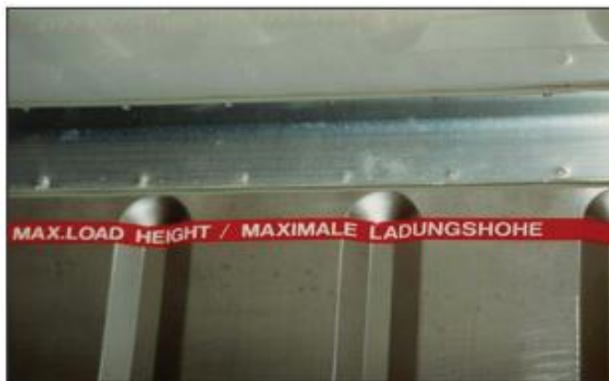
Slika 6. Maksimalna visina tereta u rashladnom kontejneru [7]

U suvremenim kontejnerima postiže se 30 - 40 promjena zraka po satu kada se transportira zamrznuta roba i oko 60 - 80 promjena po satu za transport voća. Diferencijalni tlak na kružnom ventilatoru (razlika u tlaku između strane tlaka i strane usisavanja) za normalno skladištenje je oko 1,59 - 3,33 kPa, ali su i druge vrijednosti moguće u ovisnosti od skladišta, frekvencije opskrbe energijom i stupnja otvorenosti poklopca svježeg zraka. Neki noviji modeli kontejnera imaju ventilatore promjenjive brzine, gdje se brzina utvrđuje po razlici temperature između dolaznog i odlaznog zraka. Roba mora biti uskladištena u kontejneru na način da protok zraka nije ugrožen. Na primjer, skladišteći robu preko crvene linije kapaciteta - maksimalna visina tereta (Slika 6.) sprječava se cirkulacija zraka, kao rezultat slobodnog prostora ispred vrata [15].