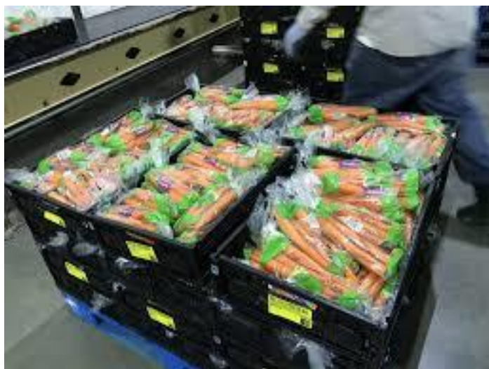
Slika 14. Slaganje mrkvi na paletu [21]

Rajčice, koje se beru kad su zelene, naknadno sazrijevaju pa dobivaju svoju crvenu boju (sadržaj likopena i karotena). Međutim, njihova se tipična aroma ne može potpuno razviti. Najbolje vrijeme za branje rajčice razlikuje se ovisno o namjeri korištenja (npr. trajanju prijevoza). Rajčice na otvorenom imaju veći sadržaj hranjivih sastojaka od rajčice u stakleniku [13].