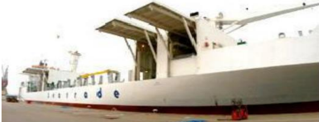
Slika 3. Brod s bočnim otvorima [8]

Tehnologija kontejnera sa otvorom razvijena je prije 1970-tih i korištena je na rutama na kojima su se prevozile velike količine hlađenog tereta. Prva generacija kontejnerskih brodova sa kontejnerima s otvorima je danas stara preko 25 godina i uskoro će biti zamijenjena brodovima s većim kapacitetom za kontejnere s integriranim hlađenjem. Kontejneri s otvorom su termički izolirani i imaju dva plombirana otvora (prozora) na krajnjim zidovima kroz koje se hladan zrak može upuhivati u kontejner, a topli zrak može izbacivati van. Hladan zrak se upuhuje kroz donje otvore u kontejner, zatim distribuira kroz teret uz pomoć rešetke i nastavlja se kretati prema vrhu kontejnera gdje izlazi kroz gornji otvor. Otvori na kontejnerima mogu imati tri veličine [15].