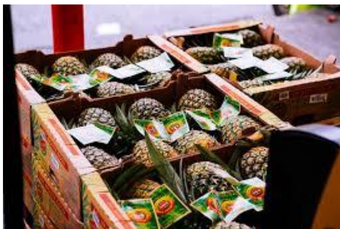
Slika 13. Ananas spreman za transport [20]

Ananas se pakira u kartonske kutije, sanduke i voćne sanduke (Slika 13.), od kojih su najpoznatije tzv. „japanski vrt“ kutije. Ove kutije, koje su na vrhu i na bočnim stranama perforirane, svaka sadrže npr. dva umetka sa po šest ćelija za ukupno 12 komada voća [13].