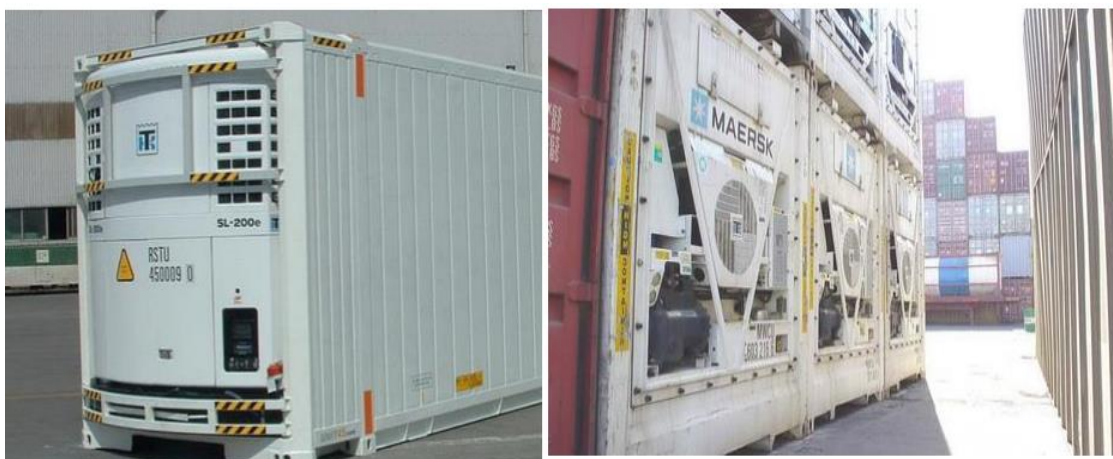
Slika 1. Kontejneri za prijevoz hladnog tereta [8]

Hlađenje je proces u kojem se temperatura prostora ili njegovog sadržaja smanjuje ispod temperature u njihovoj okolini. Hlađenje se koristi u prijevozu nekih ukapljenih plinova i rasutih kemikalija, u klimatizacijskim sustavima, za hlađenje rasutog CO 2 za protupožarne sustave i za očuvanje kvarljivih namirnica tijekom prijevoza hrane [6]. Rashladni kontejneri, ili hladnjaci (eng. reefer ) (Slika 1.), od posebne su važnosti za transportne kompanije i slične organizacije, iz razloga što omogućavaju relativno visoke cijene prijevoza i profitne stope što nije moguće postići sa suhim kontejnerima. Iz tog razloga gotovo sve transportne kompanije pokušavaju proširiti svoje poslovanje sa hladnjacima. Obično se podaci vezani za kontejnere iskazuju u “TEU” jedinicama. TEU označava ekvivalentnu jedinicu od 20 stopa i koristi se da označi kontejner veličine 20 stopa. Analogno tome, kontejner od 40 stopa se sastoji od 2 TEU jedinice. Za kontejnere od 40 stopa se ponekad koristi i skraćenica “FEU”. FEU je dakle ekvivalent 2 TEU [15].