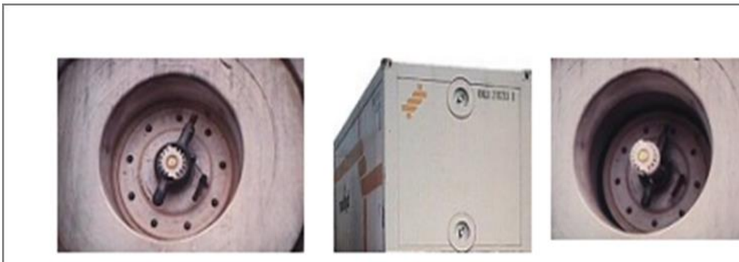
Slika 8. Otvori za isporuku i povratak zraka na vanjskoj jedinici [12]

Za prijevoz navedenih kategorija tereta mogu se koristiti i rashladni kontejneri [10]. Na Slici 8. prikazan je rashladni kontejner te otvori za isporuku i povratak zraka na rashladnoj jedinici.