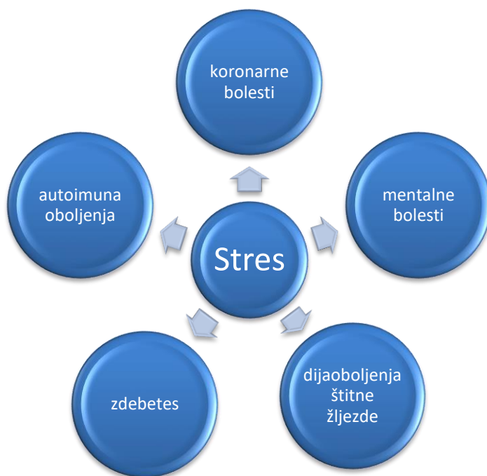
Slika 2. Utjecaj stresa na zdravlje radnika [1]

Kaže se da tamo gdje su radnici izloženi stresu, nema dostojnog rada. Poslodavac je dužan osigurati radniku uvjete za rad na siguran način i na način koji ne ugrožava zdravlje radnika, u skladu s posebnim zakonom i drugim propisima. Stres vezano za radno mjesto možemo definirati kao odgovor našega tijela na prekomjeran rad, nekorektno ponašanje poslodavca ili radnih kolega, te prijetnju fizičke ili psihičke naravi. Kada je čovjek izložen stresnim situacijama to dovodi do raznih vrsta oboljenja (koronarnih, mentalnih, autoimunih oboljenja, dijabetes, oboljenja štitne žlijezde i drugo). [1]