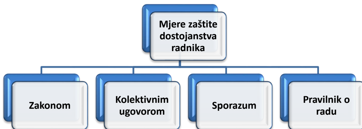
Slika 1. Postupci i mjere zaštite dostojanstva radnika [2]

Poslodavac ili osoba koja je ovlaštena za primitak i rješavanje pritužbi dužna je, u roku utvrđenom kolektivnim ugovorom, sporazumom sklopljenim između radničkog vijeća i poslodavca ili pravilnikom o radu, a najkasnije u roku od osam dana od dostave pritužbe, ispitati pritužbu i poduzeti sve potrebne mjere primjerene pojedinom slučaju radi sprječavanja nastavka uznemiravanja ili spolnog uznemiravanja ako utvrdi da ono postoji. [2]