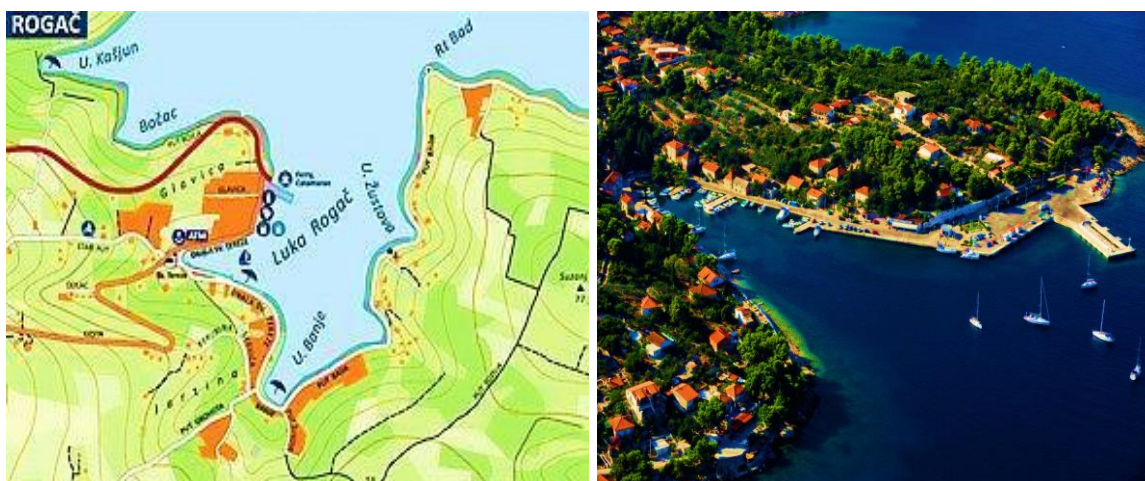
Slika 6. Luka Rogač [21]

Između Južnog rata i Rata najveći je zaljev otoka Šolte, Nečujam, uvučen u kopno 1 NM. Zbog svoje veličine, još se naziva i Gluha uvala. Orijentiri su svjetlo na rtu Bad, svjetlo na rtu Rat, zgrade hotelskog naselja te crkvice u blizini mola na istočnoj strani. Nečujam je poprilično zaklonjen od svih vjetrova osim bure. U zaljevu se nalaze još 6 uvala pogodnih za sidrenje brodova i jahti. Omiljena je destinacija domaćih izletnika te gostijma s charter flota koji noće u uvalama subotom i četvrtkom te je u tim danima gužva na sidrištima očekivana. Charter baze, najbliže u Splitu i Trogiru, službeni check in obavljaju subotom ujutro, a check out petkom navečer. Prema tome, iznajmljivači često, subotu nakon isplovljavanja, noće u nekim od obližnjih uvala, poput onih na otoku Braču ili Šolti. Također su na istim uvalama primorani noćiti i dan prije povratka u bazu.