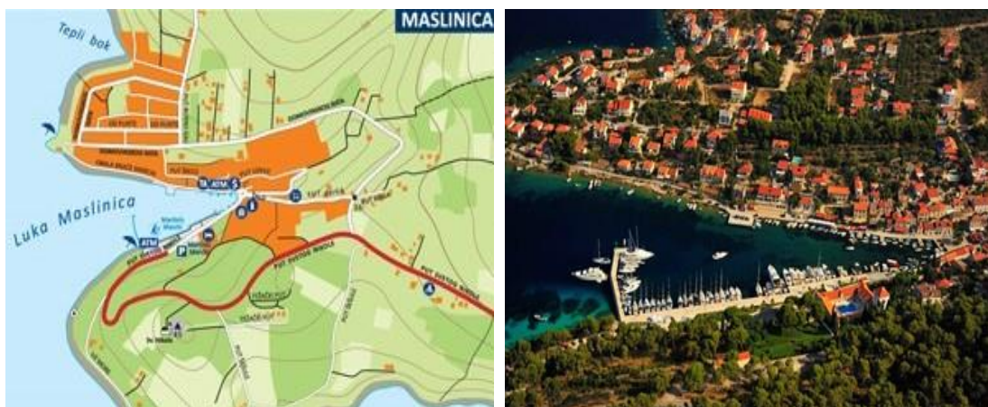
Slika 16. Maslinica [11]

Južno od Maslinice, smještena je uvala Šešula. Prividno ostavlja dojam sigurnog boravišta, no po snažnoj tramontani bolje iz uvale isploviti i naći drugo zaklonište. Na sjevernoj strani obale ima dva restorana koji nude muring za goste. U krajnjem kraku koji se sužava, nalazi se prekrasna šljunčana plaza. Najbolje se sidriti u istom kraku, na muljevitu i travom obraslu dnu. U južnom kraku je smješten kavez iz uzgajališta.