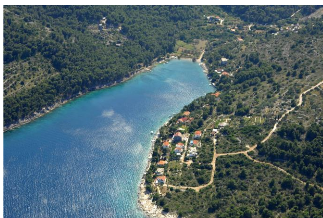
Slika 9. Gornja Krušica [14]