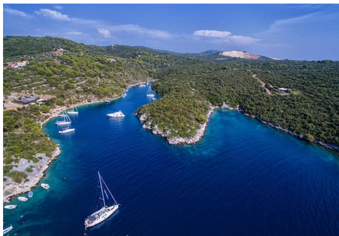
Slika 17. Uvala Šešula [23]

Najljepši prizor koji se pruža sa plaža Maslinice je na šoltanski arhipelag od 7 otočića: Balkun, Rudula, Grmej, Saskinja, Polebrnjak, najveći Stipanska, i hrid Kamčić. Oko otočića, također poznatom nautičarskom destinacijom, dubine su primjerene za sidrenje plovila svih veličina, ali na samoj poziciji prijete vjetrovi iz svih smjerova. Kod prijatnji od zapadnih vjetrova sidri se u zavjetrini otočića Balkun. Prolaženjem preko otočića Saskinja, najbližeg Maslinici, potrebno je voditi računa o gazu broda jer su prolazi uski, a najveća dubina doseže maksimalna 3,5 metra.