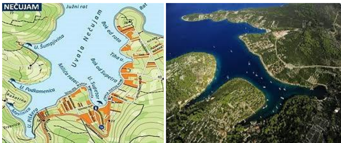
Slika 7. Nečujam [21]

Istočno od uvale Nečujam slijedi 5 uvala nedostatne površine za sidrenje više plovila no vrijedne istraživanja. Nisu po ničem osobite i vrlo su slabo zaštićene, ali u danima bonace mogu pružiti mir i tišinu onima koji je potražuju.