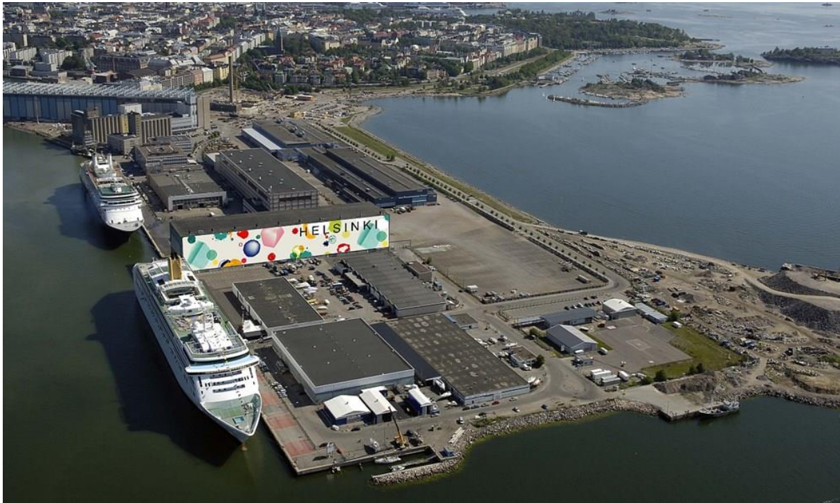
Slika 5. West Harbour Helsinki [7]

Slika 5. prikazuje West Harbour terminal u Helsinkiu.