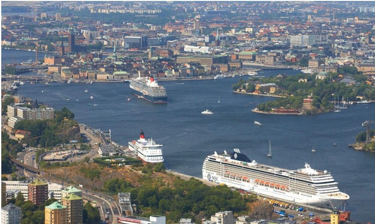
Slika 6: Terminal Nynashamn [7]

Između 2013. i 2016. godine obnovljena je cijela luka Vartahamnen s pet novih pristaništa s pametnim i ekološki prihvatljivim rješenjima te suvremenim putničkim terminalom.