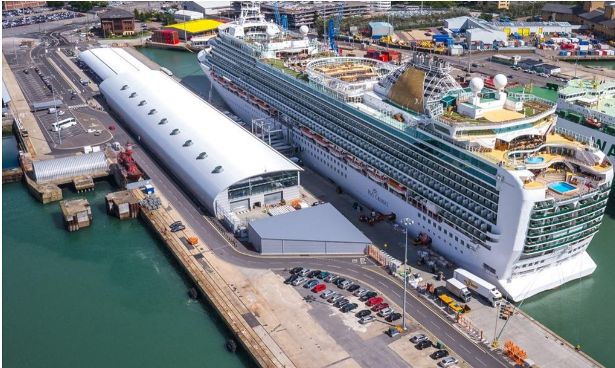
Slika 10. Ocean Cruise terminal [7]

Slika 10. prikazuje Ocean Cruise terminal. Ocean Cruise terminal otvoren je 2009. godine. Ima modernu građevinu, parkiralište za kratki boravak, bar, kafić, taxi.