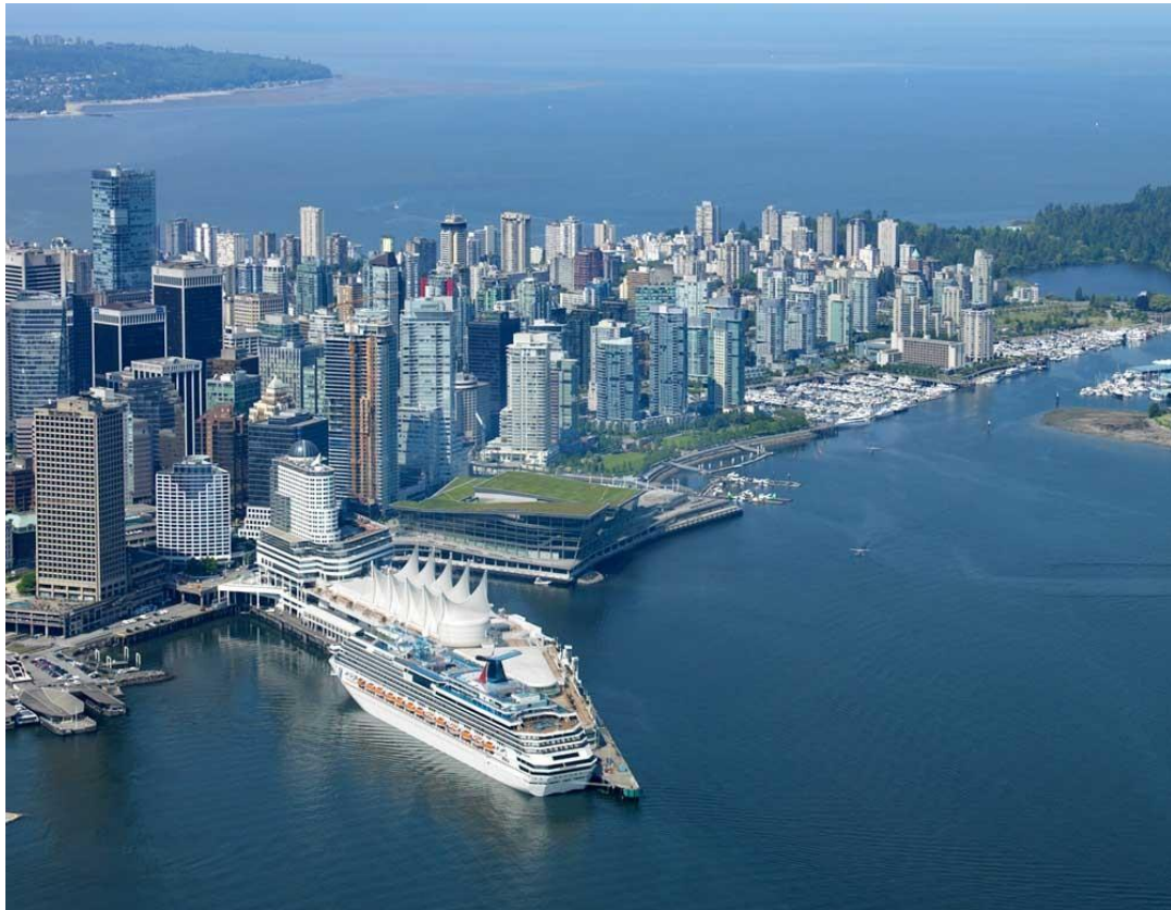
Slika 11. Canada Place terminal [7]