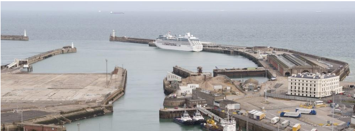
Slika 9. Terminal 2 za brodove za kružna putovanja [7]