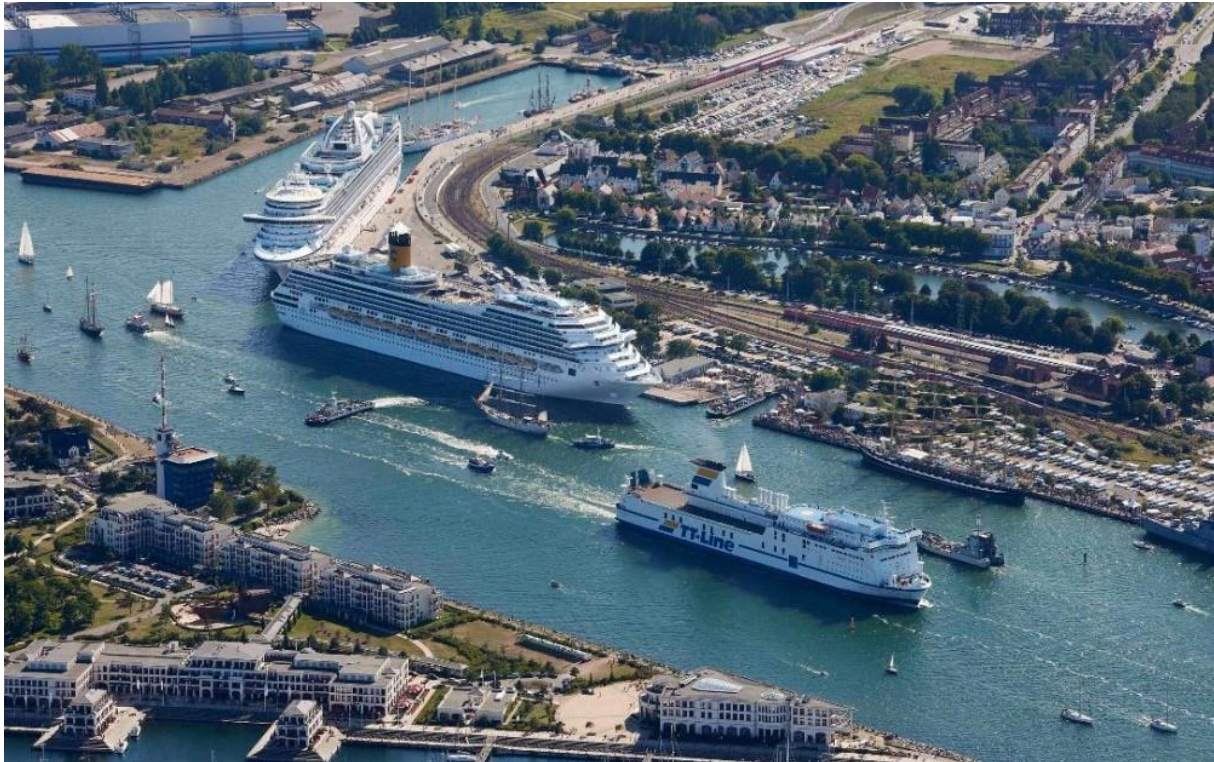
Slika 7. Warnemunde-Rostock luka [7]

Slika 7. prikazuje Warnemunde-Rosck luku za kružna putovanja.