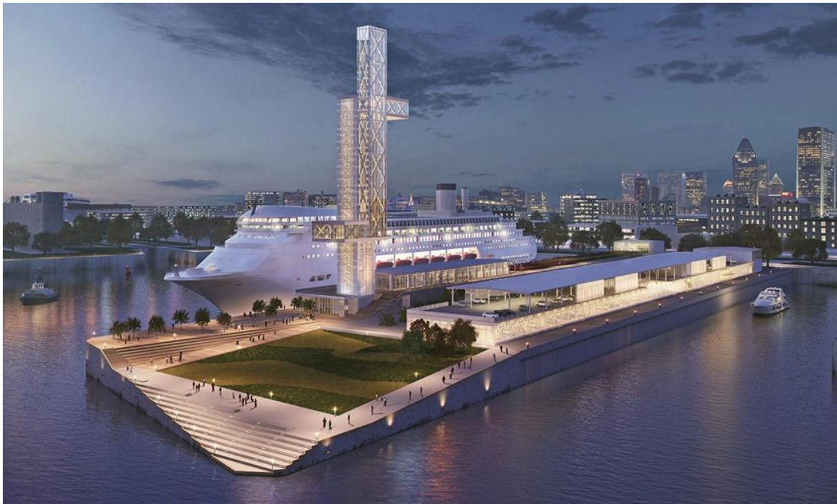
Slika 12. Novi Montreal terminal za prihvat brodova za kružna putovanja [7]

Montreal Cruise Terminal (drugi putnički terminal luke) otvoren je u svibnju 2017. godine. Prvi brod je bio Maasdam . Projekt izgradnje koštao je 78 milijuna USD, od čega je vlada Quebeca doprinijela s 20 milijuna, Montreal City 15 milijuna i Montrealska Lučka uprava 43 milijuna. Novi putnički terminal također služi kao prostor za događanja bez dnevnih putovanja i time ostvaruje prihode tijekom cijele godine, slika 12 [7].