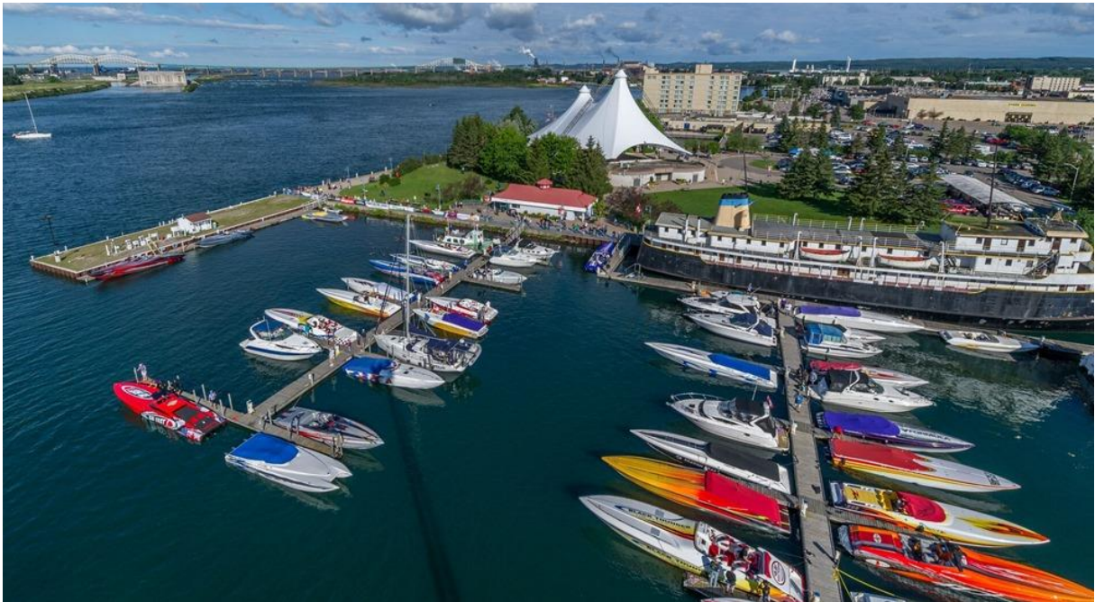
Slika 13. Sault Ste Marie terminal za brodove za kružna putovanja [7]

Sault Ste Marie je lučki grad u Ontariju (jugoistočna-središnja Kanada), s oko 80.000 stanovnika. Nalazi se na rijeci St. Marys i blizu granice sa SAD-om. Brodovi za kružna putovanja u Sault Ste Marie (Kanada) pristaju u blizini marine Roberta Bondar. Objekt je dio parka Roberta Bondar i nudi 38 kompleta (za brodice i jahte za obilazak), napajanje obalom, priključke za vodu. Dodatne usluge za nautičare su tuševi, praonica rublja, punjenje goriva, ispušavanje otpadnih voda, crtanje (knjige), vodiči za krstarenja, razni morski proizvodi [7].