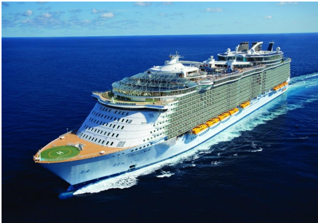
Slika 1. MS Oasis of the Seas [10]

Plovila se kategoriziraju na više načina, a mogu se podijeliti prema poslovnom modelu, veličini i načinu života putnika. Također, ovisno o dobi putnika kao i njihovim interesima i financijskoj slobodi, brodovi mogu biti namijenjeni za avanture, ugođaj, obrazovanje, kulturu, zabavu, sportske aktivnosti, wellness ili rekreaciju [5]. Slika 1. prikazuje brod za kružna putovanja MS Oasis of the Seas.