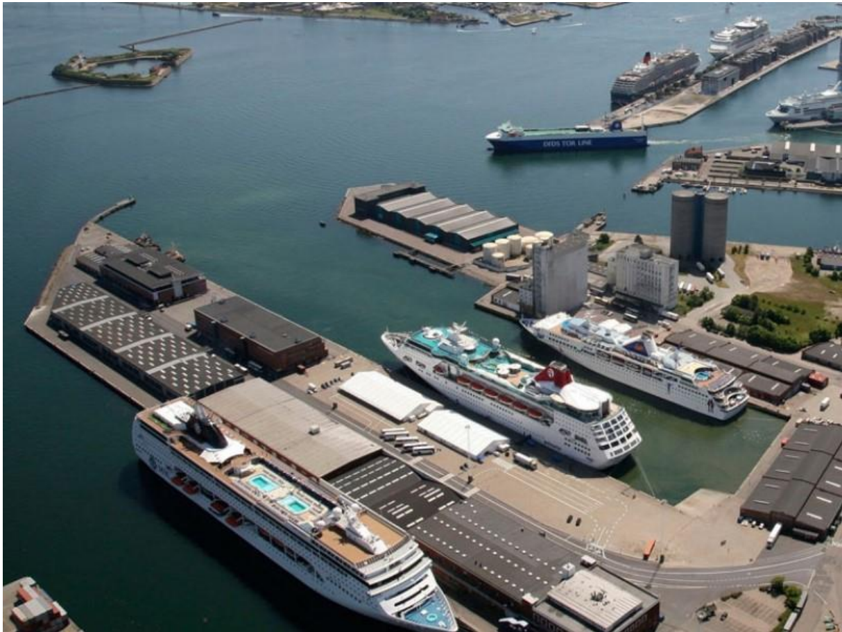
Slika 4. Terminal Langelinie [7]