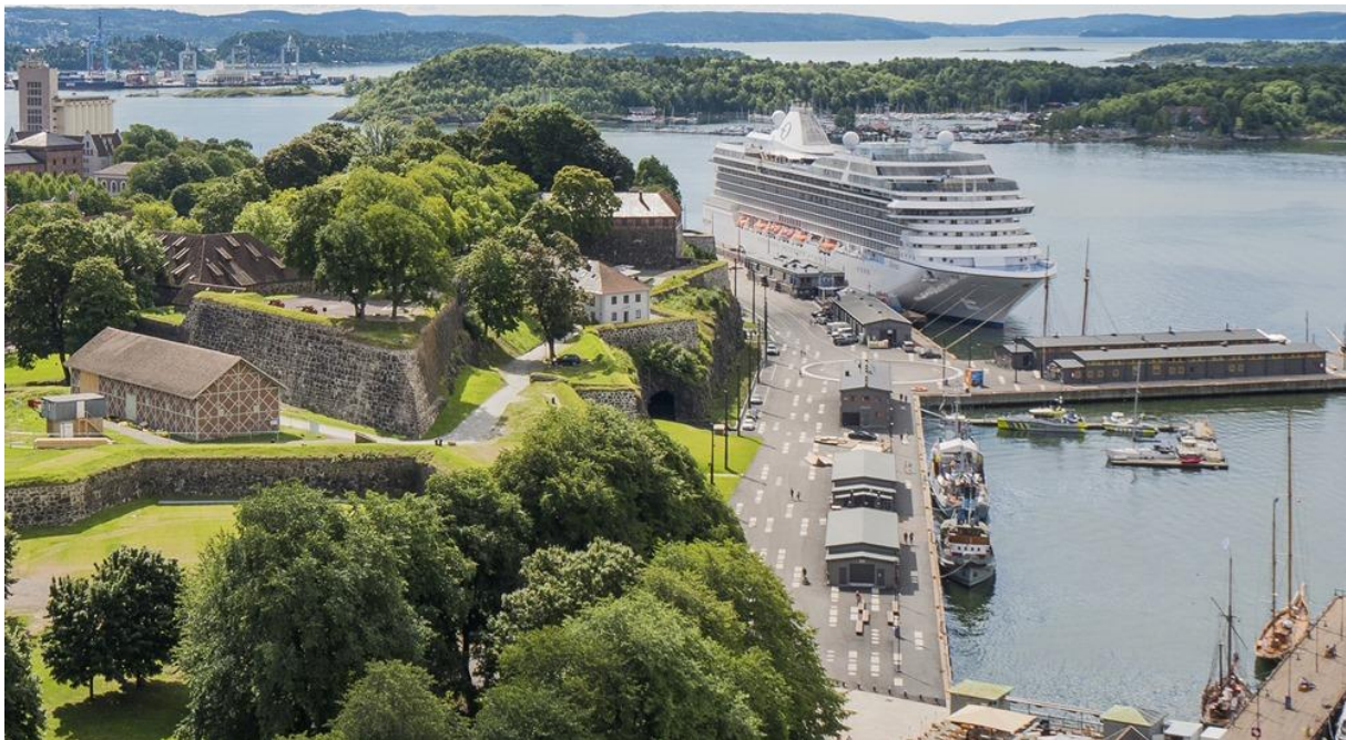
Slika 8. Terminal za brodove za kružna putovanja u Oslu [7]

Slika 8. prikazuje terminal za brodove za kružna putovanja u Oslu.