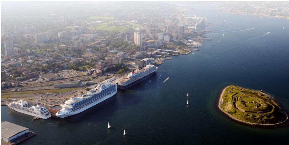
Slika 14. Halifax terminali za brodove za kružna putovanja [7]

Luka Halifax ima 2 namjenska terminala za brodove za kružna putovanja. Oba su dio kompleksa paviljona pod nazivom Paviljon 22 i Paviljon 20. Njihovi glavni vezovi su, redom pristanište 22 (engl. Pier 22 ) i pristanište 20 (engl. Pier 20 ). Oba veza povezana su sa svojim terminalnim zgradama preko hidrauličkih prolaza (pokretni pokriveni putnički mostovi). Neki brodovi pristaju na pristaništu 31 (engl. Pier 33 ), slika 14. Zgrade luka za brodove za kružna putovanja redovito se obnavljaju i nude kao sadržaj turističke informacije, štandove lokalnih trgovaca (suveniri s kanadskim temama, ručno izrađene umjetnine i obrti), telefon, Wi-Fi internet, WC. Ispred Paviljona 22 nalazi se taksi s i turistički autobusi [7].