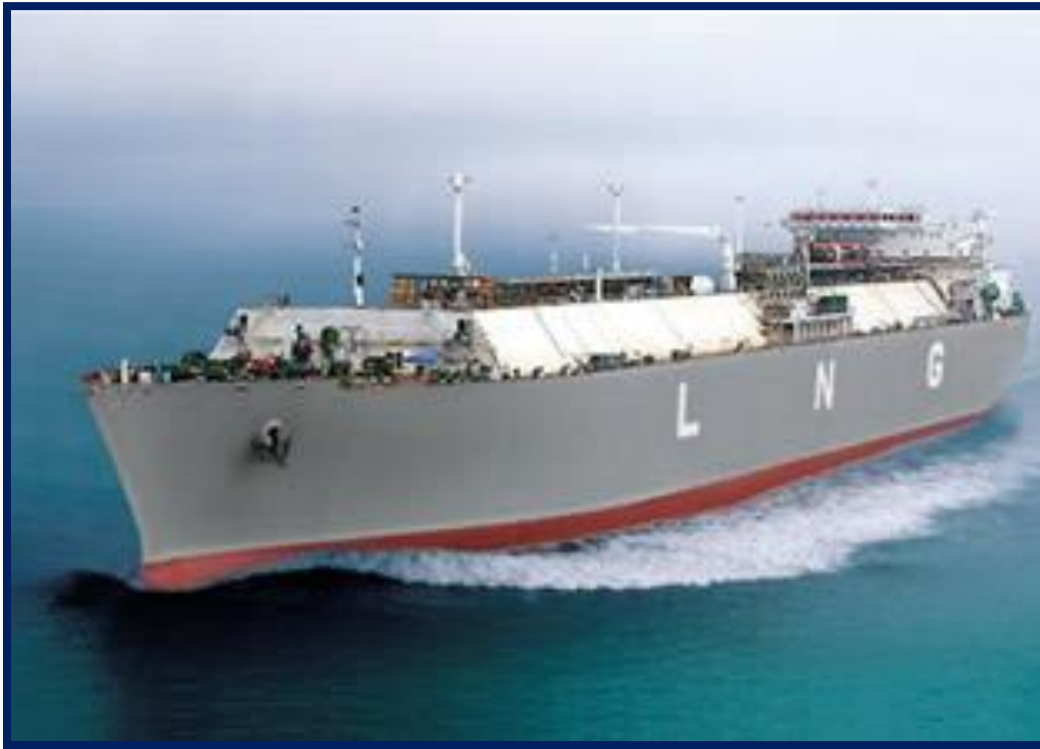
Slika 5. Specijalizirani brod za prijevoz ukapljenog plina