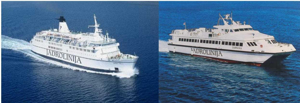
Slika 7. RO – RO putnički i brzi putnički brod nacionalnog obalnog linijskog broдача "Jadrolinije"

Današnji RO - RO putnički brodovi mogu se podijeliti u 3 osnovne skupine, ovisno o duljini linije koju opslužuju: 31