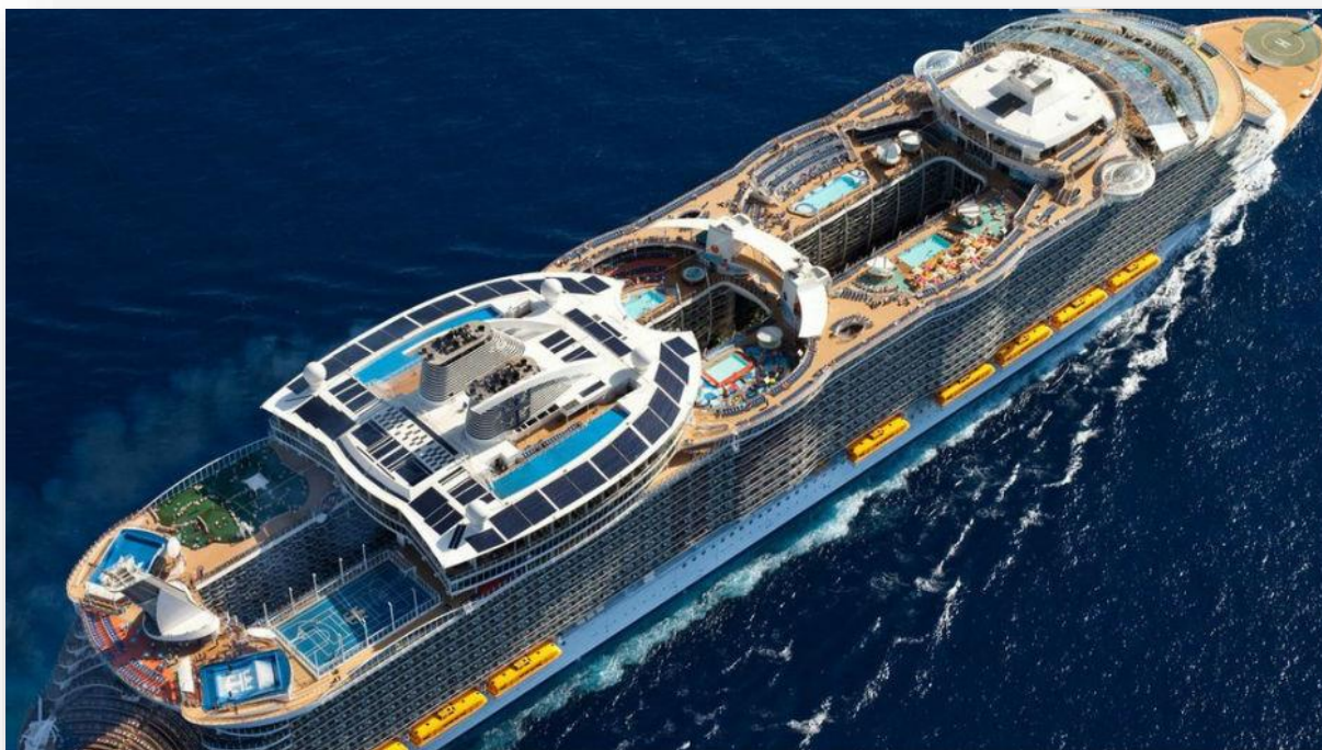
Slika 6. Specijalizirani brod za kružna putovanja