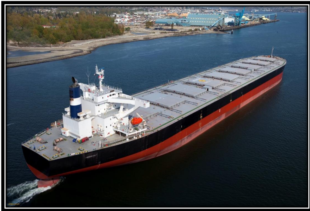
Slika 3. Specijalizirani brod za prijevoz rasutog tereta