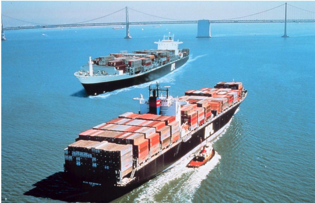
Slika 4. Specijalizirani brod za prijevoz generalnog terete - kontejnerizacija