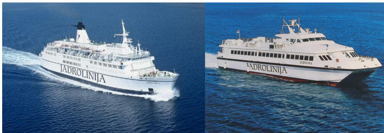
Slika 7. RO – RO putnički i brzi putnički brod nacionalnog obalnog linijskog broдача "Jadrolinije"

Današnji RO - RO putnički brodovi mogu se podijeliti u 3 osnovne skupine, ovisno o duljini linije koju opslužuju: 31