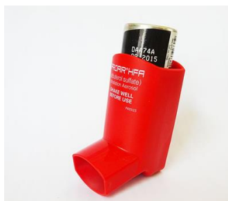
Slika 8. Lijekovi u obliku raspršivača [25]