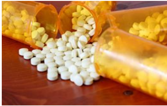
Slika 1. Lijekovi u obliku tableta [18]