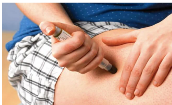
Slika 11. I.m. apliciranje adrenalina [32]