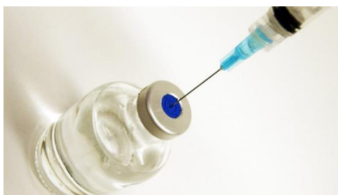
Slika 9. Lijekovi u obliku ampula [26]