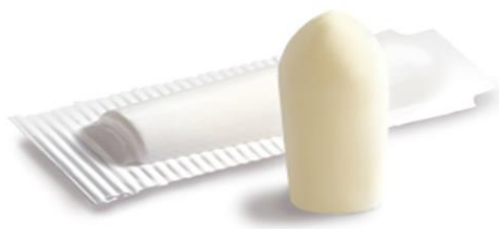
Slika 5. Lijekovi u obliku čepića [22]