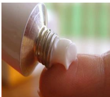
Slika 6. Lijekovi u obliku masti [23]