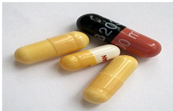
Slika 3. Lijekovi u obliku kapsula [20]