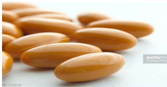
Slika 2. Lijekovi u obliku dražeja [19]