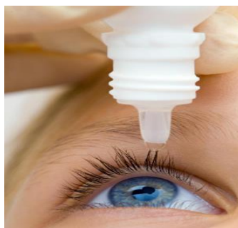
Slika 4. Lijekovi u obliku kapi [21]