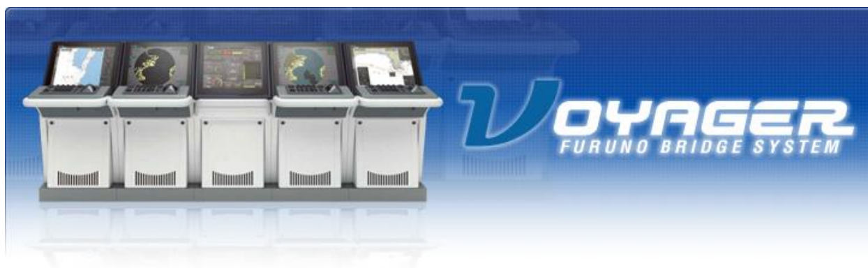
slika 5. FurunoVoyager

FURUNO VOYAGER novi sustav mostova nove generacije, osmišljen je desetljećima dugim radom te uz pomoć velike stručnosti inženjera kod projektiranja senzora, integraciji mreže i razvoju software-a.