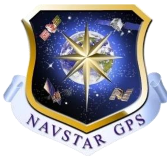
Slika 1. Navstar GPS 1.

( Historyof NAVSTAR , Rick W. Sturdevant)