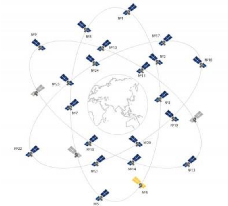
slika 3. GLONASS sateliti