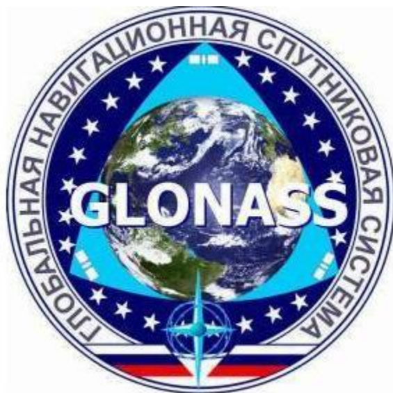
slika 2. GLONASS 1

( https://en.wikipedia.org/wiki/History_of_GLONASS http://gpsworld.com/innovation-glonass-past-present-and-future/ )