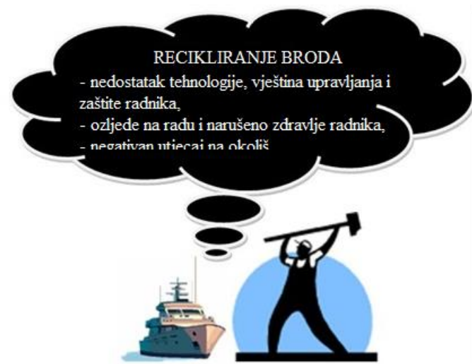
Slika 3. Problemi kod neodgovarajućeg recikliranja broda [16]