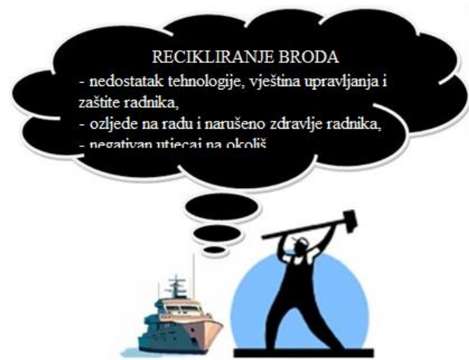
Slika 3. Problemi kod neodgovarajućeg recikliranja broda [16]