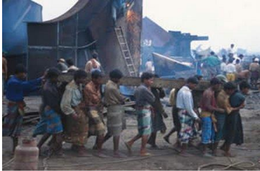
Slika 5. Neadekvatno opremljeni radnici u procesu recikliranja broda u Bangladešu [18]

Radnici koji rade u nerazvijenim zemljama su iznimno siromašni, te su svakoga dana podvrgnuti smrtnim opasnostima, a broj smrti u takvim uvjetima na brodu koji se rastavlja raste unatoč svim mjerama opreza.