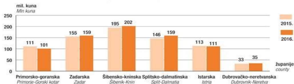
Slika 1. Grafikon G-1. i grafikon G-2