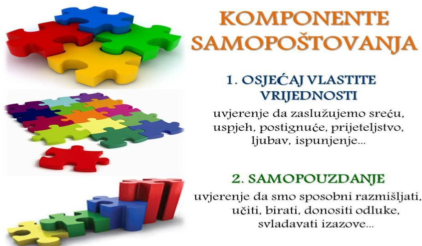
Slika 1. Komponente samopoštovanja [23]

Odgoj predstavlja važnu kariku u razvoju samopoštovanja. Odgoj djeteta započinje u obitelji. Uloga roditelja je od izuzetne važnosti. Roditelji bi trebali biti osobe koje cijene i poštuju sebe po mišljenju navedenom u [7].