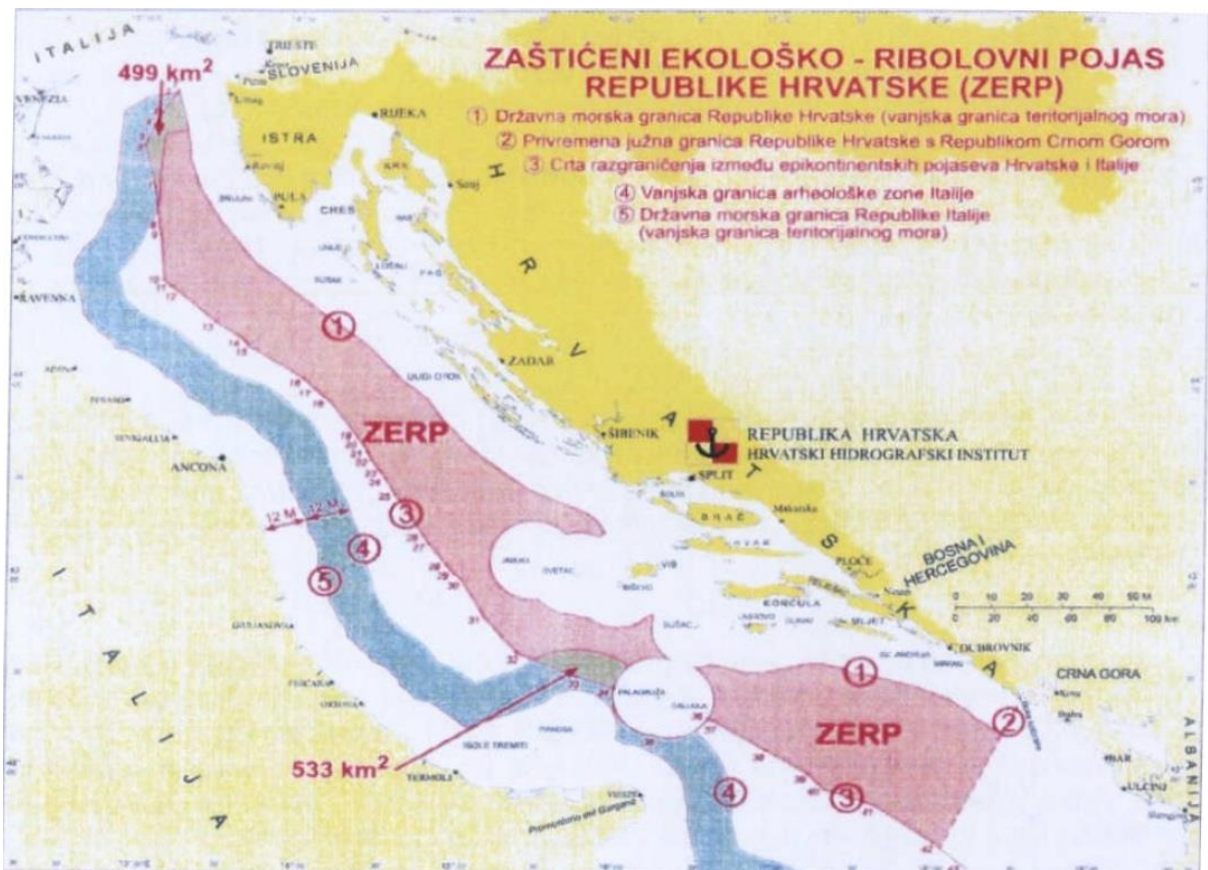
Slika 1: Zaštićeni ekološko-ribolovni pojas Republike Hrvatske

Prilikom plovidbe hrvatskim gospodarskim pojasom plovni su objekti dužni poštivati opće prihvaćene međunarodne propise i standarde te hrvatske propise o suzbijanju onečišćenja mora s brodova i onečišćenja prouzročenog potapanjem ili djelatnostima u podmorju. Zemljopisno gledano, granice gospodarskog pojasa Republike Hrvatske bile bi udaljene prosječno oko 70 km od obala naših vanjskih otoka, odnosno poklapale bi se s graničnom crtom epikontinentalnog pojasa na dnu Jadranskog mora između Republike Hrvatske i Republike Italije. Prilikom preleta gospodarskog pojasa Republike Hrvatske zrakoplovi su dužni poštivati općeprihvaćene međunarodne propise i hrvatske propise o suzbijanju onečišćenja mora iz zraka ili zrakom [6]. Zaštita i regulacija ribarenja u gospodarskom pojasu vjerojatno su najstarije i najtradicionalnije zadaće obalnih država. Rasprave primorskih država o ribarenju su mnogo češće nego o drugim pravima u gospodarskom pojasu. Zbog toga, većina država pri proglašenju pojasa postavlja visoko na listi prioriteta legalizaciju i zaštitu ribarenja.