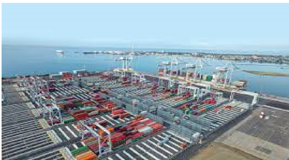
Slika 5. Automatizirani terminal [14]

Planiranje prostora za teret koji slijedi ove operacije bolje je obavljati računalima nego ljudima [13].