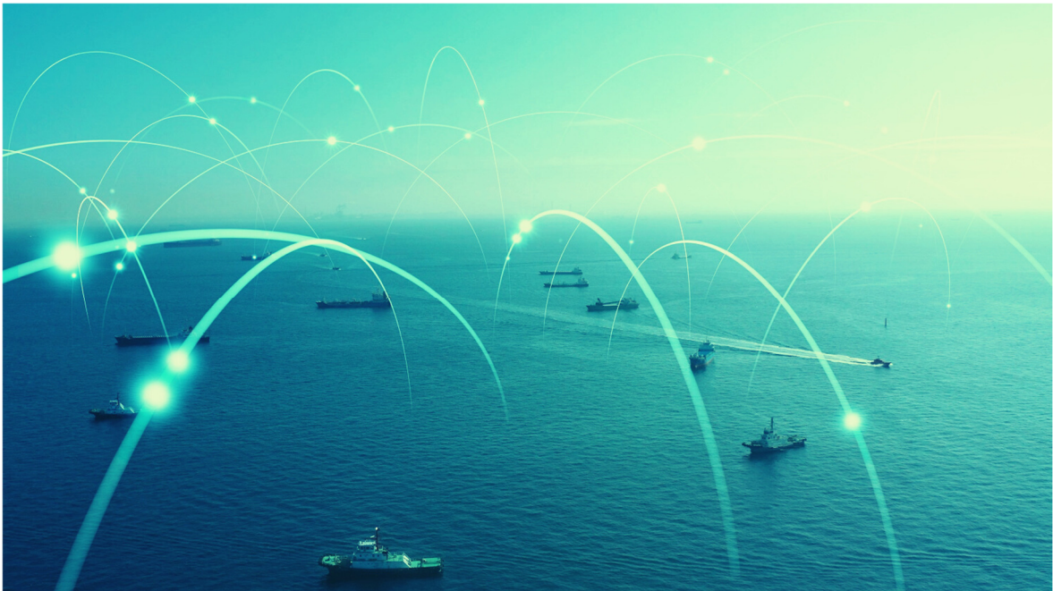
Slika 7. Digitalizacija i IT [12]