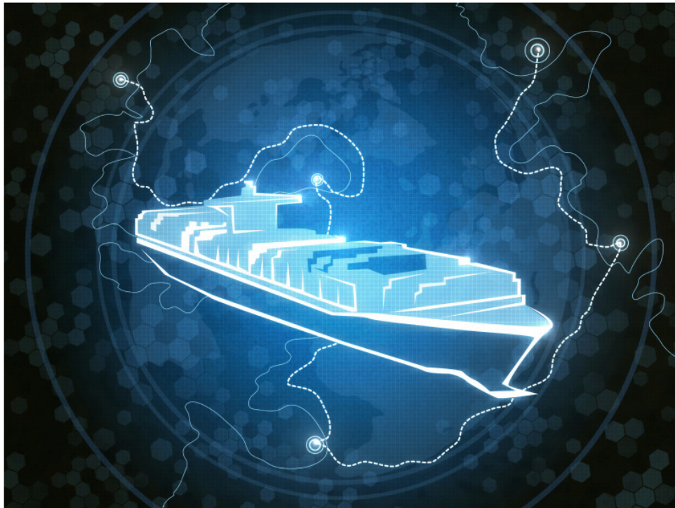
Slika 4. Automatizacija [3]

Dok mehanizacija rada omogućava poboljšane uvjete za rad osoblja, automatizacija smanjuje potrebu za ljudskom intervencijom u izvođenju određenih aktivnosti [2].