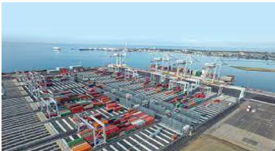
Slika 5. Automatizirani terminal [14]

Planiranje prostora za teret koji slijedi ove operacije bolje je obavljati računalima nego ljudima [13].