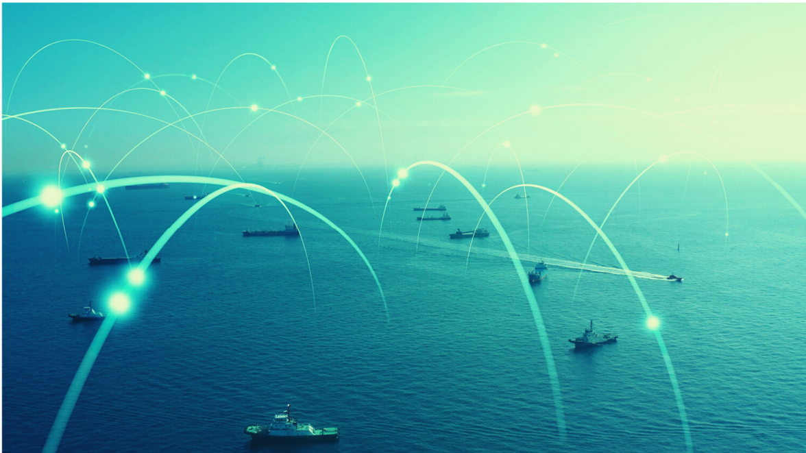
Slika 7. Digitalizacija i IT [12]