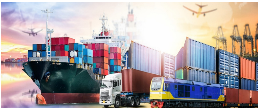
Slika 3. Multimodalni transport [17]

Suvremene globalne tendencije tržišno-robne razmjene, koje su u posljednje vrijeme znatno povećane, odražavaju se u primjeni suvremenih transportnih sustava, uključujući integralne, multimodalne i kombinirane sustave koji povezuju različita prijevozna sredstva (Slika 3.). Nove tehnologije transporta u cijelom transportnom lancu, od proizvođača do potrošača, postavljaju nužnost racionalizacije u cjelokupnom gospodarstvu i izravno utječu na konkurentne sposobnosti za integraciju nacionalnog gospodarstva u međunarodnu podjelu rada [4].