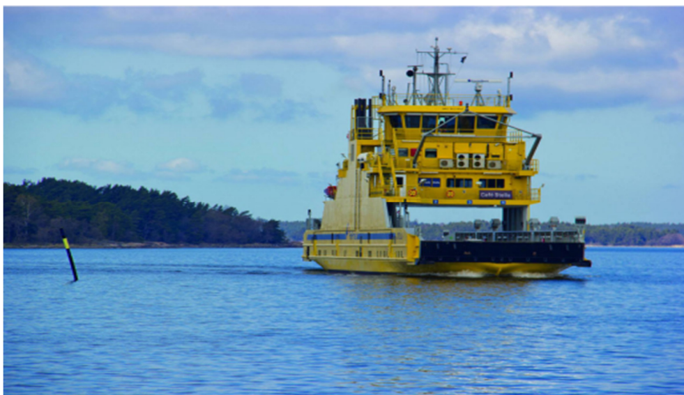
Slika 6. Autonomni brod trajekt Stella [1]

Koordinirana uporaba različitih heterogenih bespilotnih vozila može biti korisna iz nekoliko razloga. Ne samo da se različita vozila mogu koristiti za prikupljanje podataka u različitim medijima (npr. pod vodom, na površini i u zraku), već mogu poboljšati i ukupnu učinkovitost komunikacije. Međutim, područje operacije također treba uzeti u obzir prilikom odabira bespilotnih vozila koja mogu poboljšati prikupljanje podataka [1].