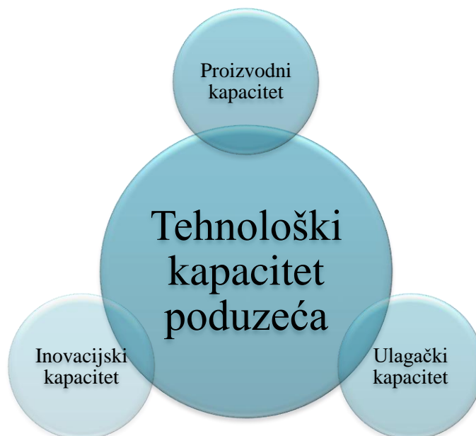
Slika 1. Tehnološki kapacitet poduzeća [4]

postojećih tehnologija poduzeća. Tehnološki kapacitet dodatno omogućava stvaranje i razvoj novih tehnologija, proizvoda i procesa“. [4] Čimbenici koji utječu na tehnološki kapacitet prikazani su Slikom 1.