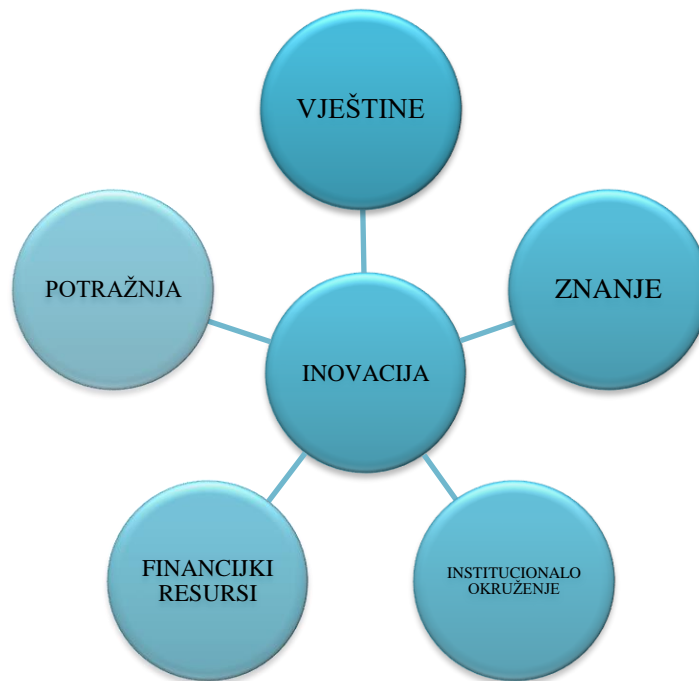
Slika 2. Shematski prikaz inovacijskog sustava [4]

Slikom 2. prikazan je inovacijski proces, odnosno u ovom kontekstu važno je istaknuti kako inovacije predstavljaju output različitih aktivnosti poslovnog sektora, te utjecaj inozemnih interakcija s javnim i privatnim sektorom. Shematskim prikazanom su istaknuti ključni procesi koji utječu na inovacijski sustav, a to su: znanje, kompetencije, potražnja, financijski resursi i institucionalno okruženje.