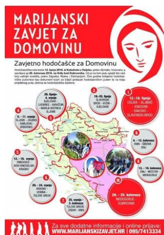
Slika 2 Marijanski zavjet za domovinu [4]