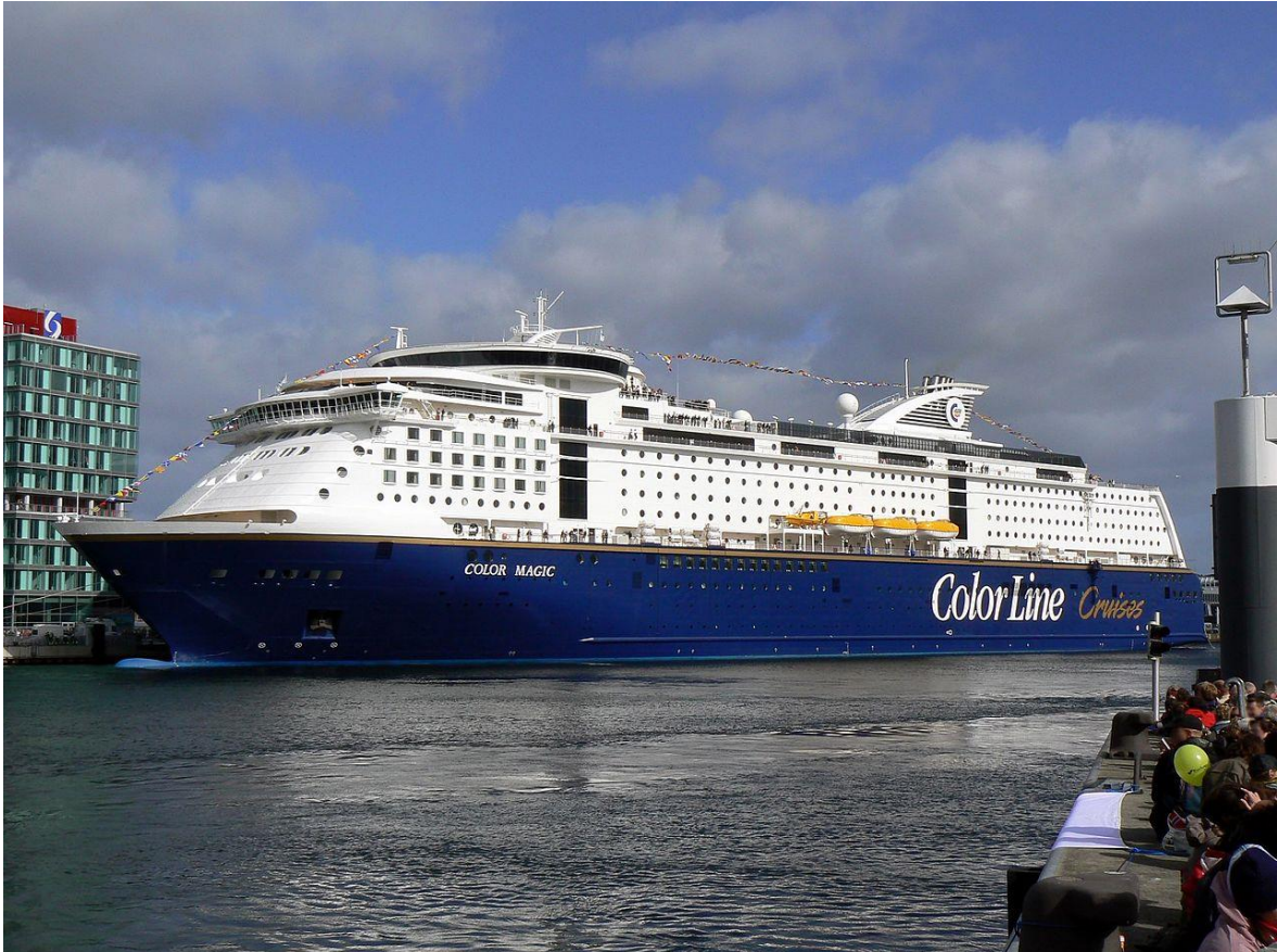
Slika 13. MS Color Magic [22]

mora, Sredozemlja, pa čak i sjevernog Atlantika. MS Color Magic je brod u vlasništvu i upravljanju norveške broderske kompanije Color Line, a plovi na ruti koja povezuje Oslo s Kielom. Izgrađen je u brodogradilištu Aker Finnyards Rauma u Finskoj 2007. godine i od tada je najveći trajekt na svijetu. Tonaža mu iznosi 75100 BT. Duljine je 224 m (LOA), širine 35 m (BOA) i gaza 6,8 m. Brod ima preko 1000 kabina te može prevoziti 2600 putnika i 550 automobila. Prikazan je na slici 13. [9][10][22]