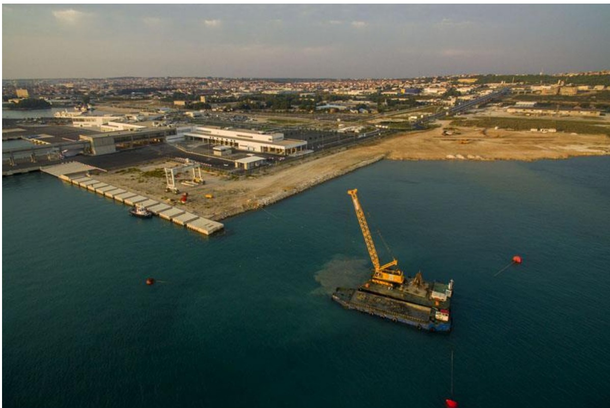
Slika 6. Obalni zidovi i zaštita nasipa Lot III C