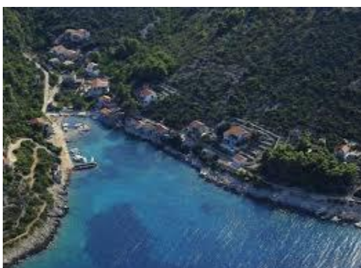
Slika 5. Donja Krušica [17]

Prije poznate Dražetine nalaze se još dvije manje uvale, uvala Crjeni i uvala Banja, Često su izletišta mještana iz Rogača. U uvali Crjenoj nalazi se litica visine od 5 m koja je mamac za djecu i početnike u skakanj. Dražetina je stjenovita, prazna uvala, bez objekata, udaljena od luke Rogač oko 1 NM, prikladna manjim brodovima. Također ne pruža dovoljno zaklona te je izložena sjevernim i istočnim vjetrovima.