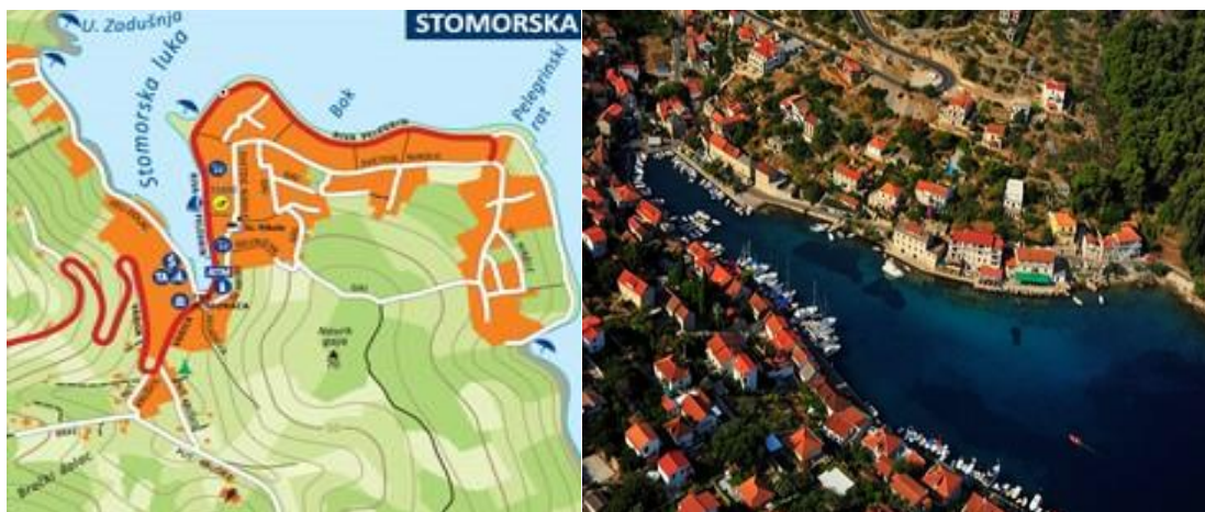
Slika 8. Stomorska [21]

Luka je, također, često utočište čarter flote što onemogućava sidrenje sobotom i četvrtkom. Jedna od obližnjih atrakcija, ponajviše za ronioce početnike, jest olupina ribarskog broda Ribolovac , potopljena kod Stomorske na poziciji Pelegrin i leži na dubini od 20 metara. [5]