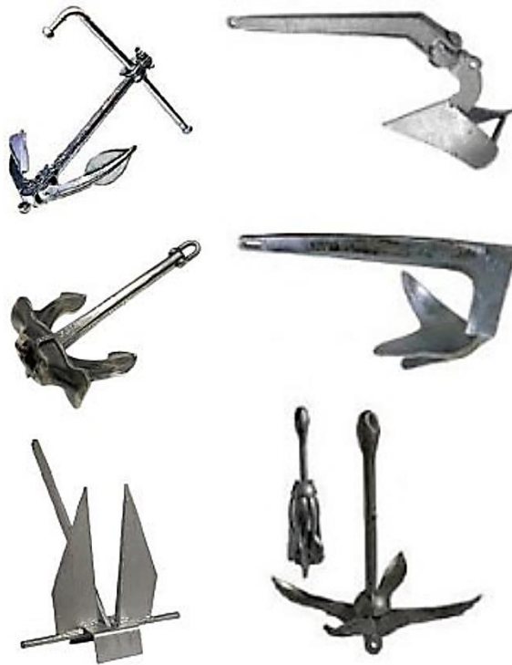
Slika 2. Vrste sidra [22]

Niz faktora igra ulogu u osiguravanju vašeg plovila: veličina sidrišta, vjetar, struje, topografija dna i dubina, te dostupna oprema. Postoji velika razlika između sidrenja u 5 metara vode na vidljivom pjeskovitom dnu i sidrenje na pramcu i krmi na dubokom sidrištu sa mutnom vodom. Osnovno pravilo je da minimalni omjer lanca na sidru i dubine treba biti 4:1. Iako je ovo općenito pravilo, treba uzeti u obzir dužinu lanca na dnu koji ovisi o okruženju na kojem ste usidreni.