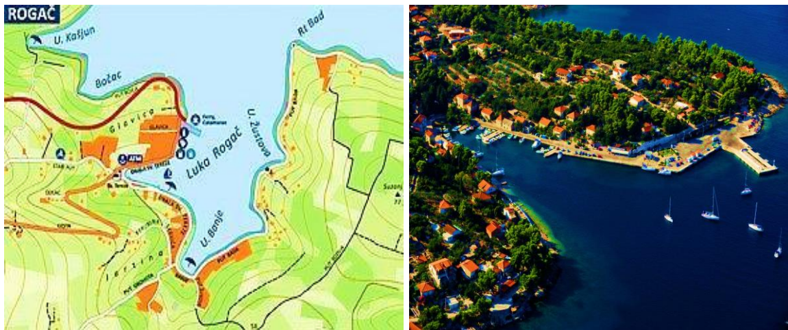
Slika 6. Luka Rogač [21]

Između Južnog rata i Rata najveći je zaljev otoka Šolte, Nečujam, uvučen u kopno 1 NM. Zbog svoje veličine, još se naziva i Gluha uvala. Orijentiri su svjetlo na rtu Bad, svjetlo na rtu Rat, zgrade hotelskog naselja te crkvice u blizini mola na istočnoj strani. Nečujam je poprilično zaklonjen od svih vjetrova osim bure. U zaljevu se nalaze još 6 uvala pogodnih za sidrenje brodova i jahti. Omiljena je destinacija domaćih izletnika te gostijma s charter flota koji noće u uvalama subotom i četvrtkom te je u tim danima gužva na sidrištima očekivana. Charter baze, najbliže u Splitu i Trogiru, službeni check in obavljaju subotom ujutro, a check out petkom navečer. Prema tome, iznajmljivači često, subotu nakon isplovljavanja, noće u nekim od obližnjih uvala, poput onih na otoku Braču ili Šolti. Također su na istim uvalama primorani noćiti i dan prije povratka u bazu.