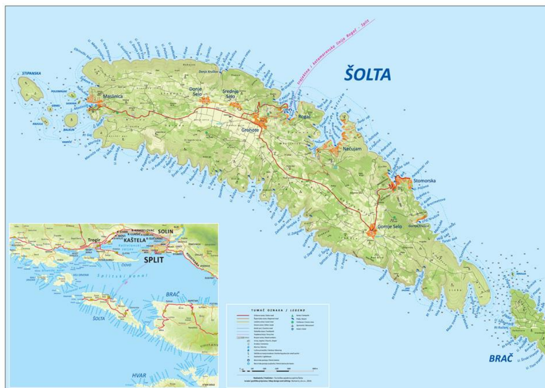
Slika 4. Uvale otoka Šolte [21]

Zbog bolje preglednosti, opisi uvala otoka su podijeljeni u tri potpoglavlja: sjeverni dio obale, južni dio obale i zapadni dio obale.