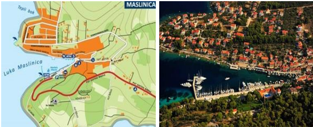
Slika 16. Maslinica [11]

Južno od Maslinice, smještena je uvala Šešula. Prividno ostavlja dojam sigurnog boravišta, no po snažnoj tramontani bolje iz uvale isploviti i naći drugo zaklonište. Na sjevernoj strani obale ima dva restorana koji nude muring za goste. U krajnjem kraku koji se sužava, nalazi se prekrasna šljunčana plaza. Najbolje se sidriti u istom kraku, na muljevitu i travom obraslu dnu. U južnom kraku je smješten kavez iz uzgajališta.