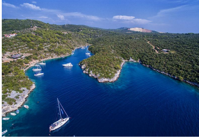
Slika 17. Uvala Šešula [23]

Najljepši prizor koji se pruža sa plaža Maslinice je na šoltanski arhipelag od 7 otočića: Balkun, Rudula, Grmej, Saskinja, Polebrnjak, najveći Stipanska, i hrid Kamčić. Oko otočića, također poznatom nautičarskom destinacijom, dubine su primjerene za sidrenje plovila svih veličina, ali na samoj poziciji prijete vjetrovi iz svih smjerova. Kod prijatnji od zapadnih vjetrova sidri se u zavjetrini otočića Balkun. Prolaženjem preko otočića Saskinja, najbližeg Maslinici, potrebno je voditi računa o gazu broda jer su prolazi uski, a najveća dubina doseže maksimalna 3,5 metra.