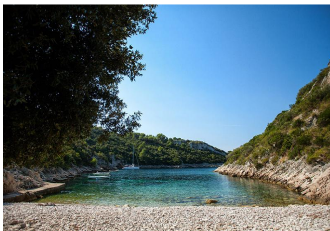
Slika 13. Senjska [23]