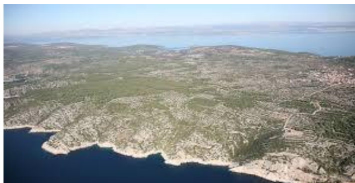
Slika 10. Uvale oko Splitske punte [24]