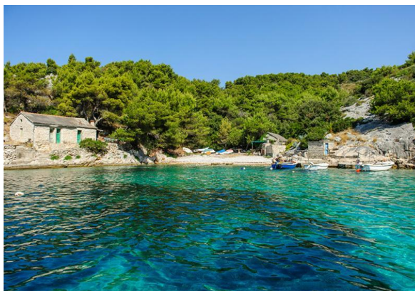
Slika 11. Uvala Zaglav [23]

Usred južne obale otoka Šolte, prepoznatljiva po strmim, klisurastim ulaznim rtovima nalazi se najpogodnije sidrište, uvala Tatinja. Ispred zapadnog rta i po sredini same uvale strše hridi kojima nautičari moraju pridati pozornosti zbog teške uočljivosti po noći. Na Tatinjina četiri kraka smještene su prekrasne plaže zaštićene od sjevernih i jugoistočnih vjetrova, ali je sama pozicija problematična pri promjeni s južnog na zapadno vrijeme.