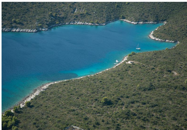
Slika 15. Uvala Livka [23]