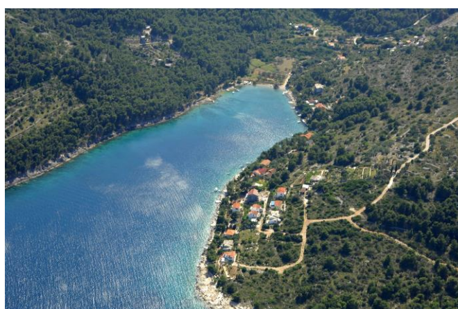
Slika 9. Gornja Krušica [14]