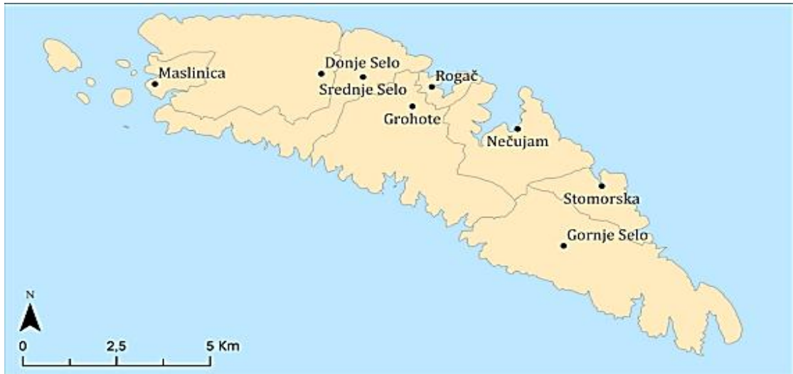
Slika 3. Karta otoka Šolte