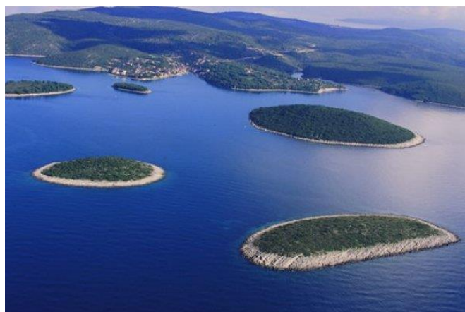
Slika 18. Šoltanski arhipelag [15]

Najljepši prizor koji se pruža sa plaža Maslinice je na šoltanski arhipelag od 7 otočića: Balkun, Rudula, Grmej, Saskinja, Polebrnjak, najveći Stipanska, i hrid Kamčić. Oko otočića, također poznatom nautičarskom destinacijom, dubine su primjerene za sidrenje plovila svih veličina, ali na samoj poziciji prijete vjetrovi iz svih smjerova. Kod prijatnji od zapadnih vjetrova sidri se u zavjetrini otočića Balkun. Prolaženjem preko otočića Saskinja, najbližeg Maslinici, potrebno je voditi računa o gazu broda jer su prolazi uski, a najveća dubina doseže maksimalna 3,5 metra.