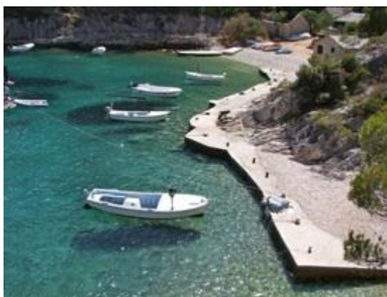
Slika 14. Uvala Stračinska [1]

Sa zapadne strane rta Motika naići ćemo na dvije uvale pogodnih za sidrenje zbog pješčanog dna. Vela Travnja je dovoljno uvučena u kopno, no prijete joj bibavice zapadnih vjetrova te ju je pametno i napustiti po jugu. Od zapadnog rta uvale, u smjeru juga, nalaze se Piramide . Naziv je pridodan zbog 6 podvodnih vrhova na dubinama od 25 metara i s bazama do 56 metara.