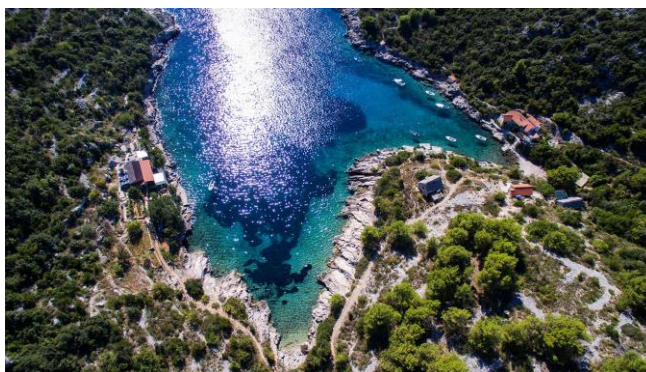
Slika 12. Uvala Tatinja [23]

Istočno od Tatinje nalazi se uvala Jorja. Plaža unutar uvale pokrivena je oblucima. Općenito dobro zaklonište, naravno osim po jugu i nevarama. Podno Jorjinog kraka nalazi se ugostiteljski objekt koji je postavio sidreni sustav sa plutačama za svoje goste i oduzeo prostor ostalim brodovima za sidrenje blizu plaže.