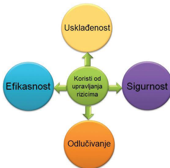
Slika 3. Koristi od upravljanja rizicima[1]

Upravljanje rizicima poduzeću povećava vjerojatnost uspjeha, smanjuje vjerojatnost neuspjeha i nesigurnost u postizanju sveukupnih ciljeva. Podrazumijeva odgovornost, mjerenje rezultata i nagrađivanje, čime se promovira operativna učinkovitost na svim razinama. Sustav upravljanja rizicima je proces koji osigurava veću vjerojatnost da će ciljevi poslovanja biti ispunjeni, a štete izbjegnute ili smanjene. Upravljanje rizicima poduzeću omogućava jasniji pogled u budućnost i potencijalne ishode, otvara nove vidike menadžmentu te procjenjuje ciljeve i strategije menadžmenta s obzirom na rizike. Ključna korist upravljanja rizicima leži u poboljšanju efikasnosti i učinkovitosti poslovanja. Kada su poslovni procesi efikasni i u skladu s procesom upravljanja rizicima, izabrana strategija omogućava postizanje planiranog. Dobro upravljanje rizicima usmjereno je na identifikaciju i tretman rizika. Također treba razumjeti utjecaj svih čimbenika koji mogu biti potencijalne prijetnje i uzrokovati negativne posljedice za poslovanje [1].