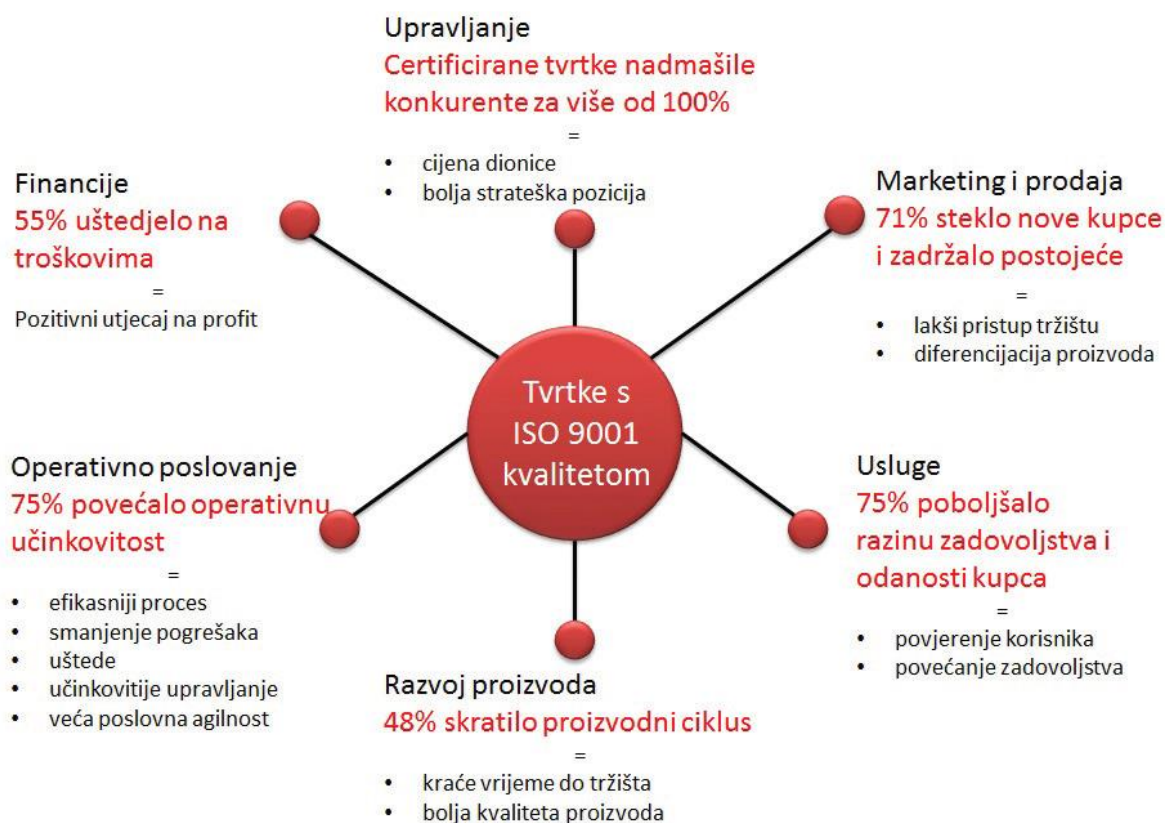
Slika 6. Koristi od implementacije sustava kvalitetom[1]

Mala poduzeća susreću se sa sličnim izazovima kao i poduzeća srednje veličine prilikom implementacije sustava upravljanja kvalitetom, ali mala poduzeća imaju brojne prednosti i neke zapreke prilikom implementacije [1].