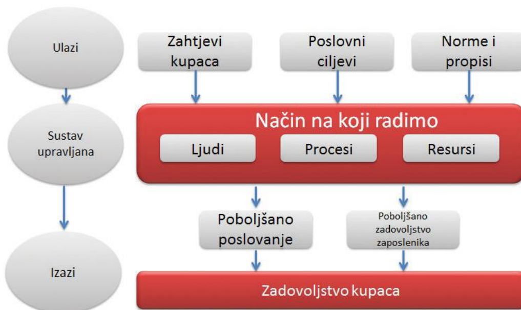
Slika 4. Prikaz sustava upravljanja u tvrtki [1]

Sustav upravljanja je okvir za procese koji se koriste da tvrtka može ispuniti sve zahtjeve potrebne za ispunjenje svojih poslovnih ciljeva. Često je teško uspostaviti organizaciju u poduzećima koja su ograničena financijskim i ljudskim resursima. Poduzeća s ograničenim resursima biraju samo sustave bez kojih ne bi ostvarili konkurentsku prednost na tržištu [1].