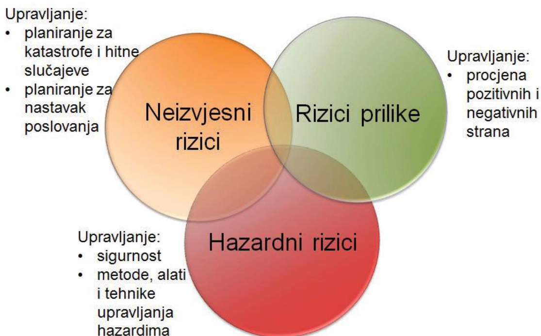
Slika 2. Osnovni tipovi rizika[1]