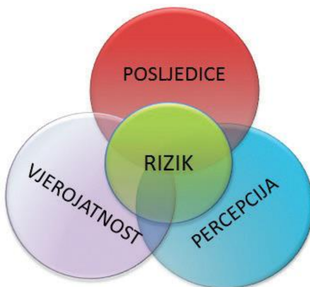
Slika 1.: Prikaz značenja pojma rizika[1]

Rizik je dio života, a sve što radimo uključuje rizik. Poduzetnici se često oslanjaju na intuiciju i iskustvo u upravljanju rizikom. Rizik predstavlja mogućnost nastanka događaja koji mogu nepovoljno utjecati na aktivnosti tvrtke i na ostvarenje njenih poslovnih ciljeva. Izgubljene prilike također se smatraju rizikom, zato se kod procjene rizika procjenjuju prednosti i nedostaci mogućeg ishoda [1].