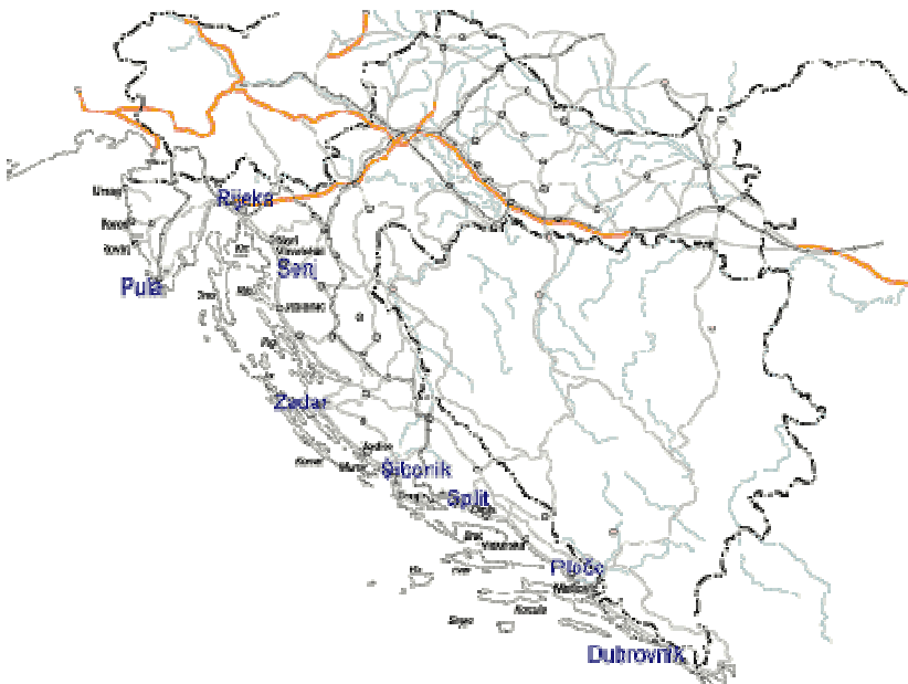
Slika 2: Lučke kapetanije Republike Hrvatske