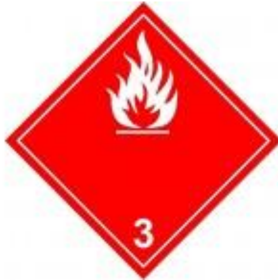
Slika 2. Oznaka zapaljivosti klasa [21]

Na slici 2. prikazana je oznaka zapaljivosti klase 3.