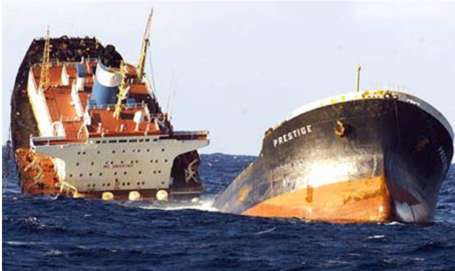
Slika 7. Nesreća tankera „Prestige“ [25]