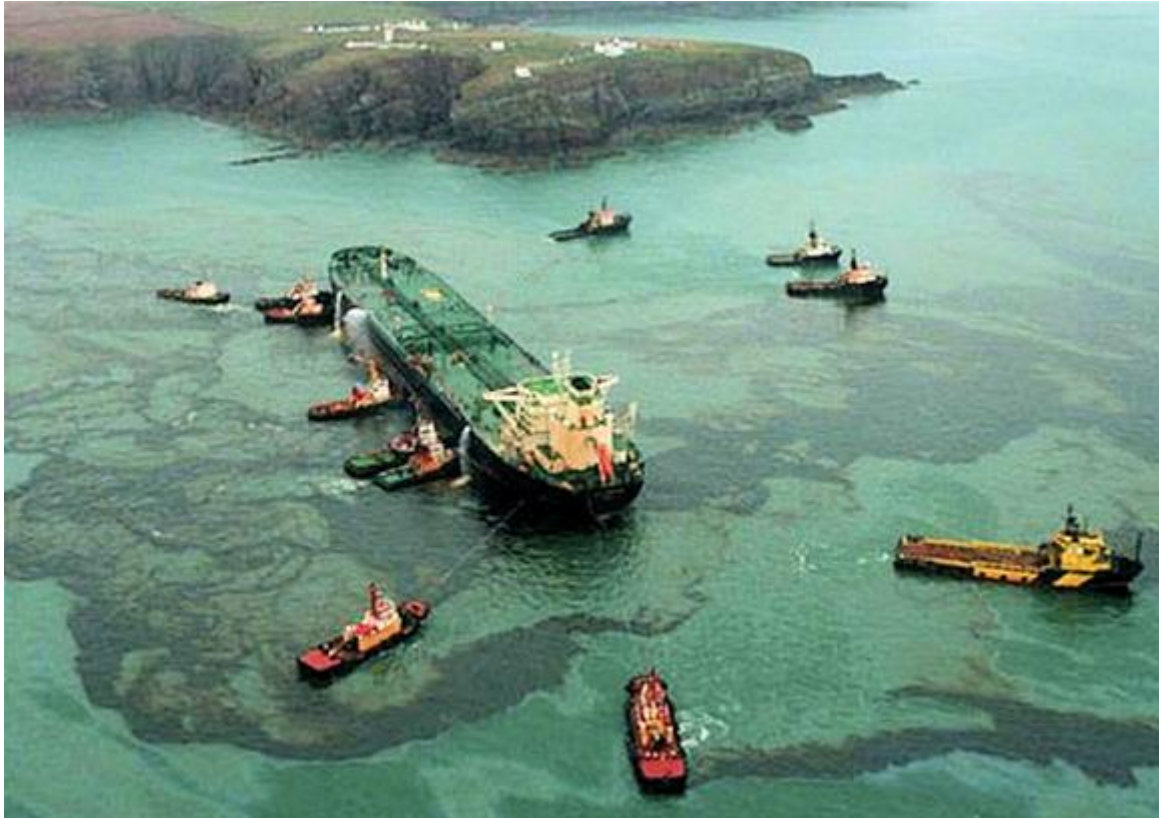
Slika 9. Nesreća tankera Sea Empress [27]