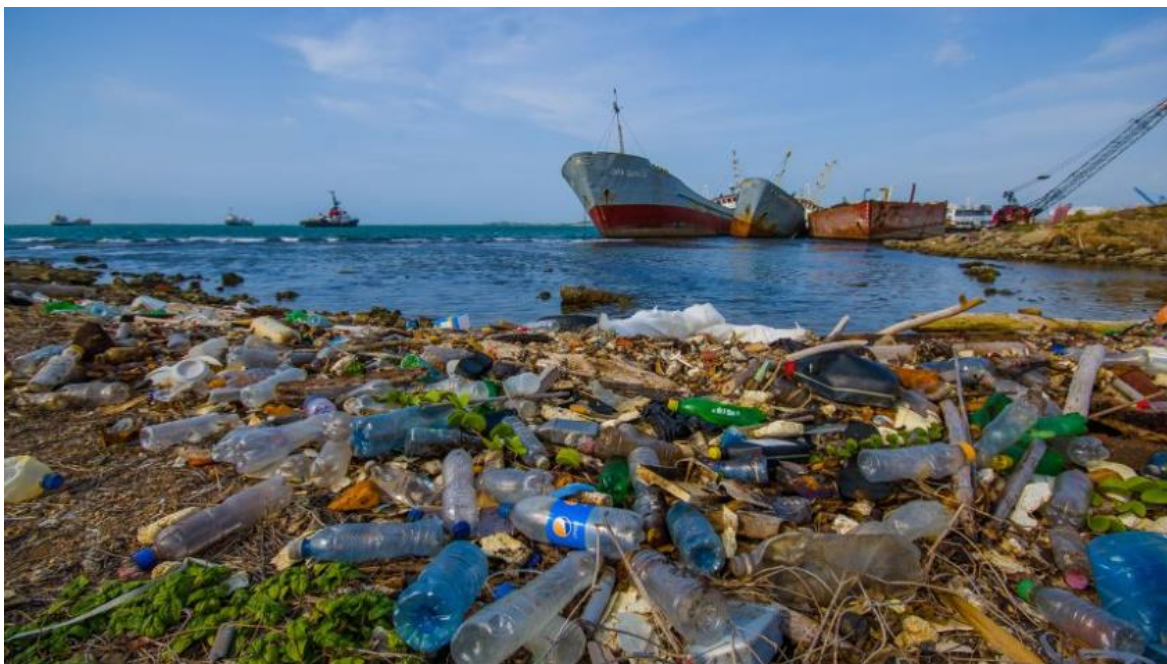
Slika 5. Primjer onečišćenja mora i morskog okoliša [24]

sistemske, uz prevenciju i edukaciju. Sa djelovanjem treba početi na kopnu [5]. Na slici 5. prikazan je primjer onečišćenja mora i morskog okoliša.