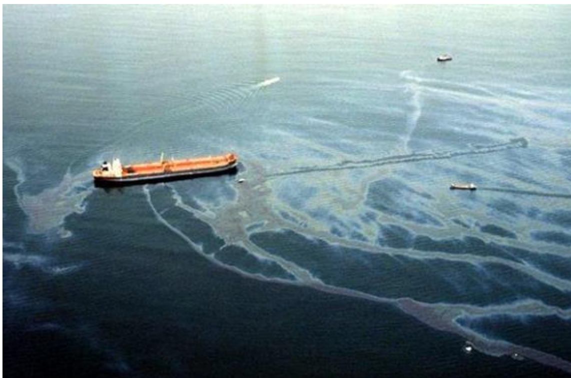
Slika 8. Exxon Valdez [26]