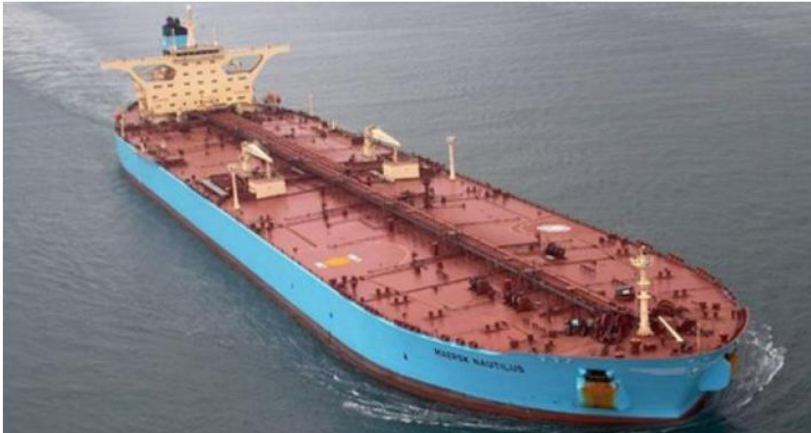
Slika 4. Supertanker [23]

Nakon iskrcaja nafte, u tankovima se mora izvršiti pranje tankova. Kod tankera za prijevoz ulja, pranje tankova vrši se pomoću sirove nafte da bi se smanjila količina taloga koja ostaje nakon iskrcaja. Za pranje se koriste fiksni strojevi koji mogu biti jednostupanjski i višestupanjski. Tankeri za prijevoz sirove nafte koriste morsku vodu za pranje tankova. Jako je važno napraviti pročišćavanje kako bi se spriječila pojava statičkog elektriciteta. Način pranja tankova kod tankera za prijevoz kemikalija ovisi o teretu. Prilikom pranja tankova mora se osigurati inertno stanje, tj. stanje u kojem je sadržaj kisika u atmosferi tanka smanjen na 8% volumena ili manje, dodavanjem inertnog plina [2].