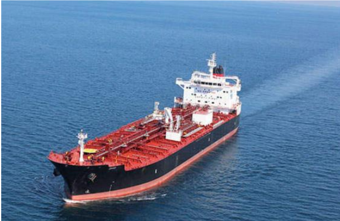
Slika 3. Tanker za prijevoz naftnih derivata [22]

S obzirom na nosivost tankeri se mogu podijeliti na: