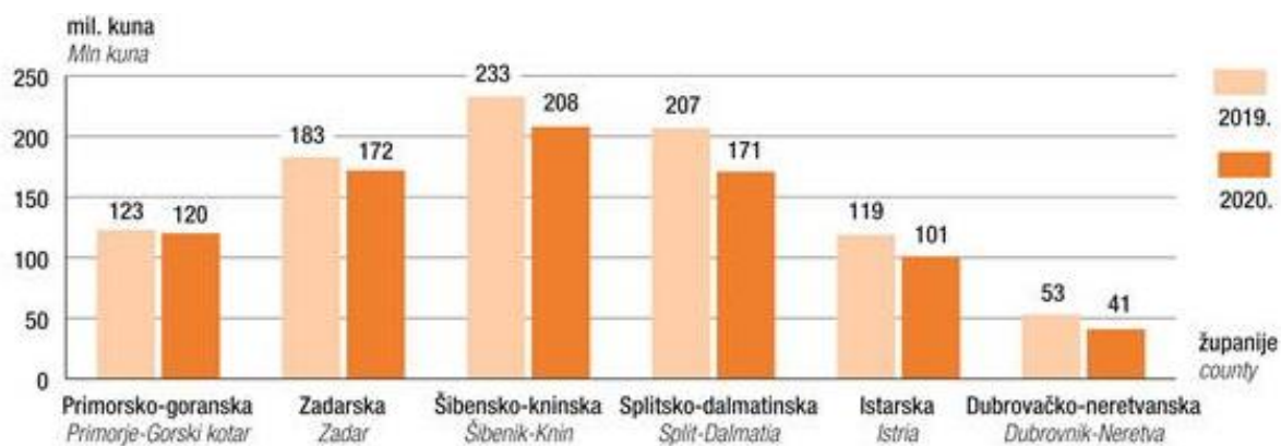
Slika 3. Ostvareni prihod luka nautičkog turizma bez PDV-a u Hrvatskoj 2019. i 2020. godine [20]

Primorsko-goranska za 6,6%, Splitsko-dalmatinska za 6,3% te Dubrovačko-neretvanska za 5,3%). Kao posljedica pandemije COVID-19 i svih popratnih epidemioloških mjera rezultat je pad broja plovila u tranzitu u odnosu na 2019. za 40,7%. Ukupno ostvaren prihod luka nautičkog turizma promatrane je godine iznosio 812 milijuna kuna, što je za 11,6% manje u odnosu na baznu godinu. Sve županije ostvarile su pad ukupnog prihoda u odnosu na 2019. što prikazuje Slika 3. [20].