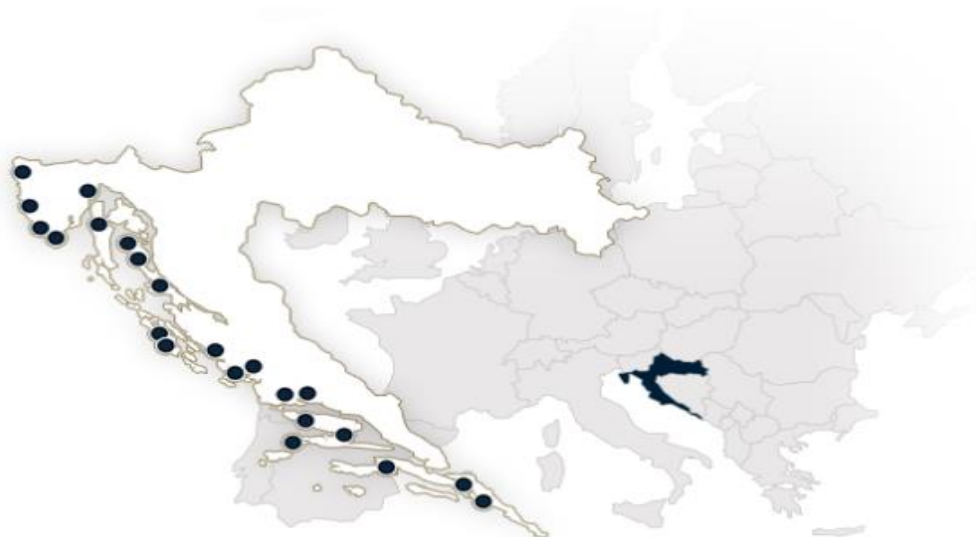
Slika 4. ACI marine rasporedene duž obale Jadranskog mora[22]

Nakon upoznavanja s pojmom marina i nabranja nekih od bitnijih marina u Hrvatskoj, u nastavku će biti riječ o konkurentnosti istih.