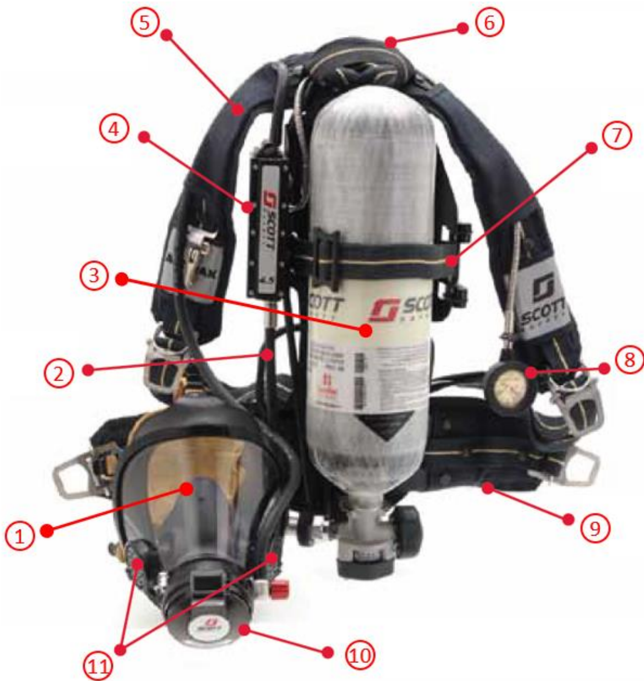
Slika 4. Dijelovi uređaja za disanje. [7]