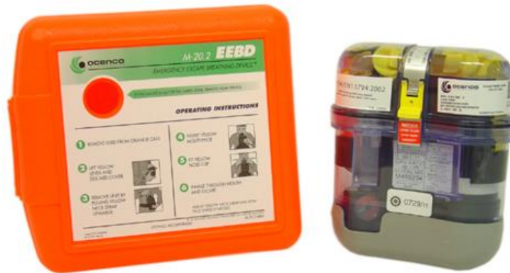
Slika 2. Primjer hard bag pakiranja EEBD. [21]