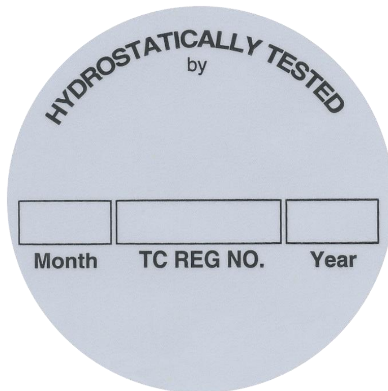
Slika 6. Oznaka kojom se potvrđuje hidrostatski ispitana boca. [18]

Hidrostatska ispitivanja provode se kako bi se otkrilo curenje, slabosti, neispravni dijelovi ili oštećenja te kako bi osigurali da će boce izdržati pod pritiskom tijekom stvarne primjene. [11]