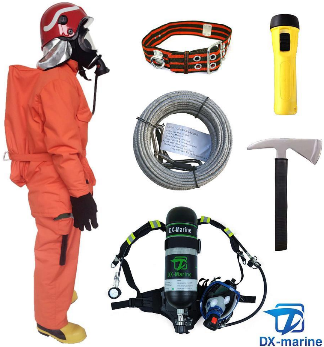
Slika 1. Komplet protupožarne opreme. [3]

vertikalnoj zoni. Komunikacija sa vatrogascima je omogućena putem radiotelefonskih uređaja za dvosmjernu komunikaciju u protueksplozijskoj ili sigurnosnoj izvedbi, a svaki pojedini tim za gašenje požara ima 2 takva uređaja. [25]