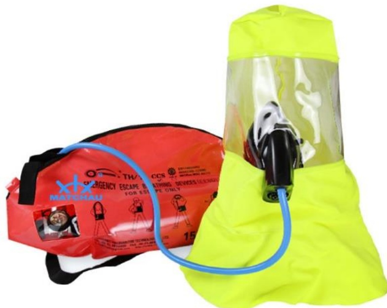
Slika 3. Primjer soft bag pakiranja EEBD. [12]