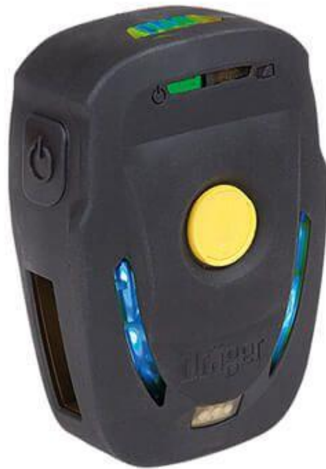
Slika 5. PASS. [4]

Osnovni dodatak i dio opreme SCBA aparata je osobni sigurnosni sustav upozorenja (engl. Personal Alert Safety System - PASS ). PASS služi za slanje signala pomoću zvučnog alarma visoke razine čujnosti da je vatrogasac u opasnosti. Alarm se može aktivirati ručno ili automatski kada nije detektiran pokret u postavljenom vremenu, a nalazi se na pojasu za pričvršćivanje. [16]