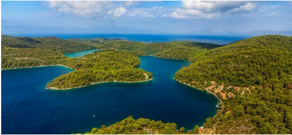
Slika 1 Nacionalni park Mljet [2]

morska brana, urediti šetnica te povećati atraktivnost ponude temeljene na prirodnoj i kulturnoj baštini.