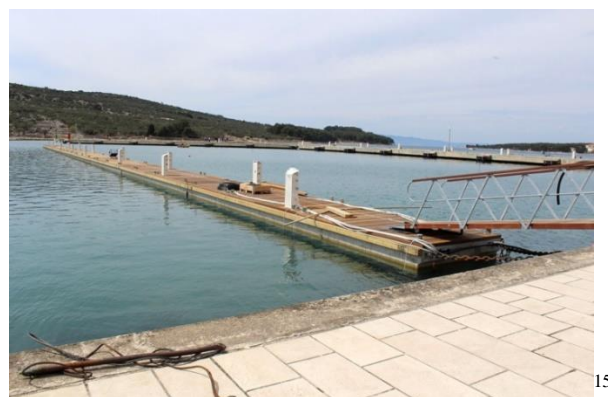
slika 5 ACI marina Cres, montiranje pontona [15]

Jedan od primjera ugradnje novijih vrsta pontona u Hrvatskoj je izgradnja 8 novih pontona u ACI marini Cres, od strane investitora ACI Club dd Opatija. ACI marina cres ima 470 vezova od čega je 5 vezova dizajnirano za megajahte. Novi pontoni su instalirani 2015 godine.[15] U ovom poslu teškom 2 milijuna eura, demontirani su i uklonjeni stari gatovi, a novih 8 je instalirano sa svojim sidrenim sustavima gatova i plovila te kompletnom vodenom i električnom instalacijom. Zamjenom dotrajalih pontona novijim, kvalitetnijim uvelike se podigla kvaliteta i ponuda nautičarima.[15]