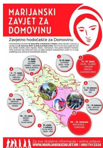
Slika 2 Marijanski zavjet za domovinu [4]