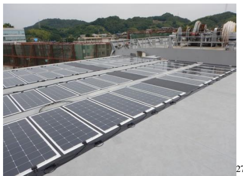
Slika 7 Solarne čelije na brodu MS Paolo Topic [27]

Također, fotovoltaižni sistemi se mogu ugrađivati i u preoceanske brodove. Prvi solarni hibrid, brod za rasuti teret MS Paolo Topic, ima ugrađene solarne čelije. Najveći problem kod ugradnje čelija je otežavanje operacije utovara i istovara, međutim, inovativnom tehnologijom “lako uklonjivih” čelija, taj je problem riješen. Instalacijom ovog sustava, potrošnja goriva se drastično smanjila, samim time i troškovi poslovanja. Brodski motori, baterije i energija generirana iz solarnih panela su kontrolirane od strane centralnog sustava za održavanje energije u brodu.[24]