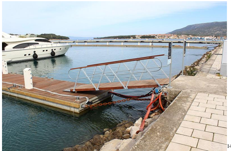
Slika 4 ACI marina cres - novoizgrađeni ponton [14]

Plovci odnosno uzgonski elementi su zatvorene vodonepropusne komore ispunjene poliuretanskom pjenom.