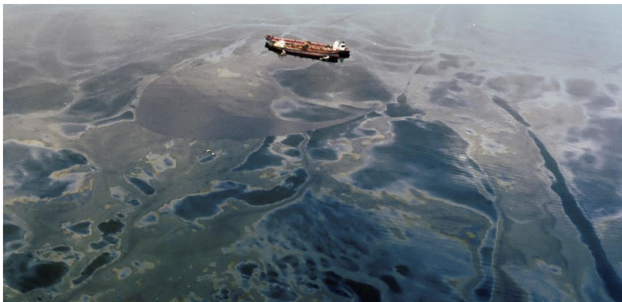
Slika 1. Izljev nafte uslijed nesreće tankera Exxon Valdez.

Slika 1. prikazuje izljev nafte uslijed nesreće tankera Exxon Valdez , koja je ostala zabilježena kao jedna od najvećih naftnih ekoloških katastrofa u novijoj američkoj povijesti.