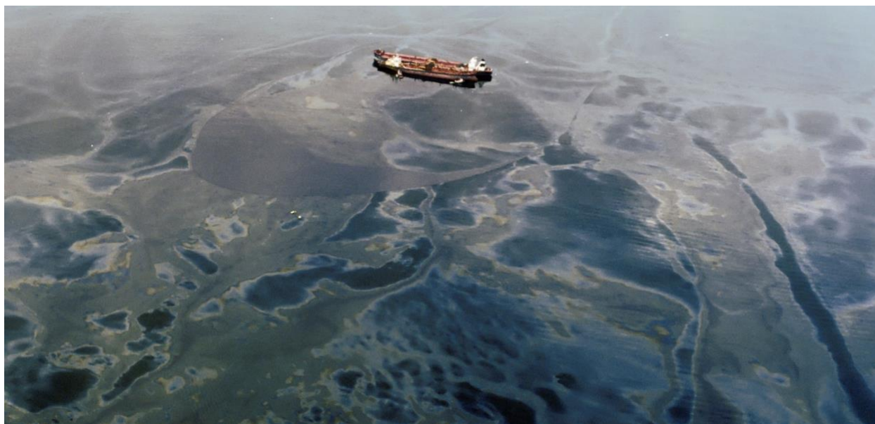
Slika 1. Izljev nafte uslijed nesreće tankera Exxon Valdez.

Slika 1. prikazuje izljev nafte uslijed nesreće tankera Exxon Valdez , koja je ostala zabilježena kao jedna od najvećih naftnih ekoloških katastrofa u novijoj američkoj povijesti.