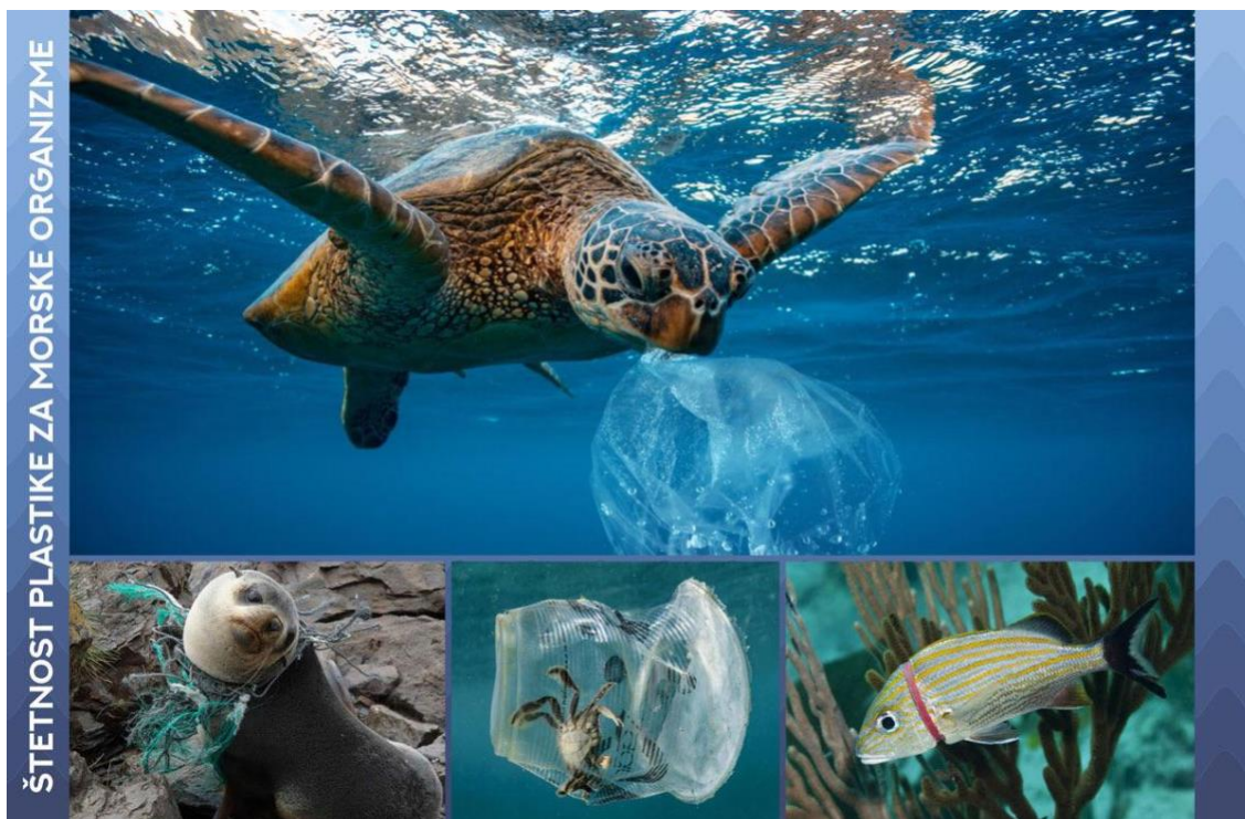
Slika 2. Kruti otpad poput plastike onečišćuje more i utječe na živa bića u moru.

u pogledu moguće štete. Klimatski sustav kontrolira morske struje, a time i učinke morskih zagađivača. Svaka promjena klime ima za posljedicu promjenu stanja opterećenja mora.