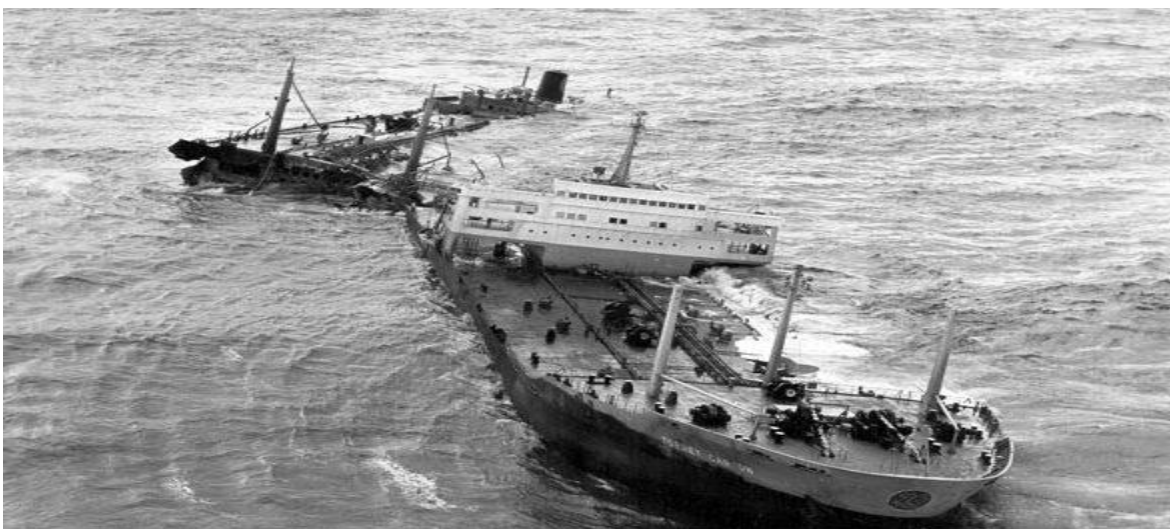
Slika 3. Nesreća tankera Torrey Canyon . Izvor: https://safety4sea.com/cm-torrey-canyon-the-worlds-first-major-oil-tanker-disaster/ (17.9.2022.)

Velika ekološka nesreća se dogodila u proljeće 1967. godine, kada se tanker Torrey Canyon nasukao se prilikom ulaska u La Manche i izlio cijeli teret od 120 000 tona sirove nafte u more. To je rezultiralo najvećim incidentom zagađenja uljem ikada zabilježenim prije tog vremena. Incident je pokrenuo ozbiljna pitanja, ne samo u vezi s radnjama koje bi država mogla poduzeti kada joj prijete zagađenja uljem kao rezultat nesreće, već i u vezi s osnovom i postupcima za kompenzaciju državama ili drugim subjektima koji bi mogli pretrpjeti štetu kao posljedicu nesreće. Posebno je bila izražena zabrinutost u pogledu primjerenosti postojećeg sustava odgovornosti i naknade takve štete. [6]