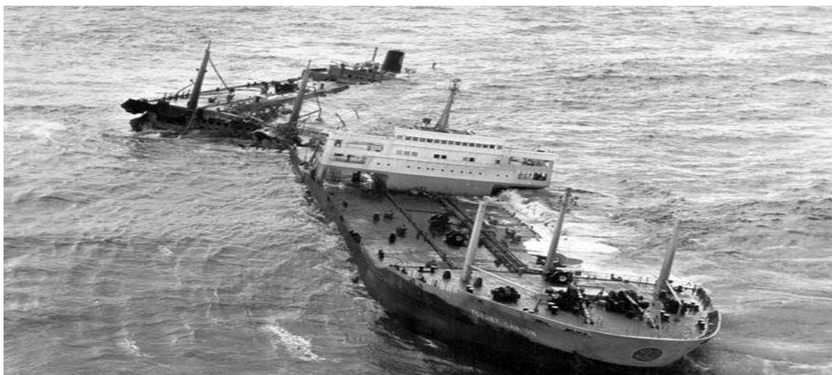
Slika 3. Nesreća tankera Torrey Canyon.

Velika ekološka nesreća se dogodila u proljeće 1967. godine, kada se tanker Torrey Canyon nasukao se prilikom ulaska u La Manche i izlio cijeli teret od 120 000 tona sirove nafte u more. To je rezultiralo najvećim incidentom zagađenja uljem ikada zabilježenim prije tog vremena. Incident je pokrenuo ozbiljna pitanja, ne samo u vezi s radnjama koje bi država mogla poduzeti kada joj prijete zagađenja uljem kao rezultat nesreće, već i u vezi s osnovom i postupcima za kompenzaciju državama ili drugim subjektima koji bi mogli pretrpjeti štetu kao posljedicu nesreće. Posebno je bila izražena zabrinutost u pogledu primjerenosti postojećeg sustava odgovornosti i naknade takve štete. [6]