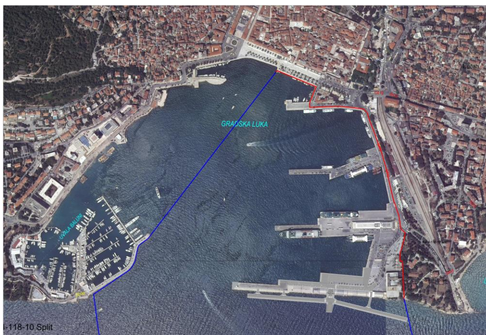
Slika 2. Bazen-gradska luka, Split