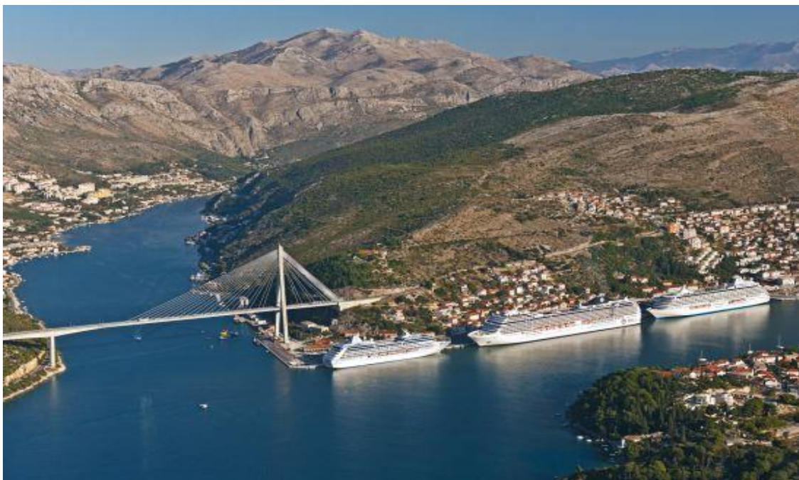
Slika 4. Kruzeri u Dubrovniku

Kružna putovanja nude spoj prijevoznih i turističkih usluga. Pojam turističke usluge odnosi se na turističke destinacije koje sadrže djelatnosti koje pridonose kvaliteti usluge te destinacije (kockarnice, rekreacijski centri, muzeji i dr.). Turističke agencije zbog takvog rasporeda tržišta te relativno velike udaljenosti nude prijevoz zrakom od i do luke polazišta. Prijevozna ili prometna funkcija kružnog putovanja zadatak je brodarskog poduzeća koje je specijalizirano upravo za takve brodarske djelatnosti. Jedno takvo poduzeće stavlja na raspolaganje brod i posadu dok su ostale funkcije prepuštene turističkim agencijama. Luke i terminali važan su element prijevozne funkcije u cjelokupnoj ponudi turističke usluge jer su jedan od prvih čimbenika sa kojim se turisti susreću do određene turističke destinacije. Organizacija kružnih putovanja složen je proces koji iziskuje suradnju osim brodarskih i lučkih djelatnosti usluge poput ugostiteljskih, usluge zračnog prometa, kulturoloških ustanova, trgovine, raznih turističkih agencija i dr. Kružna putovanja predstavljaju jednu međusobnu ovisnost između pomorskog prometa i turizma. Tako na slici br.4. možemo vidjeti kruzere pristale u biseru jadranskog mora Dubrovniku.