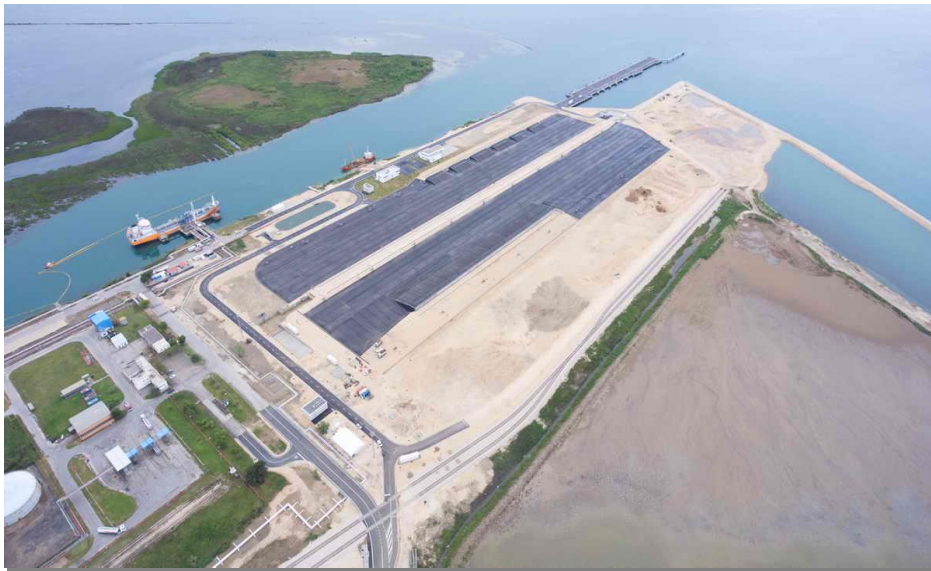
Slika 1. Terminal rasutih tereta, luka Ploče

Terminal je mjesto na kraju transportnog puta za prijelaz i prihvat putnika ili robe i rukovanje teretom i njegovom dostavom.[2] To su prometna čvorišta između kopnenog i pomorskog prometa, mjesto susreta dvije ili više prometnih grana a, ujedno i glavna karika na transportnom putu robe od proizvođača do potrošača. Na terminalima se roba skladišti, uzdržava, pakira i ostale usluge vezane uz robu. Slika br. 1. pokazuje terminal rasutih tereta u luci Ploče.