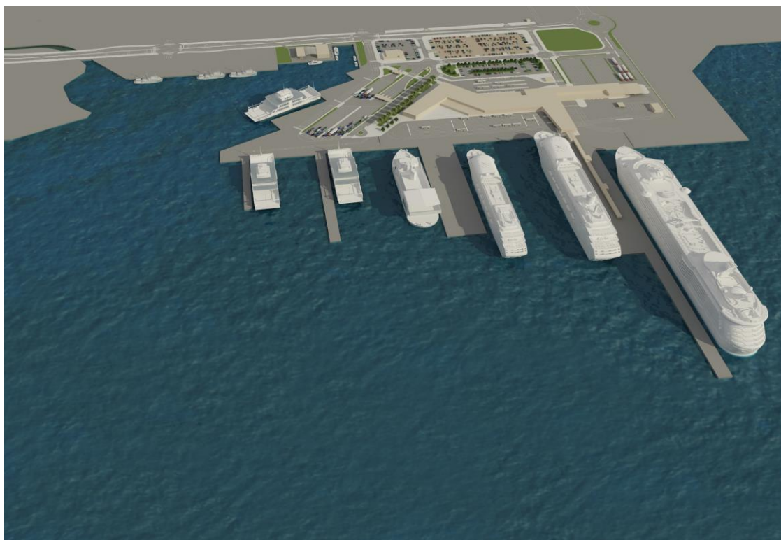
Slika 5. Interaktivna karta luke Gaženica