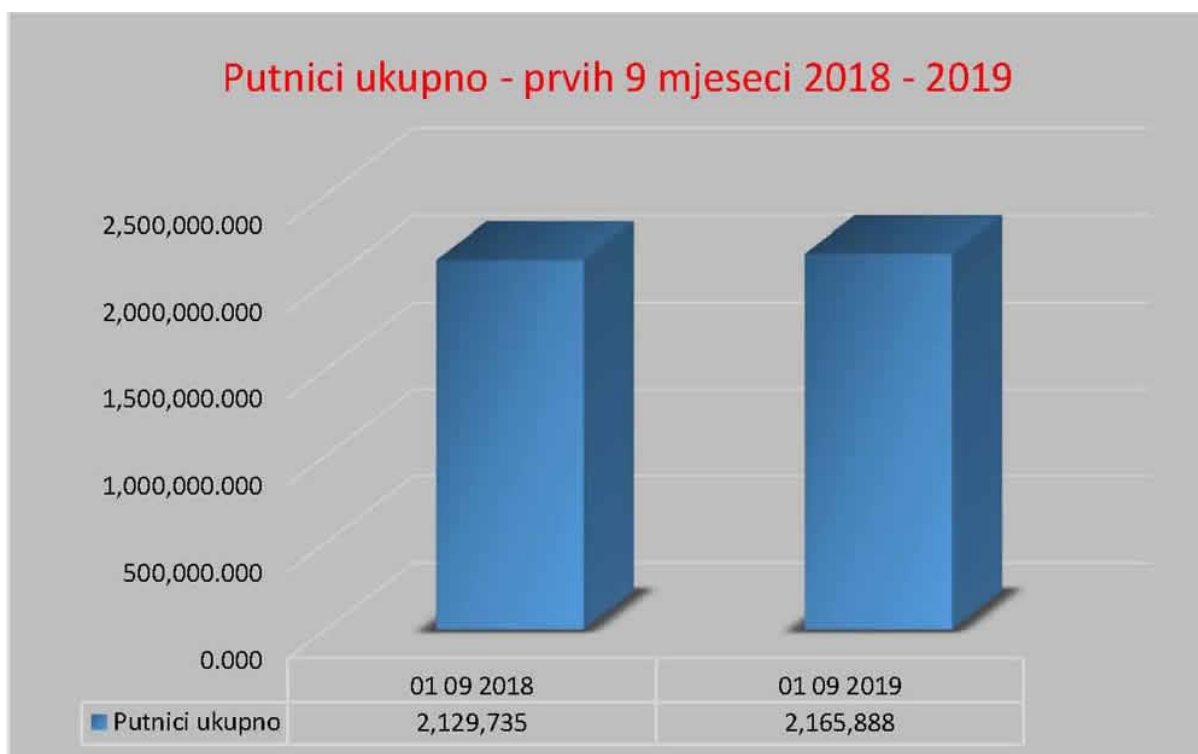
Slika 7. Pokazatelj ukupnog broja putnika za luku Gaženicu u razdoblju 2018. - 2019.