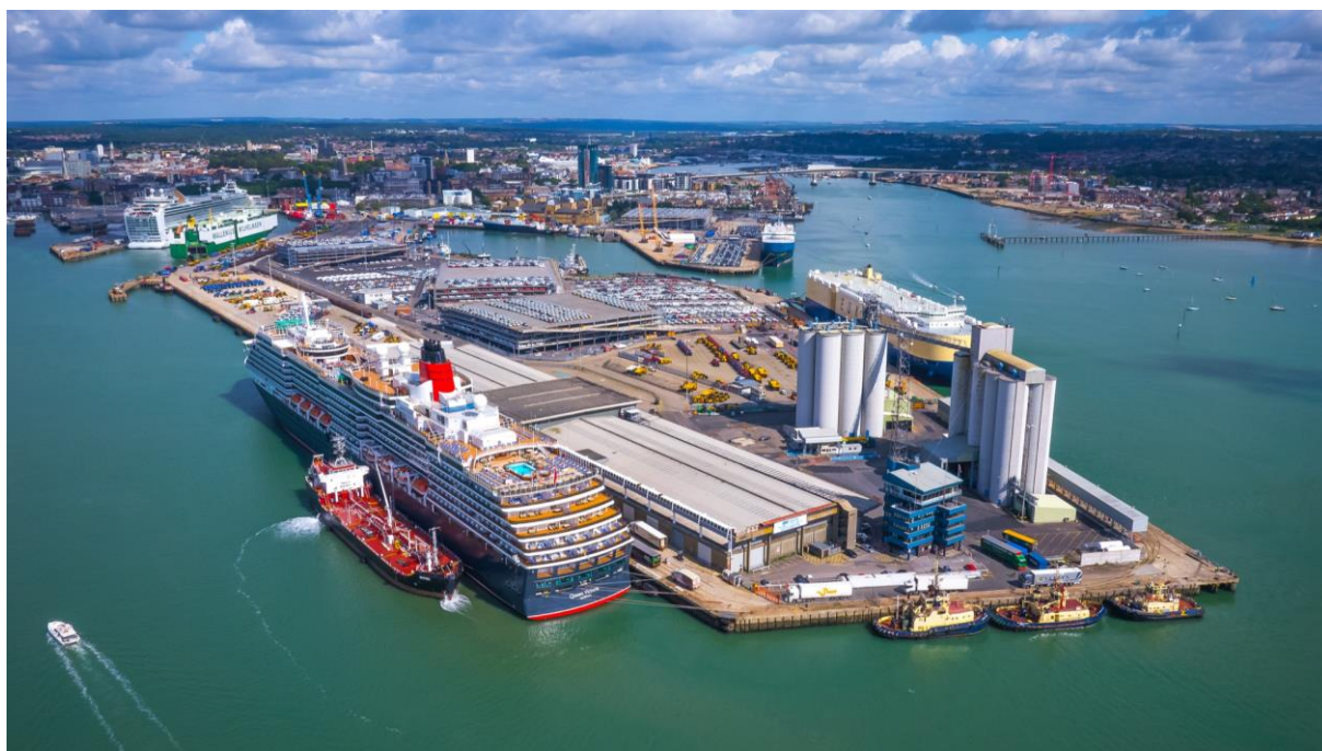
Slika 3. Terminal za kružna putovanja u Southamptonu